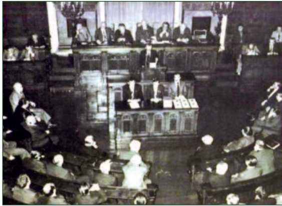
Jubileumi közgyűlés köszöntötte a BLSZ 50. születésnapját

„Életkép” a hetvenes évekből, a BLSZ harmadosztályból. Már a csapatneveknek is zamata van: Mértékszabóság–Belker Szállítók