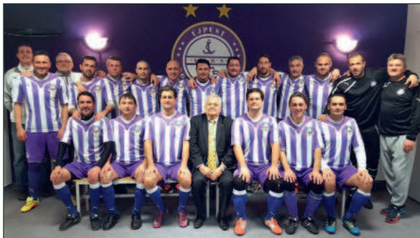
Bár 2016 óta nem végzett az élen, az öregfiúk között az Újpest nyerte a legtöbb bajnoki címet

A játék szeretetének kortalan-ságát jelezte, hogy 2010 körül már az Old boys bajnokságból is igen sok játékos „kiöregedett”. A szövetség újra reagált a csapatok igényére, és 2011-ben kiírta az 54 év fölöttiek számára az első BLSZ Veterán bajnokságot. A lelkesedés itt is tartósnak bizonyult, és jelenleg két osztályban közel harminc csapat alkotja a „legrutinosabbak” mezőnyét, ahol a 70 év fölötti játékos sem ritkaság a mérkőzéseken, akik valóban bizonyítják, hogy a futballt egy életen át kell játszani.