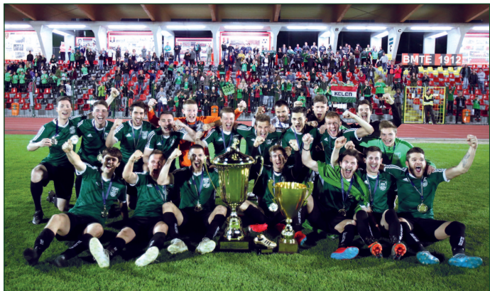
2019-ben a Kelen SC „mindent vitt” – a Budapest Kupát és a budapesti elsőosztályú bajnokságot is megnyerte