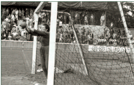
A labdarúgópályákon azt mondanánk, igazi vonalkapus... A később a labdarúgásra váltó nők közül sokan a kézilabdával kezdték sportpályafutásukat. Az első „igazi” női labdarúgó-csapat is a nagypályás kézilabdázókból verbuvált alakulat volt, amely az Elektromos kölyökkfutballistáival játszott, 1946. július 6-án, a Vasas–Ferencváros NB I-es bajnoki labdarúgó-mérkőzés után

A BLASZ igyekezett népszerűsíteni is az új sportágot. Debrecenben, Veszprémben, és Gyöngyösön is rendezett bemutató mérkőzéseket, és 1928. október 7-én már nemzetközi mérkőzés is szerepelt a kézilabdások műsorán. A BLASZ osztrák női válogatottat hívta meg Budapestre, s az osztrák lányok nagy fölényrel, 11:1 arányban győztek a magyar válogatott ellen. A BLASZ fennhatósága alatt 1933-ig volt a kézilabda „gazdája”. Az úttörő munkát elvégezte, s átadta az irányítást a Magyar Kézilabdázó Egyesületek Szövetségének.