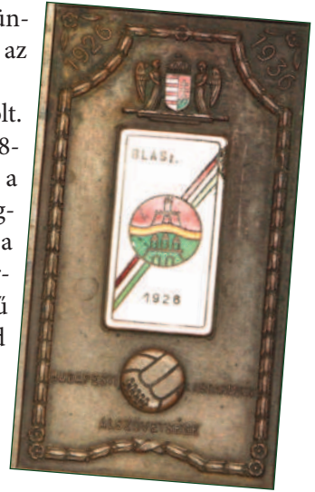
Plakett a 10 éves évfordulóra

Mindezek felőrölték idegrendszerét és 1946. augusztus 24-én, Árnas utca 80. szám alatti házában felakasztotta magát. A budapesti amatőr futball első, kiváló vezetőjének élete tragikus körülmények között fejeződött be.