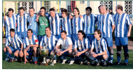
2009-ben az RKSK nyerte el a Budapest Kupát

A döntők viszont sohasem okoztak csalódást!