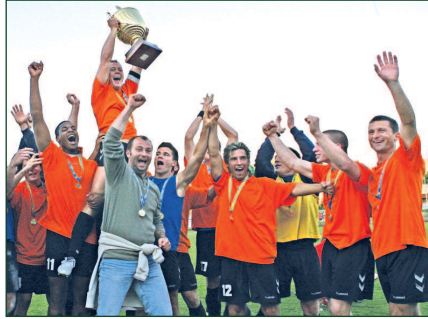
2007-ben a TF csapata nyerte el a Budapest Kupát