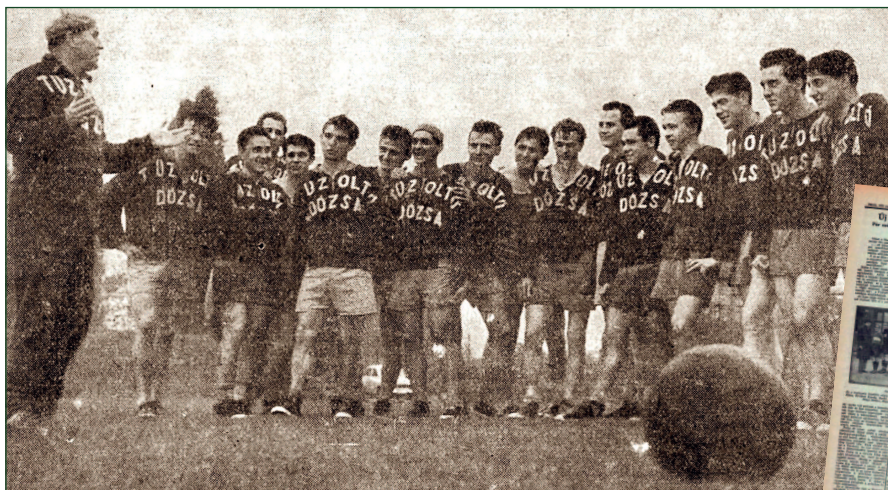
A Tüztoló Dózsa a 60-as években kétszer lett Budapest Bajnoka

1948–1949: Újlaki FC, Csepeli MTK II (Csepel Vasas II), FTC II (ÉDOSZ SE II), UTE II (Bp. Rendőr Egylet) 1949–1950: Zsolnay MSE, Fésűfonó, Lampart, 33 Ganz Villany (Vasas Ganzvillany) 1950 ősz: Előre MÁVAUT, Fonómunkás RTC, Törökőri Vasas, Óbudai Lombik 1951: Vasas Magyar Acél, Vasas Standard, Kőbányai Lokomotív, Vörös Lobogó Kistext, Szikra Kénsavgyár 1952: Előre Belsped, Óbudai Építők, Mátyásföldi Honvéd Iljusin SK, Pesterzsébeti Vasas, Vasas Kerámia 1953: Előre Belsped, Pénzügyőrök SE, Vasas Generátor, Bp. Spartacus, Vörös Lobogó Kistext 1954: Bp. Szállítók, Vasas Kábelgyár, Vasas Kismotor SK, Kinizsi Húsos, Vörös Lobogó Kistext 1955: Bp. Építők, Szikra Gázművek, Bástyai Városi Tanács SK, VL SorTex, VL Jacquard SK 1956: Vasas Láng-gépgyár SK, Dél-Budai Spartacus SC, Vasas MÁVAG, XX. ker. Bástyai, VM Vendéglátó