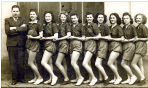
Zsánerkép – igaz, csak kilenc játékosal – az újpesti kézilabda-csapatról. A frizurák, a mosolyok tökéletesek, a nadrágok a fotóhoz igazodnak, a cipők viszont aligha ideálisak a játékhoz