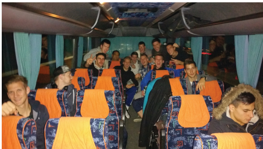
A jó kedv hazafelé is megmaradt

A 69. percben Keresztesi Botond már nem kegyelmezett, Spáth Márton remek labdája után, támadónk egy csel után 10