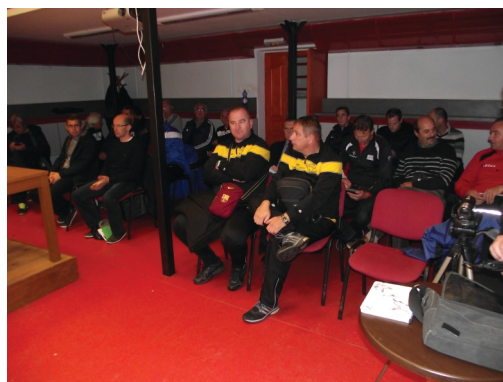
Tetszett a BLSZ-s edzőknek az előadás