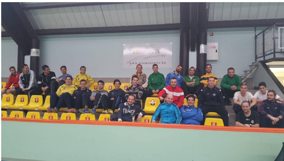
A Budafokon megtartott 'C' tanfolyam egyes csoportjának résztvevői

A 2015-ös évben három C-licences tanfolyam volt Budapesten. A férfiak számára kiírt csoportok létszáma 24 illetve 25 fő volt, elsőre összesen 48-an tettek sikeres vizsgát, ketten pedig sikeresen pótvizsgáztak. A nők számára kiírt tanfolyamot 18-an kezdték el, közülük 14-en vizsgáztak le. A férfiak számára az előadásokat és a gyakorlati órákat Kiss Baranyi Sándor tartotta, a nőknél Sárközi István vizsgáztatott. A tanfolyamok nyolc napból álltak, az utolsó két napon volt az elméleti és a gyakorlati vizsga. Ezek az edzők, akik erre a tanfolyamra jelentkeztek és felvétel nyertek, majd most elvégezték, az utánpótlásképzés alapjaival ismerkedtek meg.