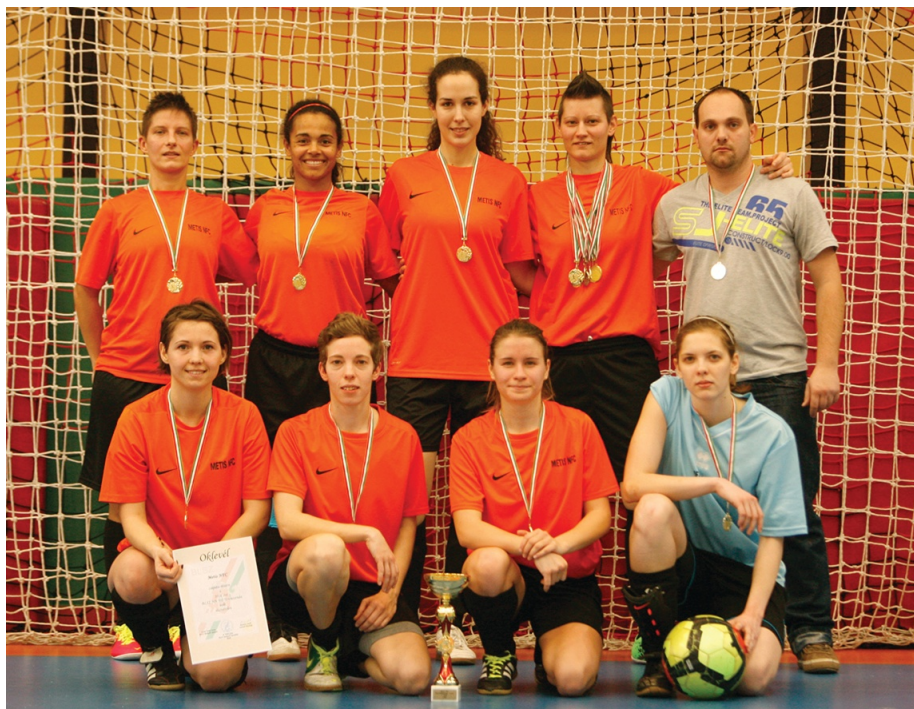
Teremben is nyerő volt a Metis!

Az elődöntőben a Metis egy korán szerzett találatlal 1-0-ra nyert az Astra ellen, míg a Csepel 2-0-ra bizonyult jobbnak a Fortuna csapatánál. A döntőben a Metis 2-0-ra elhúzott, taktikus játékkal tartotta előnyét, és hiába igyekezett a Csepel,