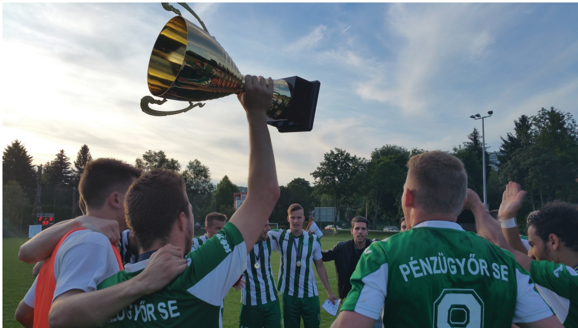
Magasban a kupa, bajnok a Pénzügyőr!

A Pénzügyőr SE már 2014 nyarán is megérdemelte volna a feljutást, de akkor végül egy végletekig tartó páros versenyfutás után a hasonló erőt képviselő III. Kerületi TVE jutott révbé. Nagy volt a csalódás az egyesületnél, ugyanakkor volt előnye is az újabb BLSZ I-es évnek, tovább építhették látványos futballt játszó csapatukat. Az új bajnokság kezdete előtt úgy tűnt, hogy hasonló erejű ellenfél híján könnyedén húzzák majd be a bajnoki címet. A Pénzügyőr sorba hozta is a három pontokat, de meglepetésre két rivális is tudta vele tartani a lépést, az Ikarus BSE és a THSE-Sashalom is remek őszi idényt futott, a forduláznál öt pontra voltak csak lemaradva az első helyen álló pasarétiektől.