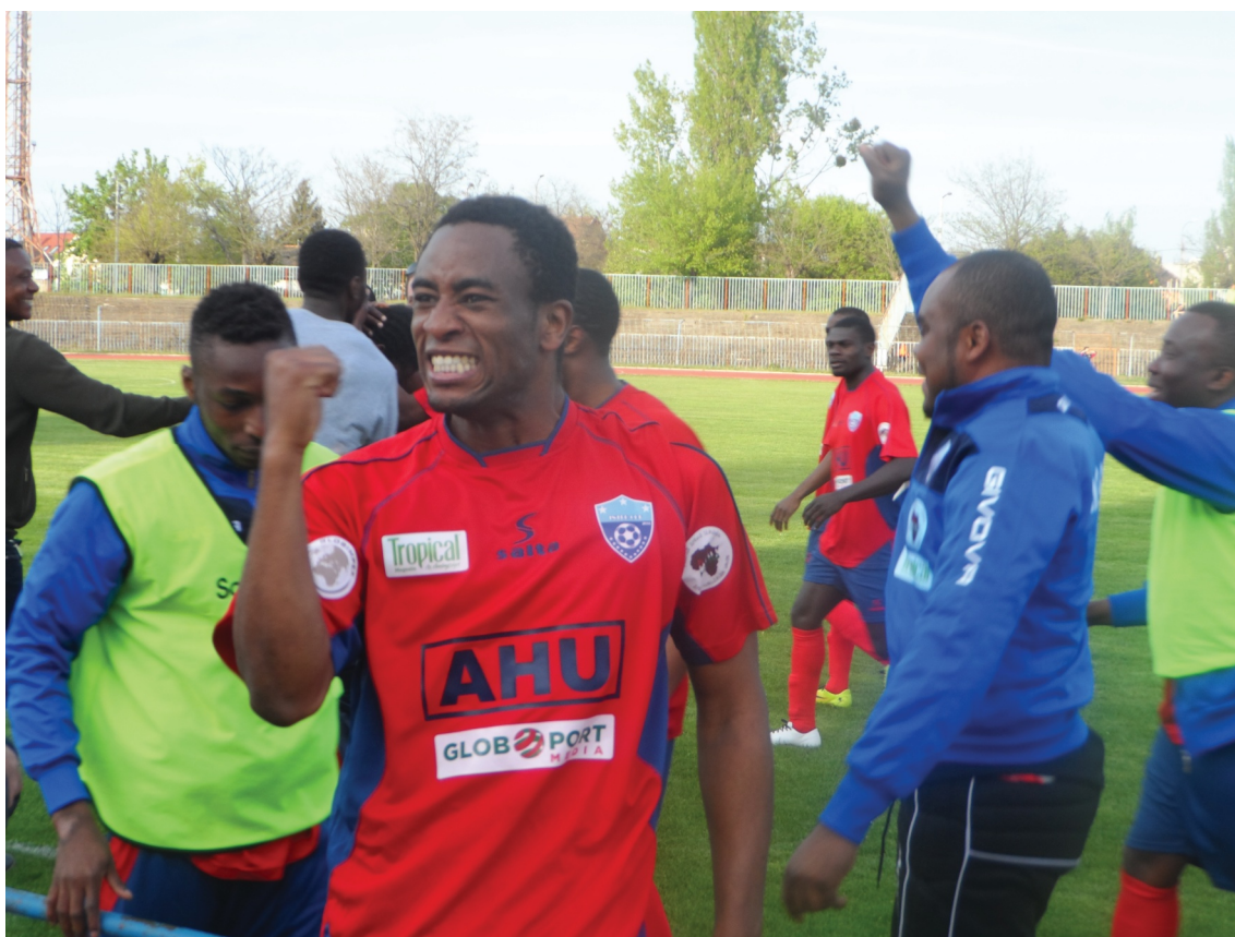
112 gól után ünnepelhetett az Inter

Nem telt el sok idő a bajnokságból, mire már hangosan is meg lehetett állapítani, hogy a 2014/15-ös BLSZII-es sorozat legnagyobb esélyese az Internationale CDF SE.