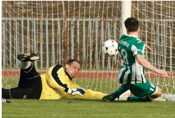
A Szakolczai-gólokra nem számíthatott, de az NB III-ben is jól menetelt a Pénzügyőr

Az elmúlt két évben két olyan csapat jutott fel a BLSZ I-ből az NB III-ba, amely gyorsan bizonyítani tudta, hogy helye van a magasabb osztályban. A 2014/15-ös harmadosztályú bajnokság nyugati csoportjában az akkor újonc III. Kerületi TVE harmincnégy pontot szerezve a 10. helyen zárt, a kiesés réme egy fordulóig sem fenyegette. 2015-ben a Pénzügyőr SE került fel a Budapesti I. osztályból, a zöld-fehérek pedig még az óbudaiaknál is jobban szerepelnek az NB III Közép csoportjában, az őszi idény után az előkelő 6. helyen állnak, négy pontra a dobogótól.