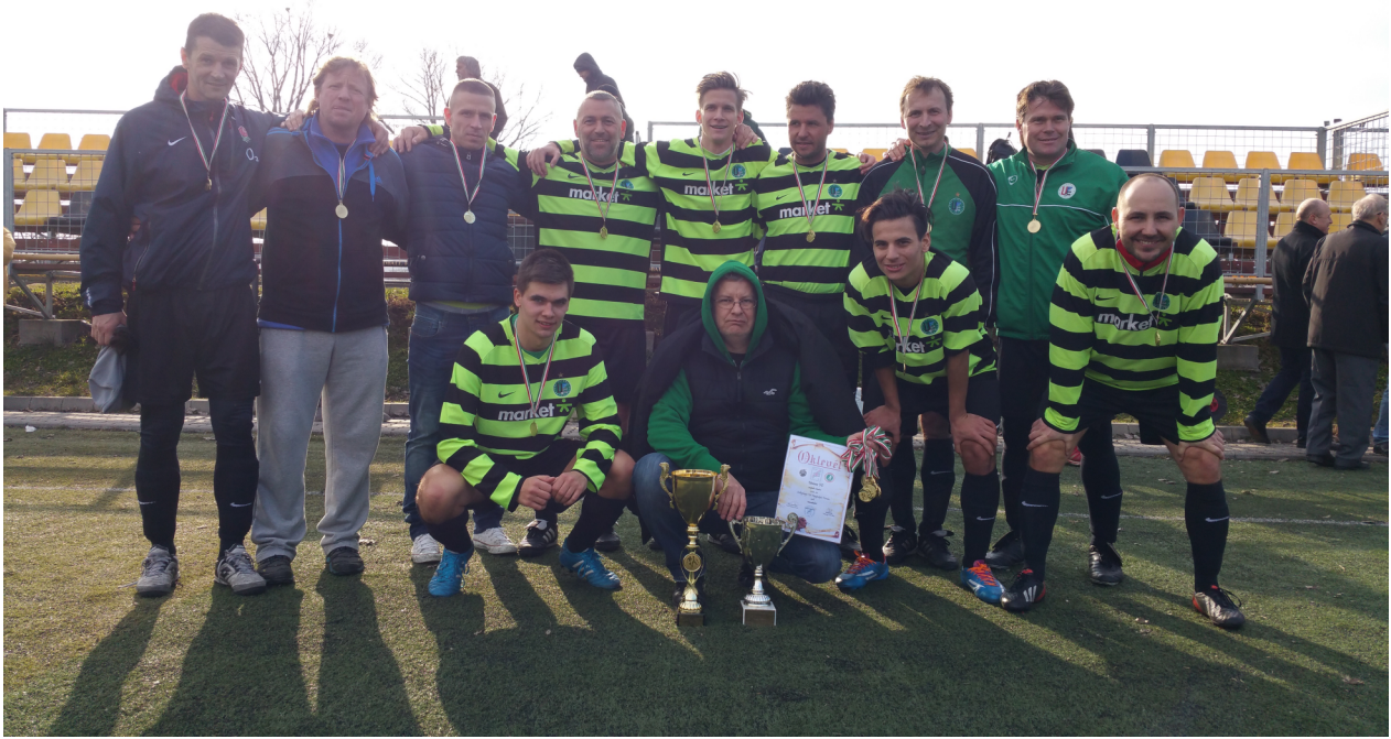
A 2015-ös TNT győztese az Unione FC lett