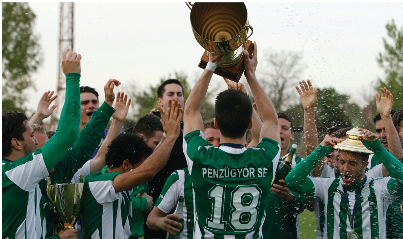
Nagy volt az öröm a döntő után!

A szervezők csak reménykedtek abban, hogy a BLSZ különböző bajnoki osztályaiban szereplő csapatok részére kiírt Budapest Kupa sikeres lesz. Akik ebben bíztak, nem csalódtak, mert az 1977-es Budapest Kupa döntőt újabbak követték, és 2015 áprilisában már a 39. BK győztes csapatot avatták.