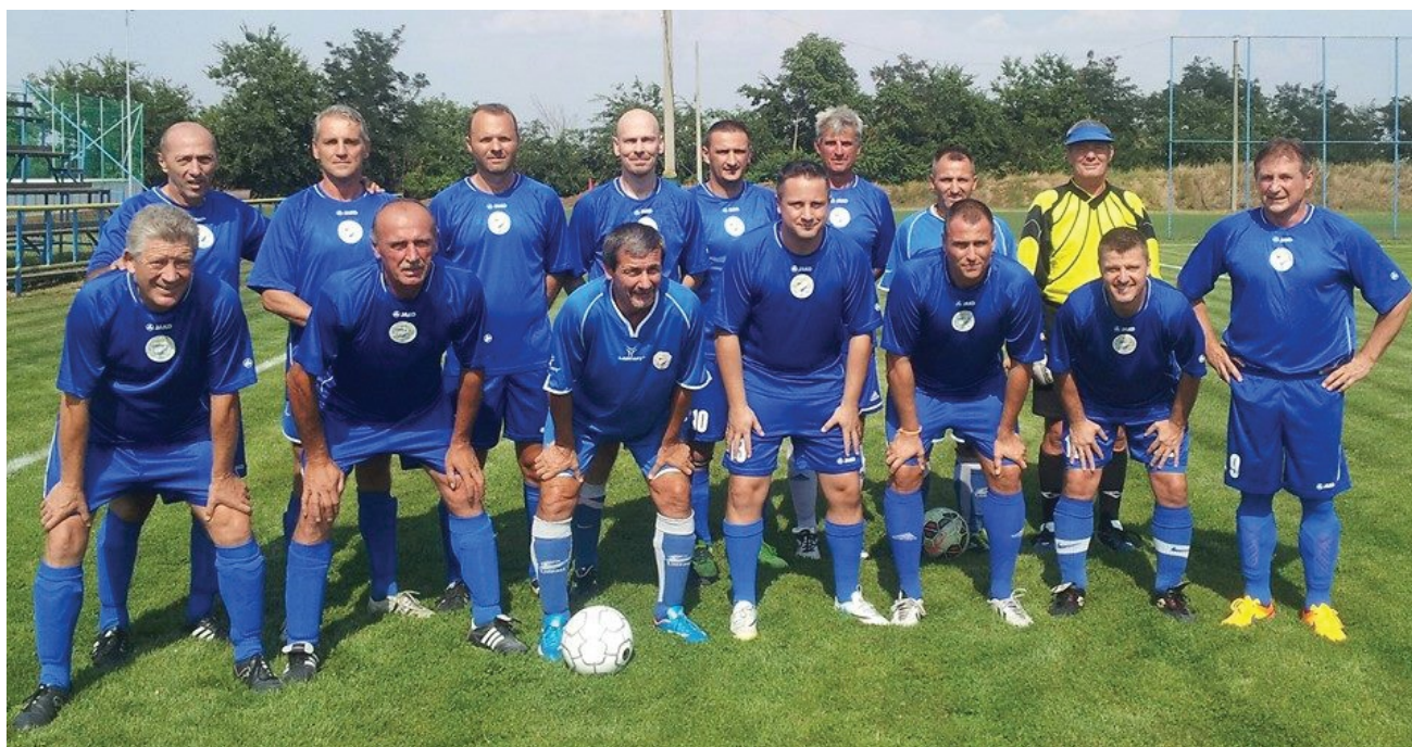
Mindenhol jó az MTK! A képen a kék-fehérek Öregfiúk és Old Boys vegyescsapata

A budapesti Old Boys I. osztályban 12 csapat szerepelt a 2014/2015-ös bajnoki idényben.