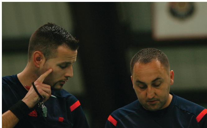
Fegyelem és figyelem minden pillanatban

-Változtattunk a kereteken, előtérbe kerültek a fiatalok, de kell a rutinos játékvezető, és nem mondtunk le a harminc év feletiekről sem, azokról, akik igyekeznek felnőni a feladathoz. Az elmúlt év tapasztalata az igazolja, hogy az idő-