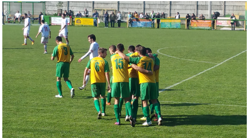
Az Ikarus ellen is fordítani tudott a Gázgyár

-A BLSZ I. osztályban meglepetésre a két újonc ott van az élen. Az Inter CDF