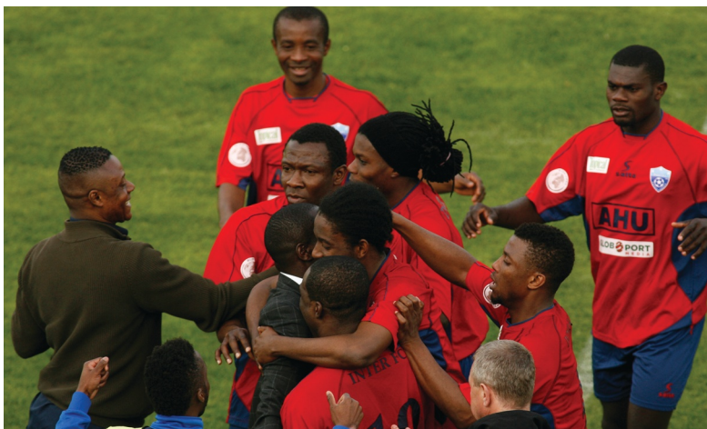
Gólöröm az Inter vezető gólja után