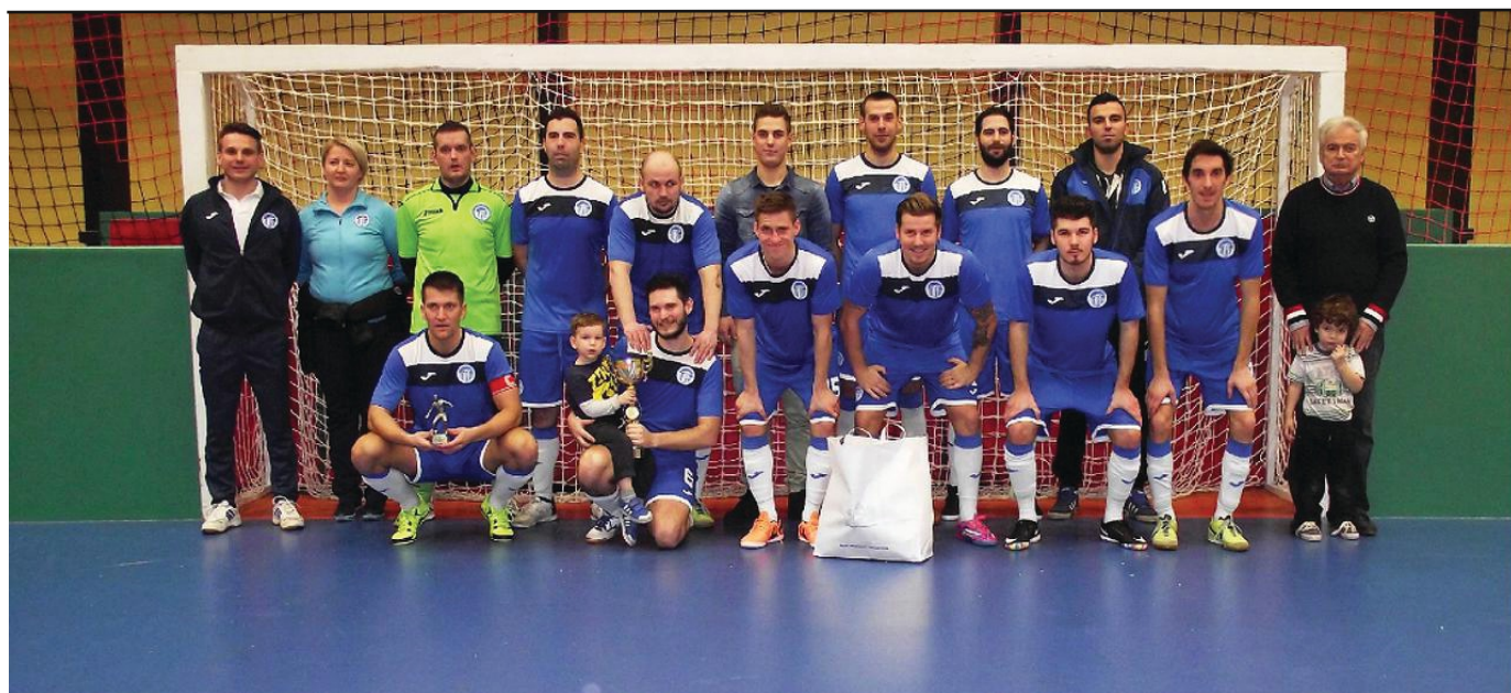
A 43.sz. Építők SK csapata lett a 11. BLSZ Téli felnőtt teremtorna győztese!