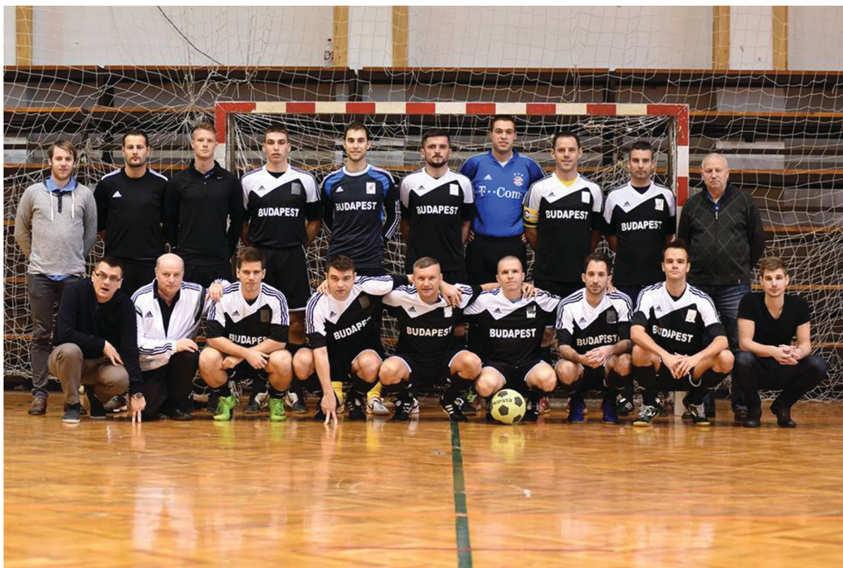
Mi az, hogy nem tudnak futballozni? Budapest legyőzhetetlen volt!

Az ezúttal Kaposváron, 11. alkalommal megrendezett Országos Sípmeister Fesztiválon ismét 19 megye és Budapest válogatottja küzdött meg egymással két napon keresztül. Budapest kisebb meglepetésre a szombati csoportküzdelmek során bejutott a legjobb nyolc közé, és vasárnap ha már ott volt, meg is nyerte a rangos tornát!