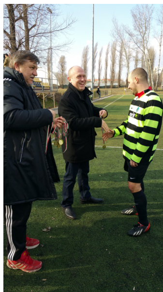
Elsőször indult, első lett az Unione