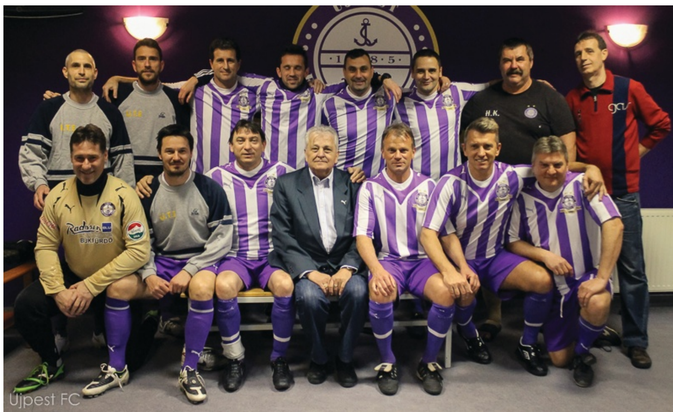
Újpesten remek a hangulat, nem is csoda, újra bajnok lett az Öregfiúk

Magyarországon egészen biztos, hogy az egy főre jutó válogatottságok, és az NB1-es mérkőzések száma az MLSZ Budapesti Igazgatóság alá tartozó budapesti Öregfiúk első osztályban van. Nem is csoda, hogy a legnagyobb rangadókra több százan kíváncsiak.