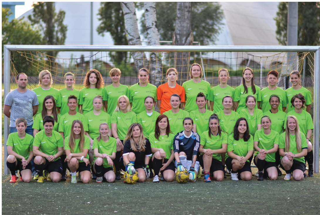
Nem csak szépek, futballozni is tudnak a Metis lányai

Tíz csapat nevezett a 2014/2015-ös BLSZ női bajnokságba, és akárcsak az előző évben, most is kettévált a mezőny az alapszakasz végeztével. A 18 mérkőzés után kialakult öt-öt együttesel a „felső” illetve az „alsó” ház. A két csoport reálisan tükrözte az erőviszonyokat, az öt legerősebb csapat került a felsőházba. Így végig izgalmas volt a bajnokság, mert a rájátszásban már minimális különbség volt a csapatok között.