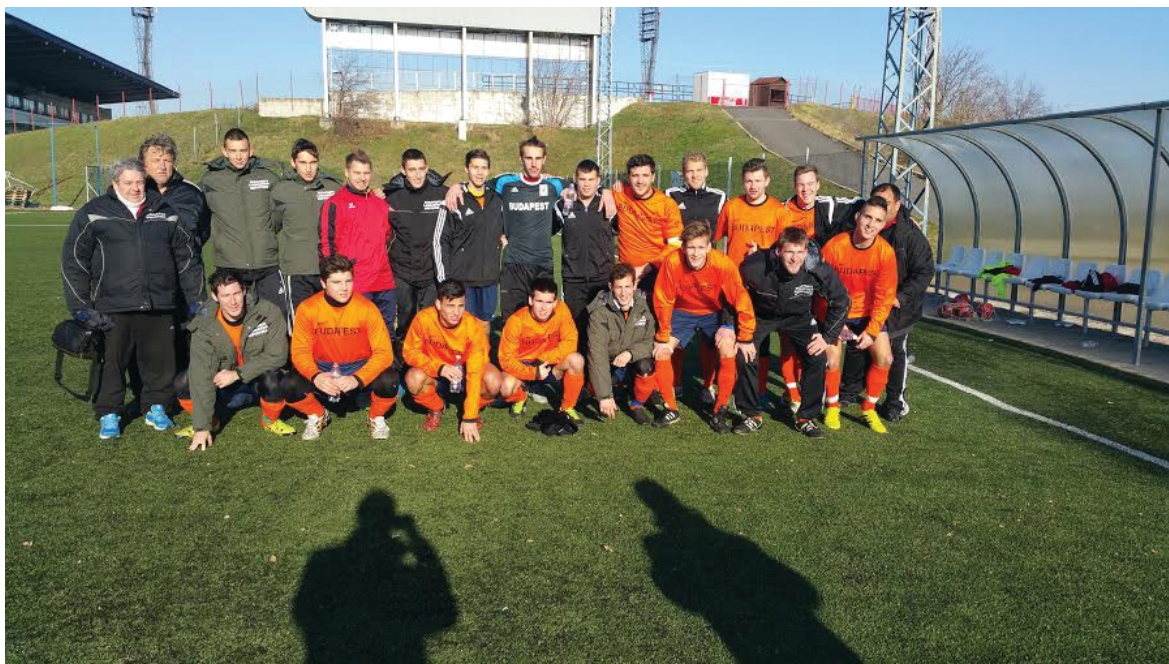
A Budapest válogatott csapata a Somogy megye elleni győzelem után

A Budapest válogatottban való szereplés presztízse évről évre növekszik. Ez 2015-ben sem változott, a BLSZ I-es és BLSZ II-es játékosok nagy örömmel fogadják a meghívót.