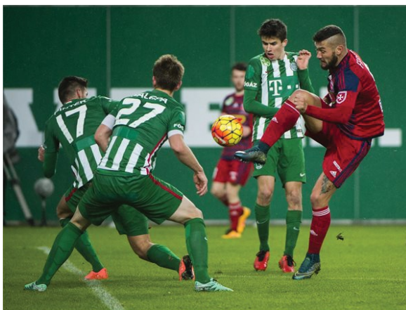
2015-ben a Videoton lett a bajnok, de őszi az FTC átvette a hatalmat

Az I. osztályban nagy átszervezés történt. A bajnoki létszám az NB I-ben 16-ról 12-re csökkent, és a hagyományos két forduló helyett háromszor találkoznak egymással a csapatok. Így őszi már lejátszottak 19 fordulót. A Ferencvárosi TC „utca hosszal” vezet, és a 15. fordulóig veretlen volt. Ekkor az MTK megszakította a remek sorozatot, majd becsúszott még egy vereség, de „földrengésnek” kellene bekövetkeznie ahhoz, hogy ne a Ferencváros legyen a bajnok. Az Újpest nagyszerű hajrájának köszönhetően, hogy a 2. helyen zárta az őszt.