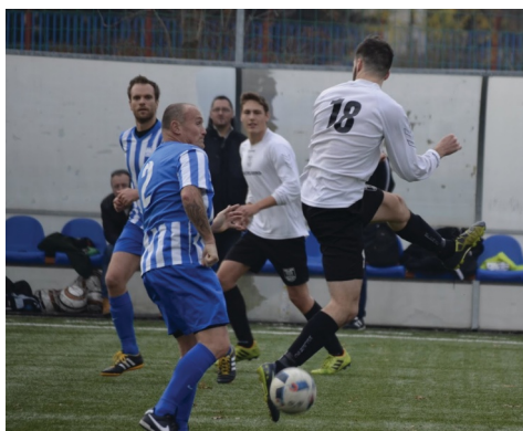
BLSZ II-ben is jól megy a Kelen II-nek