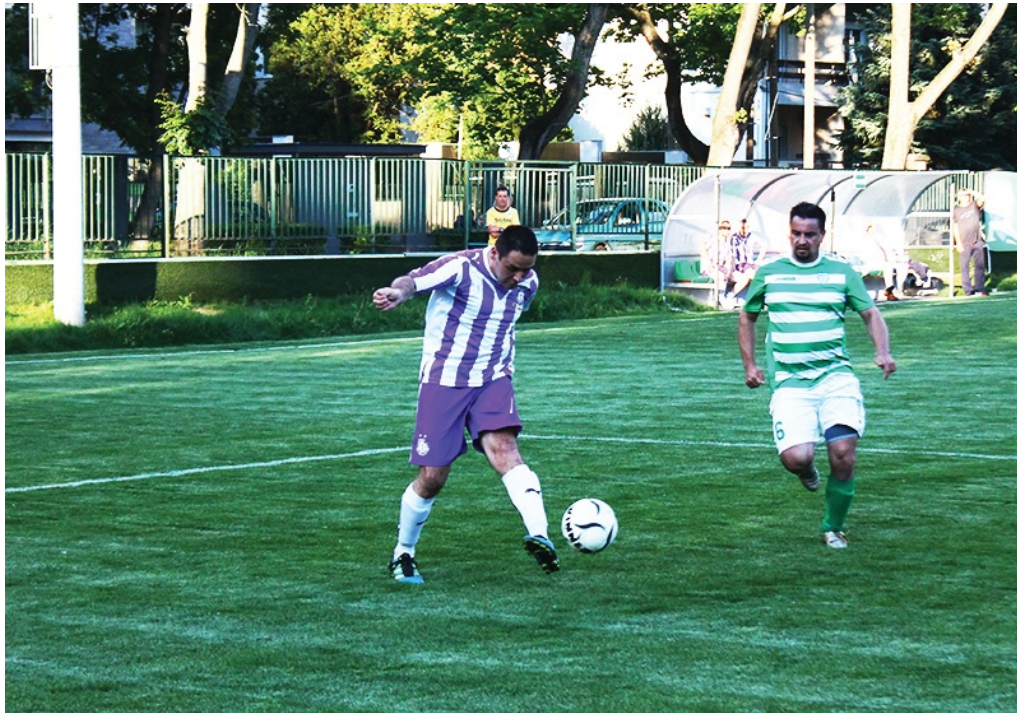
Az Újpest Pasaréten is nyert

A BLSZ szervezésében az idősebb korosztályhoz tartozó egykori aktív labdarúgók három korcsoportban folytatják a rendszeres futballozást. Az Öregfiúk 34 éves kortól játszhatnak, az Old Boys korosztályban 44 év az alsó korhatár, míg a Veteránok mezőnyében azok léphetnek pályára, akik már betöltötték az 54 évet. Visszafelé lehet szerepelni, vagyis egy Veterán korosztályos játszhat az Öregfiúk csapatában, de egy „fiatalabb” korcsoportos nem léphet pályára az „idősebbeknél”, be kell tartani a korhatárokat.