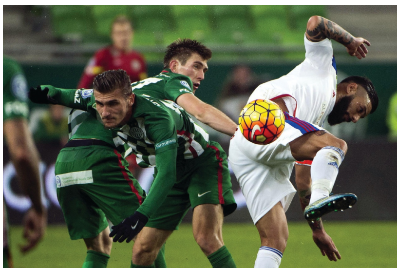
A Vasas nagyot küzdött a Fradival

A 2015/2016-os évadban az NB I-ben öt fővárosi csapat – Ferencvárosi TC, MTK Budapest, Újpest FC, Budapest Honvéd, Vasas FC – szerepelt. Az NB II-ben csak a Soroksár képviselte Budapestet, míg az NB III három csoportjában 12 budapesti gárda lépett pályára. Összeállításunkban áttekintjük a fővárosi NB-s csapatok elmúlt évi szereplését.