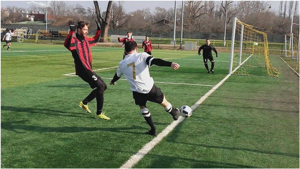
2016-ban az időjárás is kegyes volt a TNT-hez, nem mintha sokat számítana