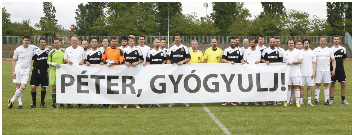
Megható volt a csapatok gesztusa

Remekül! A nézők számára szórakoztató és sokak számára meglepően színvonalas mérkőzést 4-1-re a Művészválogatott nyerte. A találkozó emelte a 40. Budapest Kupa Döntő fényét, és egy nagyon emberi üzenet volt a két és fél hónappal később, 2016. július 14-én elhunyt Esterházy Péter felé.