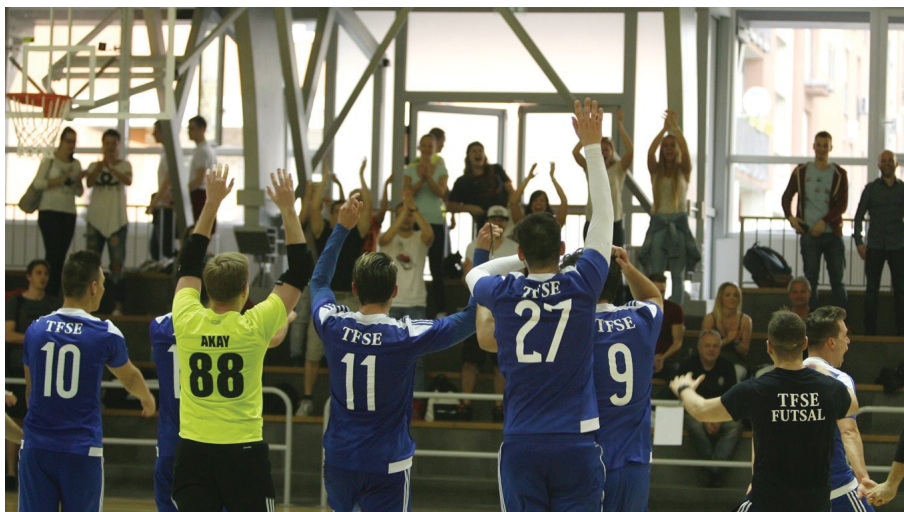
Fantasztikus hangulatú volt a döntő

A 2015. decemberében tizenegy csapat részvételével kezdődő Budapesti Egyetemi Futsal Bajnokság négyes döntőjére 2016. április 6-án, szerdán került sor a XI. kerületi Gabányi László sportcsarnokban. Több online sportoldal úgy rangozta be az eseményt, hogy az „Egyetemi sport ünnepe következik!”. Nem tévedtek, fantasztikus hangulatú volt a döntő, amelynek végén a Testnevelési Egyetem csapata örülhetett a legjobban, a TF SE lett a 2015/2016-os Egyetemi Futsal bajnokság győztese! A testnevelésiek ezzel másodszor nyerték meg a sorozatot.