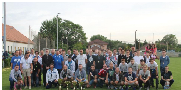
Igazi pestszentimrei év volt