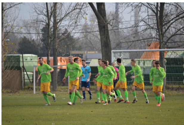
Szoros az élboly, de a BLSZ I. elején a THSE

Csak budapesti amatőr labdarúgás! www.pestifoci.hu