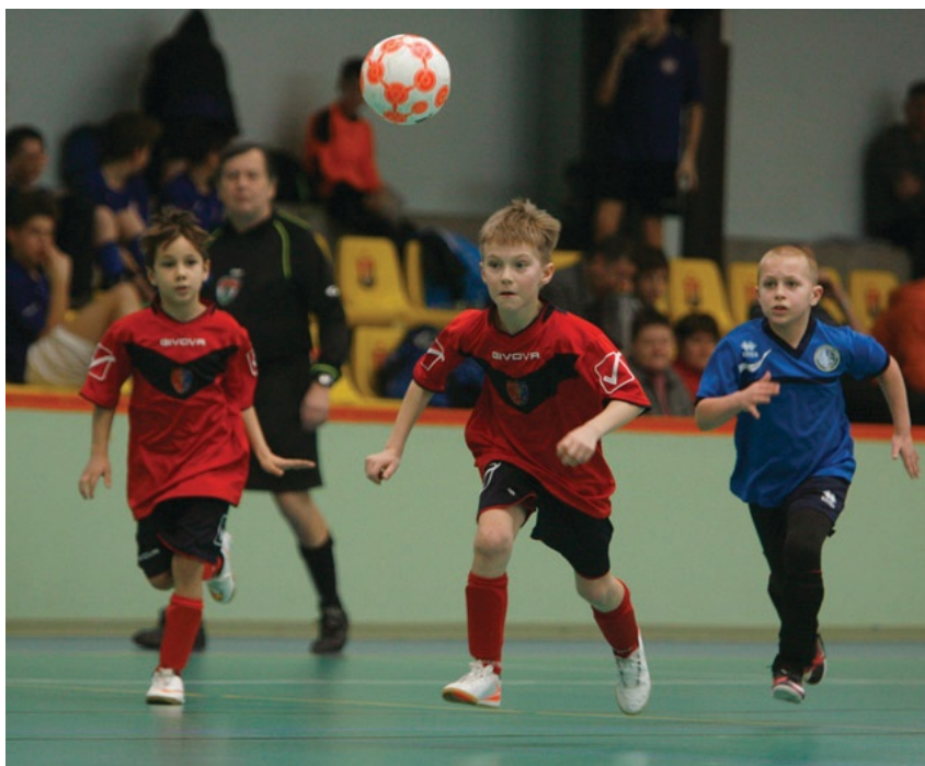
Nagy verseny volt minden korosztályban

Az U10-es korcsoportban is az Ikarus BSE együttese végzett az élen. A XVI. kerületi egyesület csapata megállíthatatlannak bizonyult, mindhárom mérkőzését megnyerte, ráadásul fölényesen. A második a Baráti Bőrlabda FC lett, amely az első mérkőzésén még 4-0-ra legyőzte a CSHC-t, aztán az Ikarustól 5-0-s vereséget szenvedett, majd a Mészöly Focusuli ellen újra győzni tudott. A bronzérmes a Mészöly lett, a CSHC pedig a negyedik helyet szerezte meg.