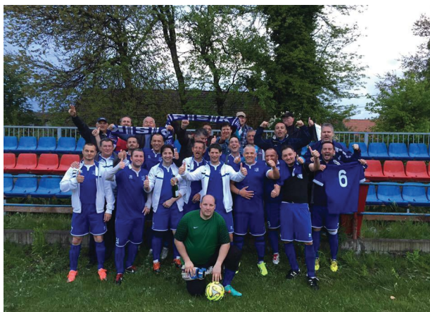
A Pestszentimre öregfiúk bajnokságát is nyert

**** a THSE-Sashalom évi összeredményéből 7 büntető pont levonva