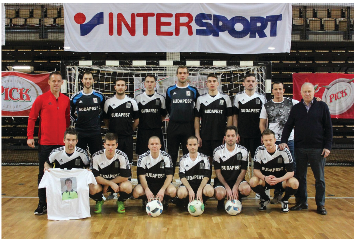
A budapesti játékosok válogatottja