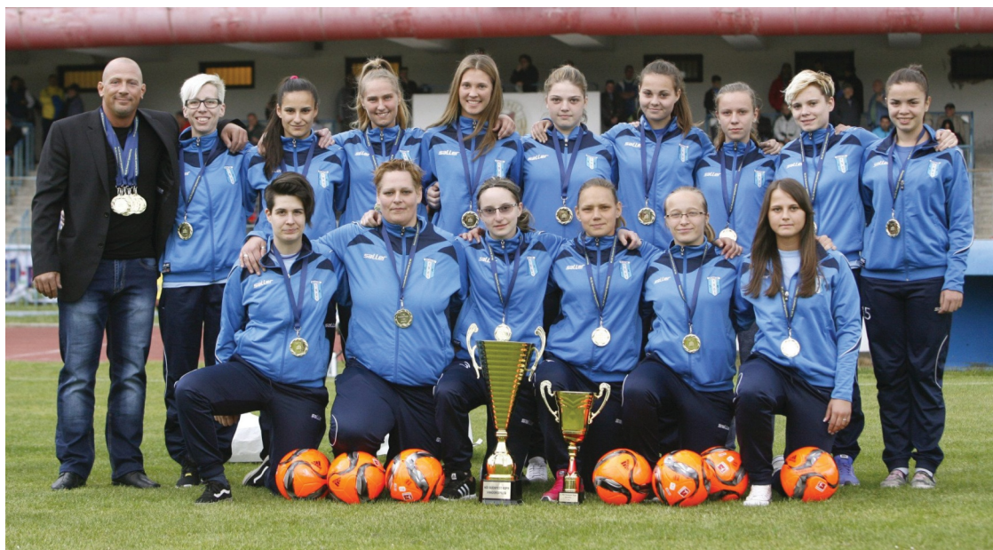
Boldog monori lányok

Az MLSZ Budapesti Igazgatóság 2016-ban első alkalommal írta ki a Női Budapest Kupát.