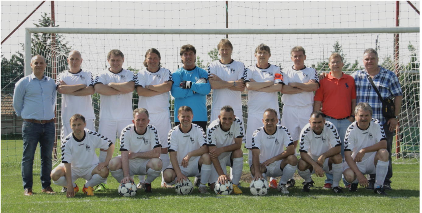
A B.O.SZ. nem teketóriázott, aranyra tört

Megisméltődött, ami az előző bajnoki évben történt az Old Boys I. osztályban. A 2014/2015-ös évadban az újonc 1. FC Skorpió szerezte meg az aranyérmet, a 2015/2016-os idényben szintén egy újonc gárda állhatott fel a dobogó legmagasabb fokára, az aranyérmes a B.O.SZ. FC együttese lett. A bajnok az előző évben a második helyen végzett a II. osztályban, de a győztes nem vállalta az I. osztályt, így elfogadta a felkérést a B.O.SZ. FC. Kiderült, hogy nem volt magas a lécz számukra, már az őszi idényben az élen zártak a 11 csapatos mezőnyben.