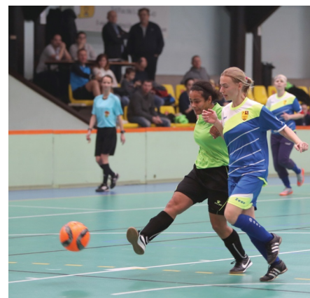
A Metisnél jó helyen volt a labda