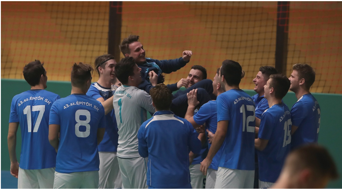
A 43.sz. Építők SK csapata lett a 12. BLSZ Téli felnőtt teremtorna győztese!