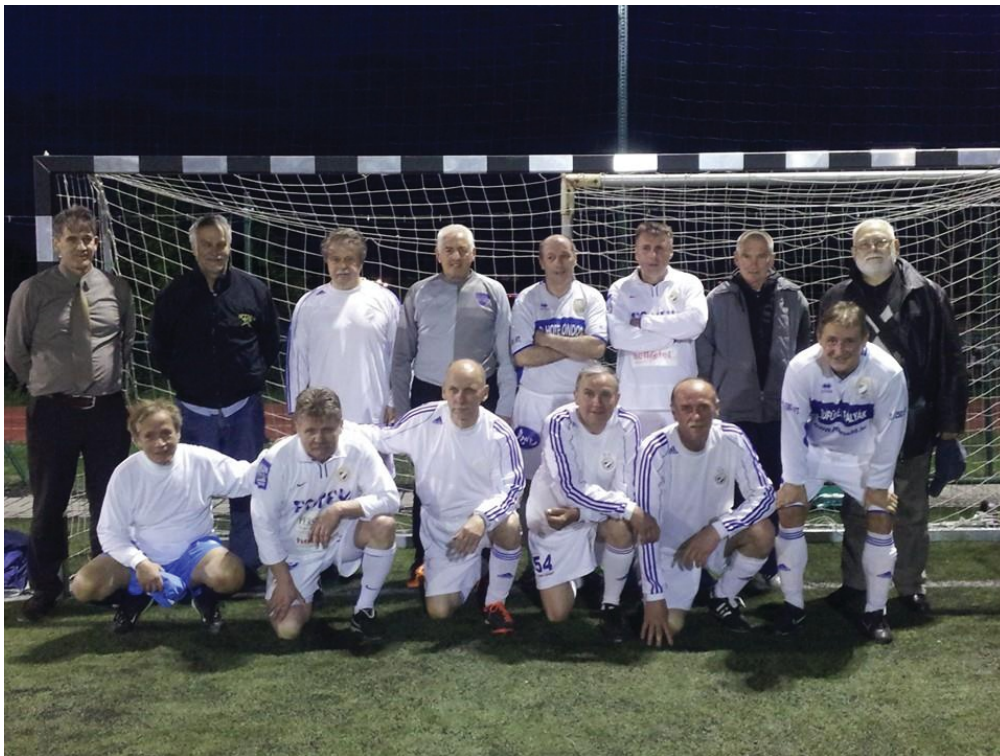
Az MTK uralta a veterán korosztályt

Számos egykori labdarúgó szívesen játszott volna még, de sokuk számára az Old Boys bajnokságban való szereplés túlságosan nagy feladat elé állította volna őket. Ezért döntött úgy a BLSZ Versenybizottsága, hogy kiírja a Veterán bajnokságot, ahol az 54. évüket betöltöttek léphettek pályára. A mérkőzéseket félpályán játsszák, 1 kapussal és 8 mezőnyjátékosal ötször kétméteres kapukra. A Veterán bajnokság a 2012/2013-as idénnyel indult.