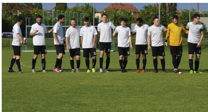
A Kelennél mindenki beállt a sorba

Csak budapesti amatőr labdarúgás! www.pestifoci.hu