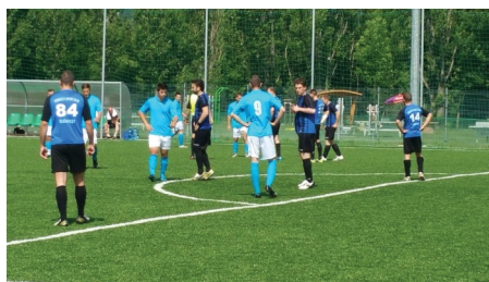
A TF egyre feljebb kezd közepet