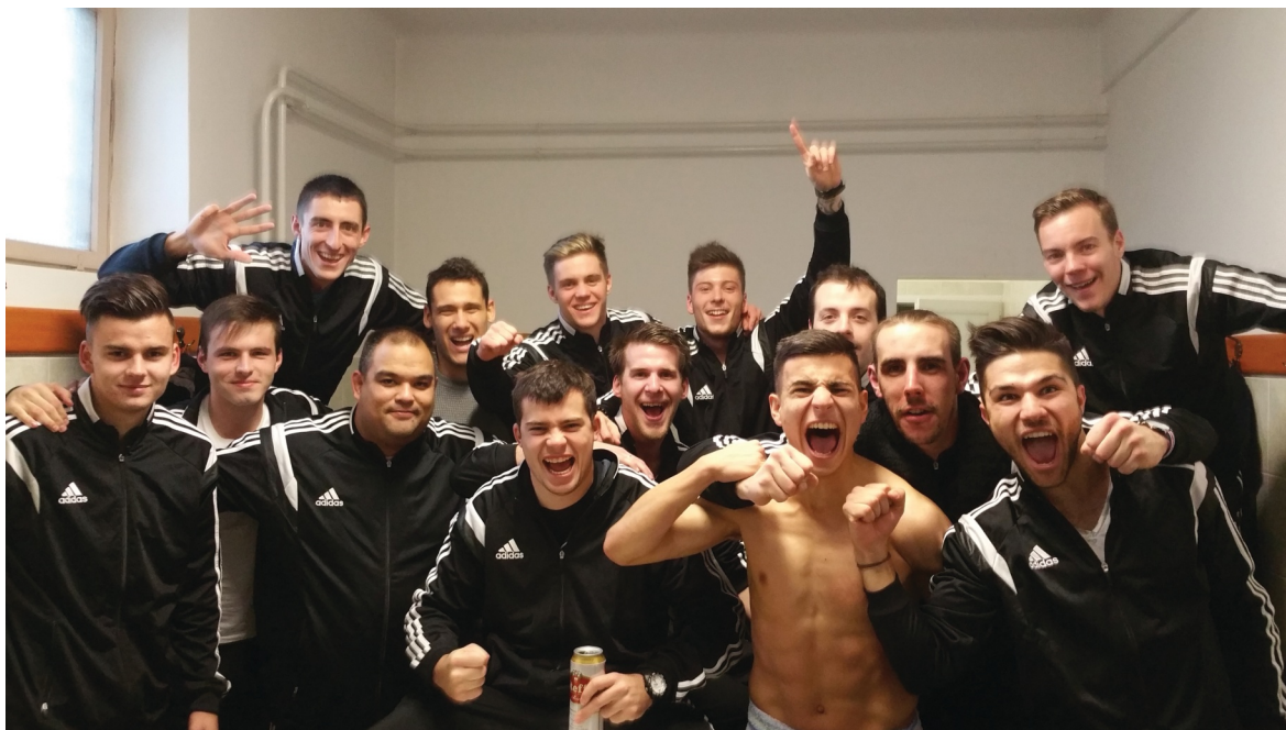
Jöttünk, láttunk, győztünk

Annak ellenére, hogy 2016 végén ezúttal nem került megrendezésre a Megyei Válogatottak tornája, a Budapest Válogatott számos edzőmérkőzést játszott, az évet pedig egy különleges találkozóra zárta.