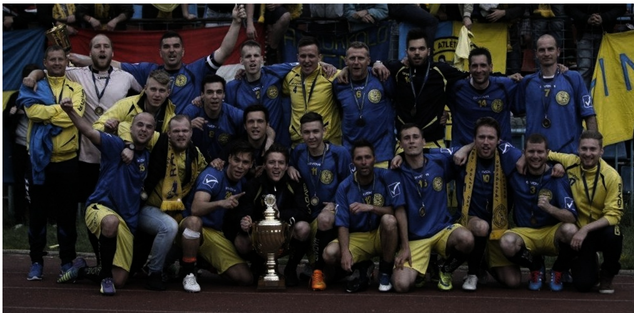
A rekordgyőztes RAFC nagy ünneplést rendezett

A 40. Budapest Kupa döntőjébe két XVI. kerületi rivális veredte be magát.