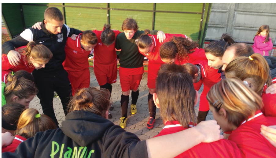
Budapest erős a női mezőnyben is

A BLSZ bajnokság legjobb női labdarúgói is egy barátságos mérkőzéssel zárták az évet. Az MLSZ Budapesti Igazgatóság szervezésében Budapest női válogatottja Komárom-Esztergom megye labdarúgóit fogadta.