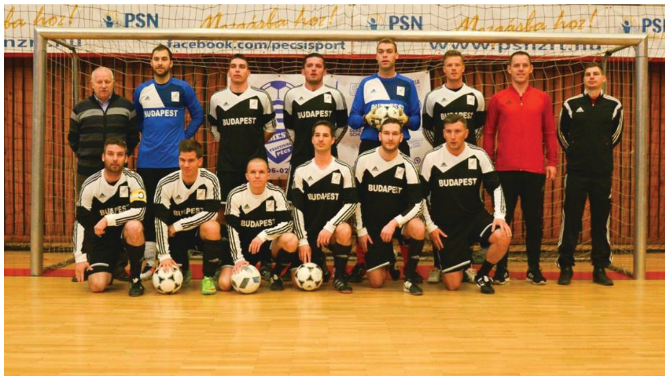
A budapesti játékosok válogatottja

2018. január 6-7-én Pécsen rendezték meg a 13. Sípmeister Fesztivált, amelyen az ország amatőr labdarúgó-játékosai labdarúgásban mérték össze ismét erejüket. Pécsen belül két helyszínen, a Lauber Dezső Sportszarnokban és a Gandhi Gimnázium tornacsarnokában zajlottak a mérkőzések.