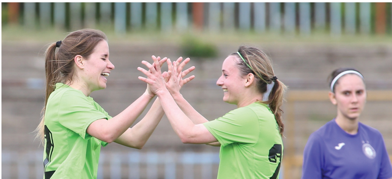
Kalász Kittiék boldogan ünnepelték a Metis első Budapest Kupa sikerét

Az MLSZ Budapesti Igazgatóság a 41. Budapest Kupa döntő előtt rendezte meg a II. Női Budapest Kupa döntőt, melyet az Újpest FC és a Metis csapata játszott.