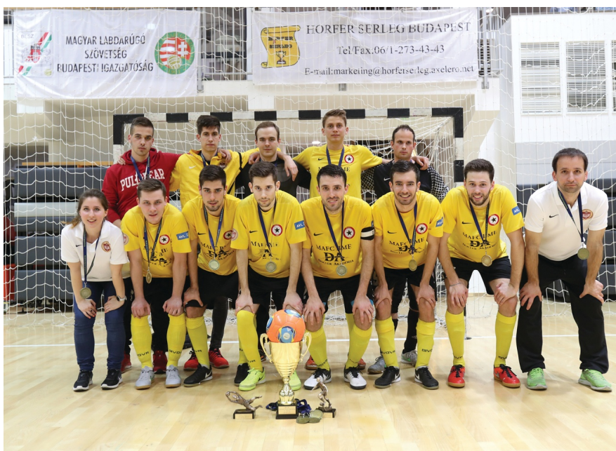
A BME csapata másodszor lett a legjobb

Az MLSZ Budapesti Igazgatóság negyedszer rendezte meg a Budapesti Egyetemi Futsal bajnokságot, melyre ezúttal tizenegyen neveztek! A bajnokság négyes döntőjére 2017. április 5-én a Gabányi László Sportsarnokban került sor.