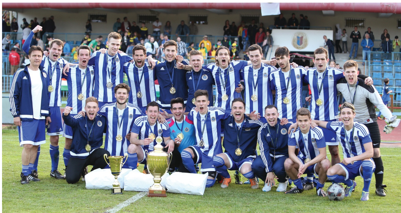
Nem a TF volt a legesélyesebb, de mégis révbe ért a Budapest Kupában

Az MLSZ Budapesti Igazgatóság szervezésében a Csepel Stadionban megrendezett 41. Budapest Kupa döntőjében a BLSZ I. tavalyi bajnoka, az ASR Gázgyár és a BLSZ II akkori listavezetője, a TFSE csapata találkozott. A mérkőzés előtt a II. Női Budapest Kupa döntőre került sor, ahol a Metis az Újpest ellen 2-0-s győzelmet aratott. A nézőket ezután cheerleader bemutatóval szórakoztatták, amely megadta az alaphangulatot a több mint 500 kilátogató számára.