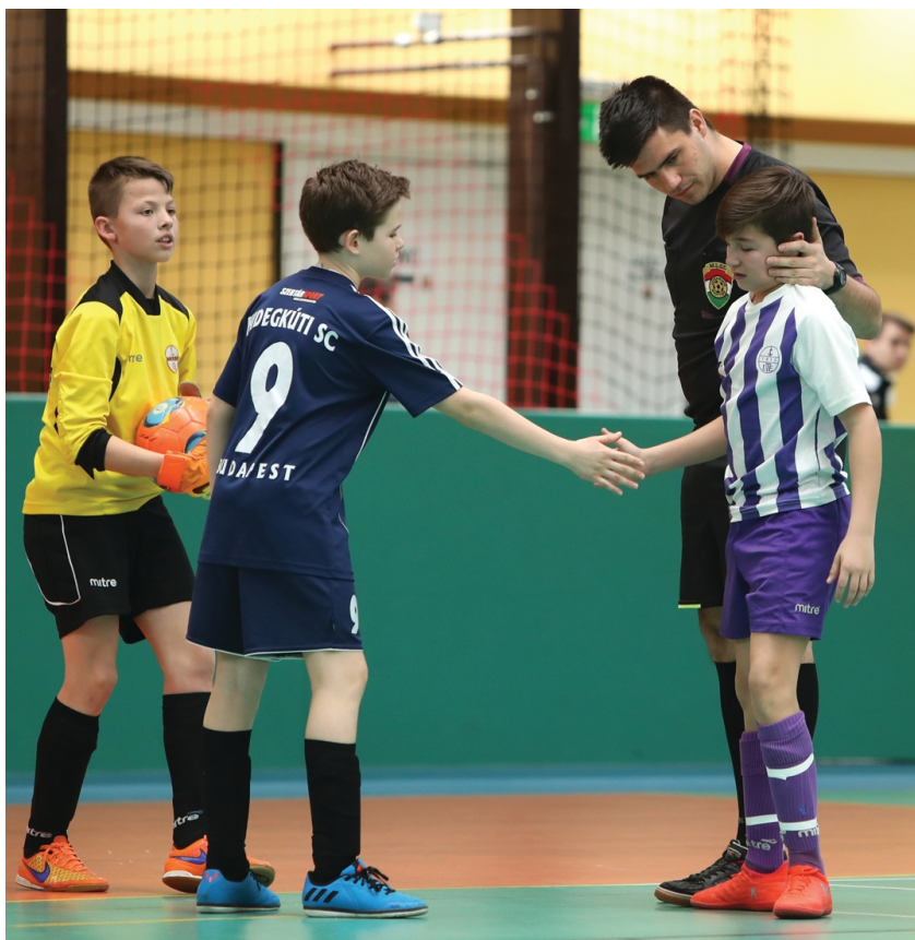
A Futsal-bajnokságok döntői hozták a várt színvonalat