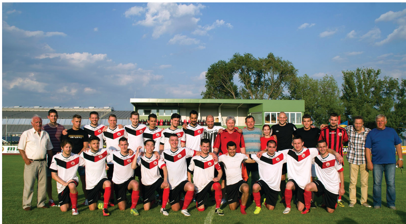
A BMTE II bajnokként tért vissza BLSZ1-be

A Budapest másodosztályban egészen sokáig, a 26. fordulóig még négy csapatnak volt esélye a bajnoki címre, a Budafoki MTE II, a TF SE, a Szent Pál Akadémia nagy versenyben volt egymással.