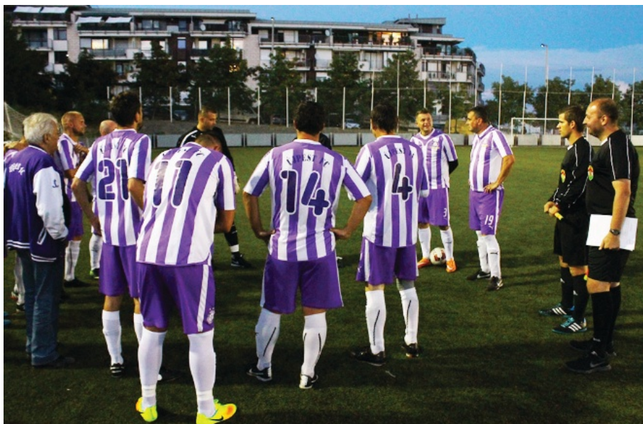
Meglepetésre ősszel csak 5. lett az Újpest