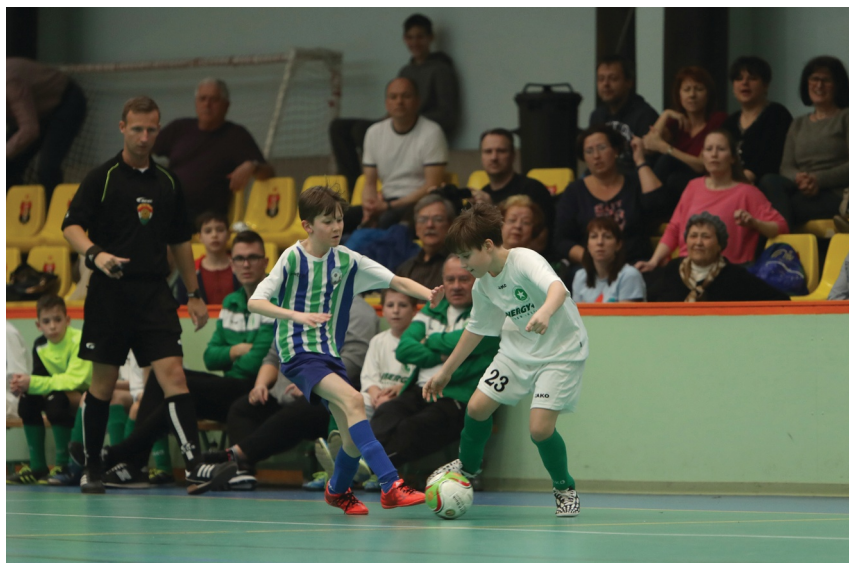
Az izgalmakra nem lehetett panasz

Az ASI DSE és az Airnergy találkozója következett, az angyalföldieket, hangos szülői szurkolótáborra 4-0-s sikerbe haj-