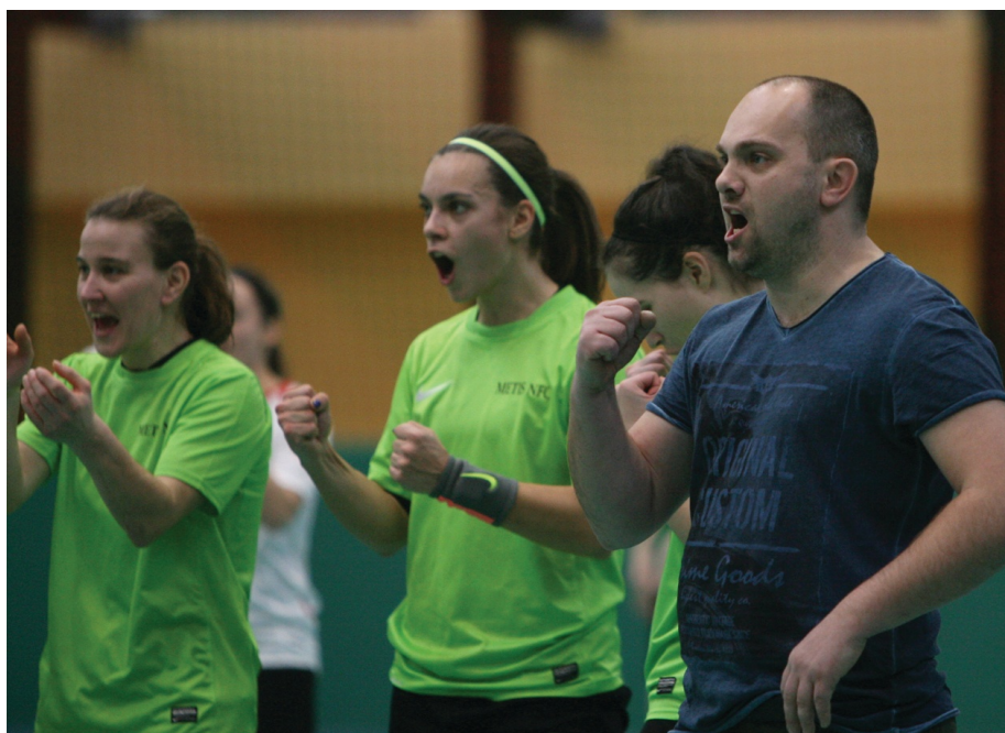
A Metis ismét vitte az aranyat és a bronzérmet is