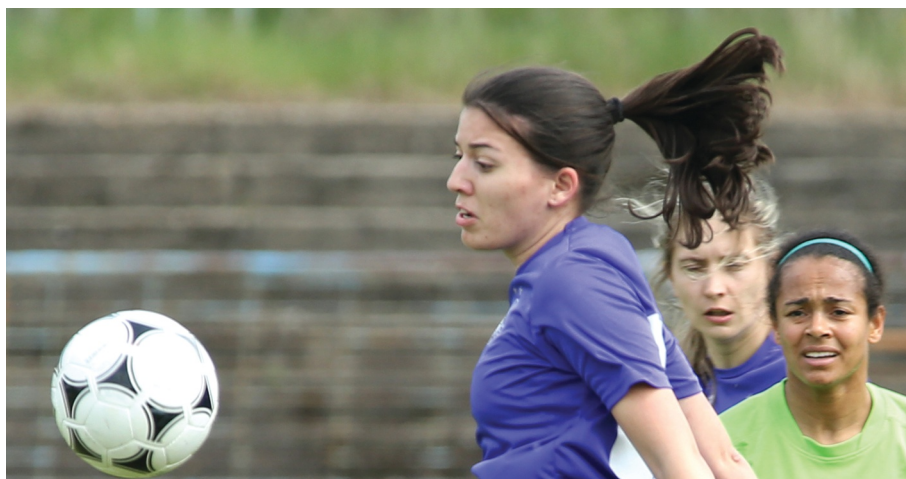
A lányoknak is a labdán a szemük