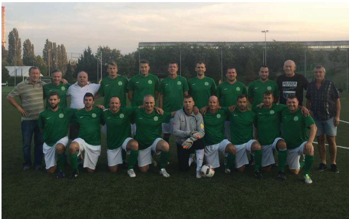
A Ferencváros megállíthatatlan volt

Az idősebb korosztályhoz tartozó egykori aktív labdarúgók három korcsoportban futbalozhatnak tovább. A BLSZ szervezésében évek óta zajlik a bajnokság az Öregfiúk bajnoksága ahol 34 éves kortól léphetnek pályára a csapatok játékosai, az Old Boys korosztályban 44 év az alsó korhatár, míg a Veteránok mezőnyében azok játszhatnak, akik már betöltötték az 54 évet. Visszafelé lehet szerepelni, vagyis egy Veterán korcsoportos nemcsak az Old Boys bajnokságban, hanem az Öregfiúknál is játszhat. Egy fiatalabb korcsoportos viszont nem léphet pályára az idősebbeknél.