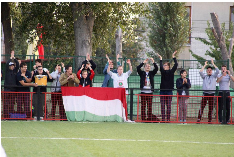
A MUN SE szurkolói kiemelkedők voltak

Csak budapesti amatőr labdarúgás! www.pestifoci.hu