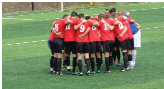
Végig nagyon együtt volt a CSHC

Nagyon rosszul kezdtük a bajnokságot, de az ősz felénél, azt kezdtem érezni, hogy úgy összeállt a játékkunk, hogy mi már nem fogunk kikapni. Tényleg így lett, immáron 22 meccse vagyunk veretlenek!