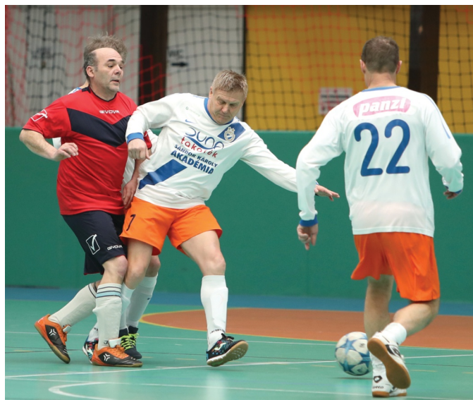
Az MTK teremben is jól muzsikált

Az MLSZ Budapesti Igazgatóság először rendezte meg mindhárom korosztályban az Öregfiúk teremturnát, az esemény utáni pozitív visszajelzések után egyértelművé vált, hogy a következő évben is meglesz tartva majd ez a remek esemény.