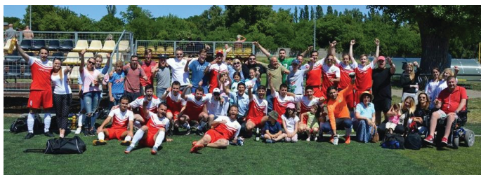
MUN egy nagy család!

A bajnokság elején nem gondoltuk volna, hogy mi leszünk a bajnokok, eredetileg az 5-10. helyre predesztináltuk magunkat. A játékban a védekezésre, és a kiegyensúlyozottságra építettünk. Ez hozta el a sikert! Még most sem hiszünk el, hogy bajnokok lettünk. Hihetetlen ez számunkra. Egy álom vált valóra, nagyon boldogok vagyunk! Nem csapatban, hanem közösségben gondolkodunk, és ez a siker a közösség sikere volt."