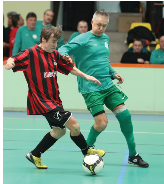
Az Öregfiúk maximális komolysággal vették a Téli Teremtornát