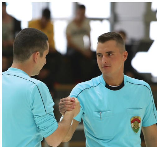
A mérkőzés a játékvezetőknek is fontos