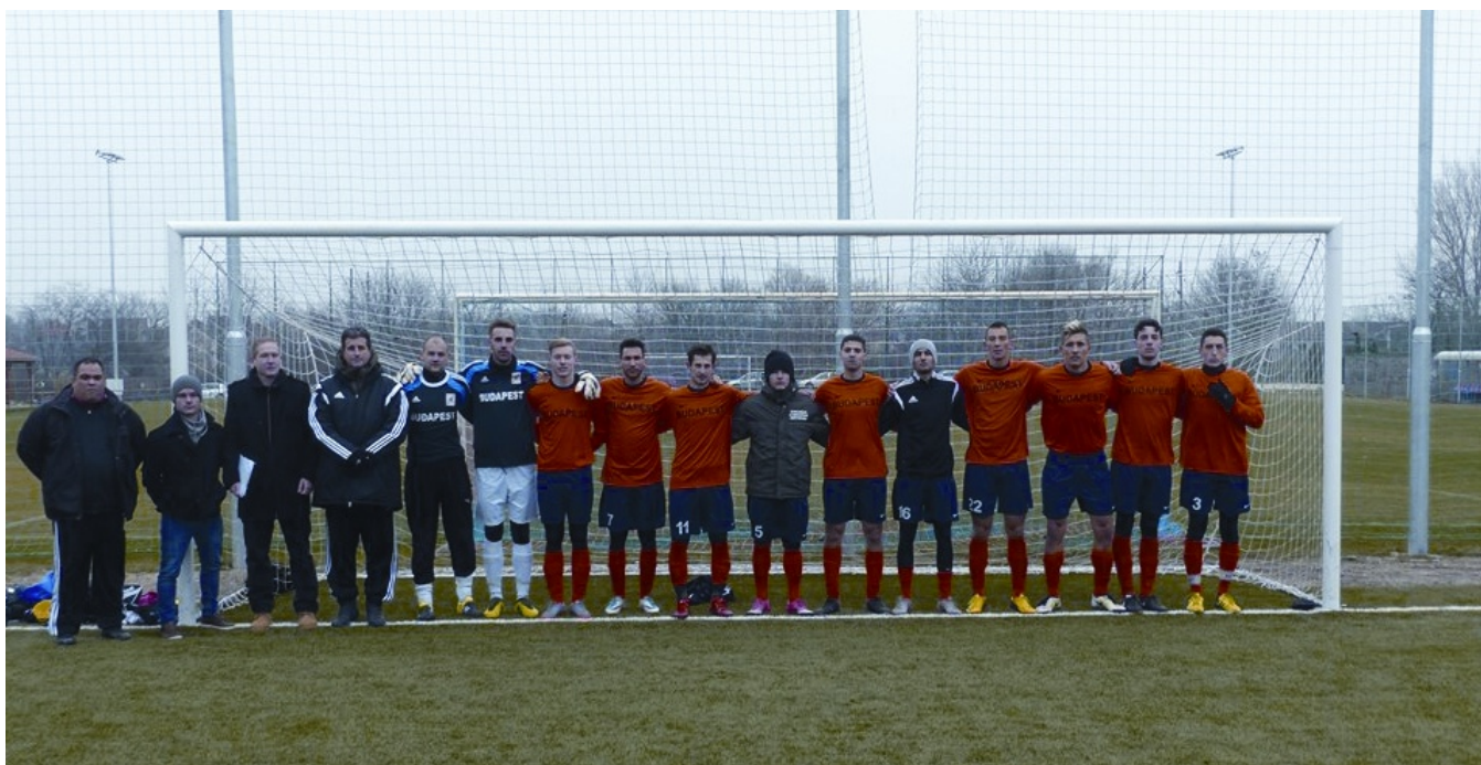
A Budapest válogatott egységes csapatként játszott

2017 december 2-án és 3-án Székesfehérváron szerepelt a Budapest Válogatott a Megyei Válogatottak Országos Nagypályás Tornáján. A budapesti csapat a 4. csoportba került, ahol Somogy megye, Tolna megye, Fejér megye és Baranya megye volt az ellenfele.