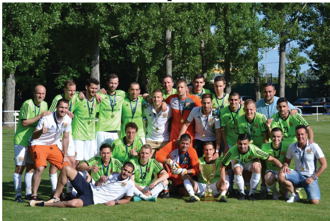
Elköltözött és azonnal bajnok lett a THSE-Szabadkikötő

Hosszú évekig a XVI. kerületi Pirosrózsa utca volt a THSE otthona, 2016 nyarán viszont egy jelentős változás jött az egyesület életében, összebútoroztak az akkor nehéz helyzetben lévő Szabadkikötővel és Csepelre költöztek! Ugyanakkor kényszerűségből meghatározó emberek távoztak a csapatból, és a felkészülésük sem ideális körülmények között zajlott. Az eredmények viszont ennek ellenére jöttek, és a téli szünetben a 2. helyen fordulhatott a THSE-Szabadkikötő csapata, egy pontra lemaradva az őszi első RAFC-tól.