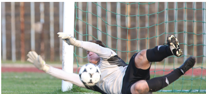
Régen látott küzdelem volt minden pályán