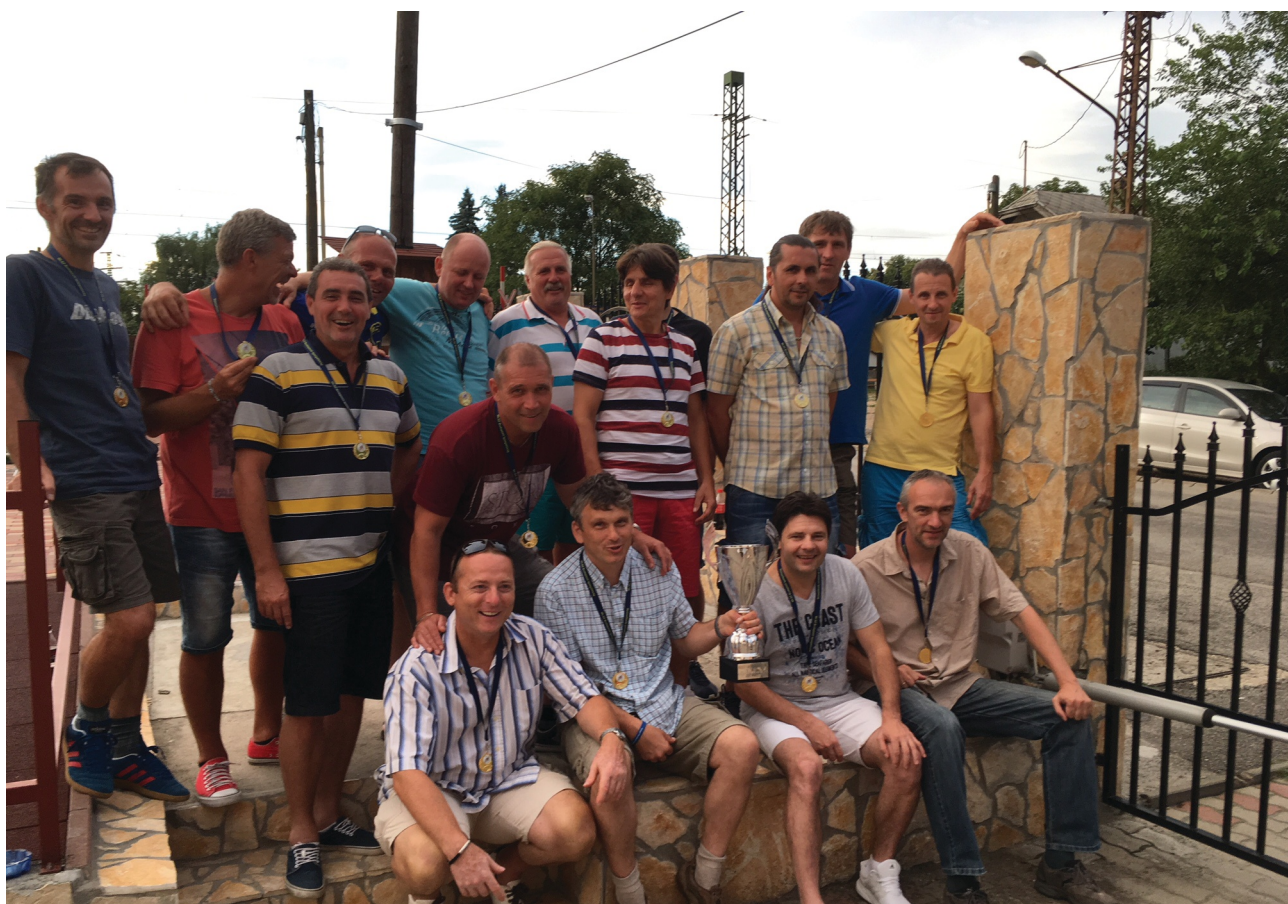
2017 a Skorpió éve volt

Az 1 FC Skorpió együttese 2015-ben újoncként nyert bajnokságot az Old Boys I. osztályban. 2016-ban ismét egy újonc végzett az élen, a B. O. SZ. FC diadalmaskodott, a Skorpió csapatának meg kellett elégednie a második hellyel. A 2016/2017-es idényben külön versenyt vívott egymással a Skorpió és a Budafoki LC. Végül egy pont előnnyel a Skorpió lett a befutó, és két év után ismét az övék lett az arany. A címvédő B. O. SZ. FC csak negyedik lett. Figyelemre méltó az újonc MTK szereplése, a kék-fehérek a dobogó harmadik fokán végeztek. A II. osztályban az I. osztályhoz hasonlóan 12 csapat indult, és az első helyet a Pénzügyőr szerezte meg az RTK és az ESMTK előtt. A Pénzügyőr egy vereséget szenvedett még az őszi idényben, a III. Ker. TVE büszkélkedhet azzal, hogy nyert a bajnok ellen. A Pénzügyőr tavasszal veretlen maradt, és a bajnoki cím elnyerésében az is döntő volt, hogy a rivális RTK elleni mindkét összecsapást megnyerte.