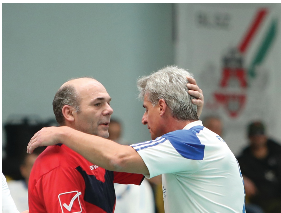
Az Öregfiúk-bajnokságokban az ellenfelek is barátok