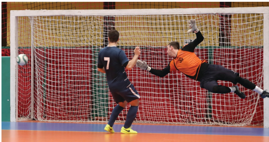
Izgalmas tornát nyert meg a Testvériség