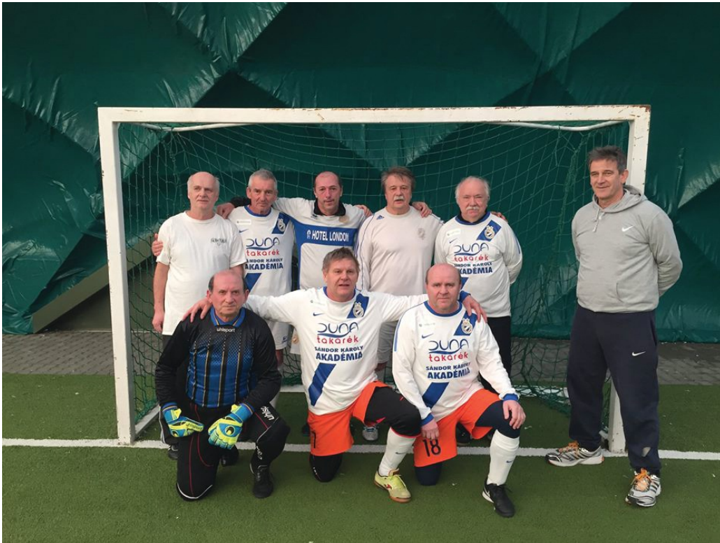
Az MTK újra bajnok lett a veterán korosztályban

A legidősebb korosztály csapatai – 54 évüket betöltötték léphetnek pályára – mérkőzéseiket felpályán játsszák 1 kapussal és 8 mezőnyjátékoskal ötször kétméteres kapukra. Ebben a korosztályban a 2012/2013-as bajnoki évtől küzdenek a pontokért.