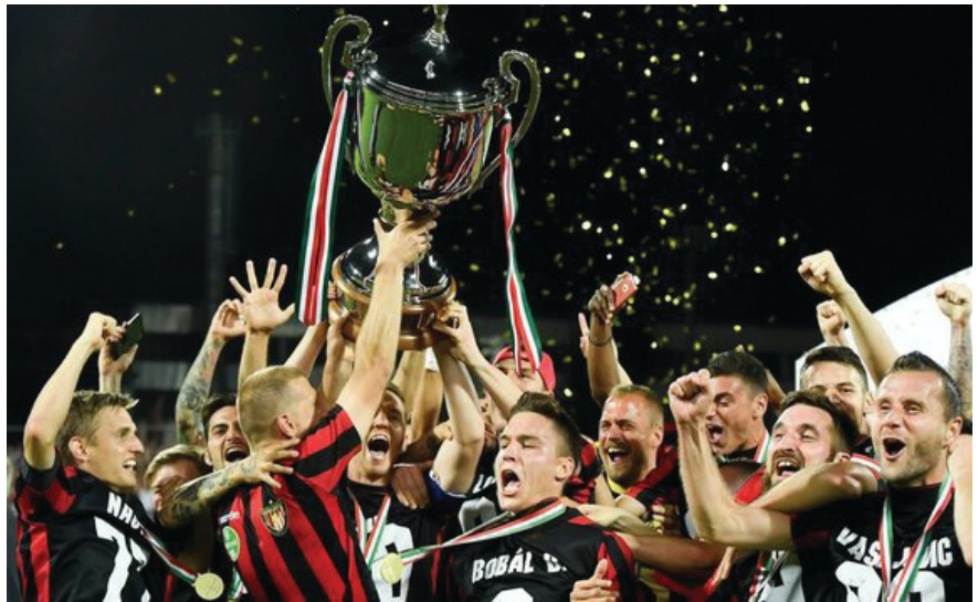
24 év után lett bajnok a Honvéd

A 2016/2017-es évadban a z NB I-ben 5, az NB II-ben 1, az NB III három csoportjában 12 budapesti csapat indult. A 2017/2018-as bajnoki évben a fővárosi csapatok száma az NB I-ben 4, az NB II-ben 3, és az NB III-ban 9.