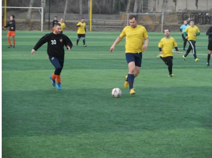
Nagy volt a verseny minden bajnokságban