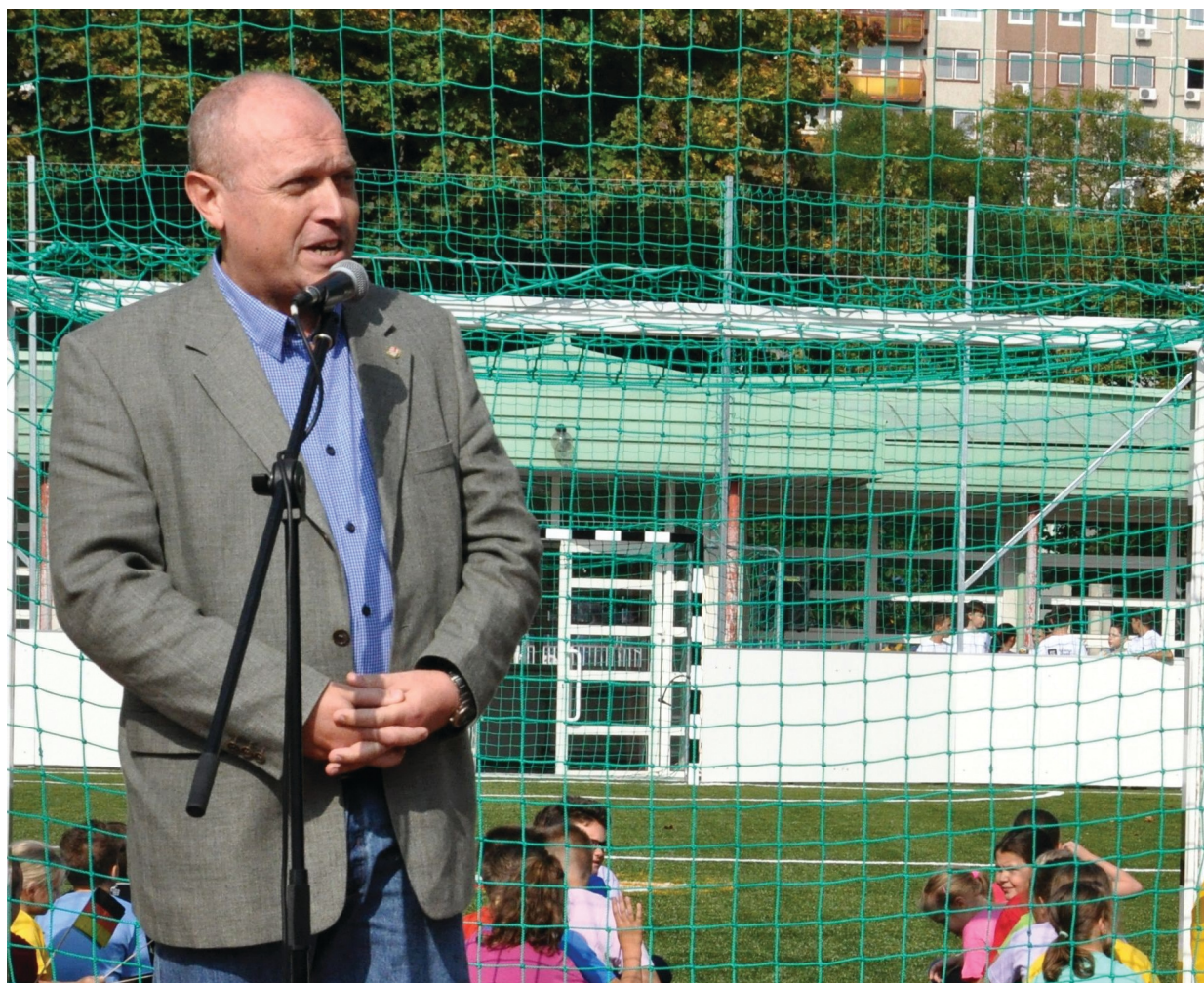
Lovász Tamás István az újpesti műfüves pálya átadásán