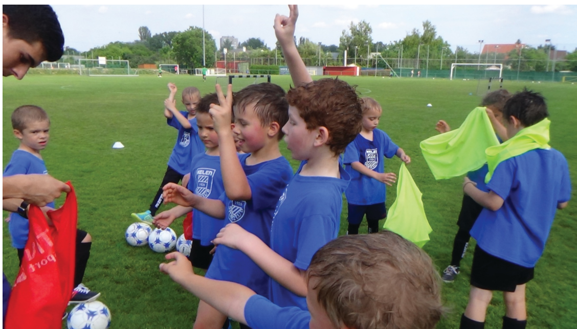
A gyerekeknek is élmény a Grassroots C tanfolyam

A 2017-es évben egy amatőr C-licences tanfolyam mellett kettő Grassroots C tanfolyam volt Budapesten. Az amatőr C képzés célja, hogy naprakész ismeretanyaghoz juttassa az alsóbb osztályú csapatoknál dolgozó edzőket, megismertesse őket az amatőr labdarúgás céljaival és feladataival, a játék eszközeivel, közösség építésének feladataival. A tanfolyam során a hallgatók elsajátíthatják az amatőr felnőtt játékosok sportolásával kapcsolatos szervezési, edzéselméleti, egészség biztosítási, módszertani és sportági ismereteket.