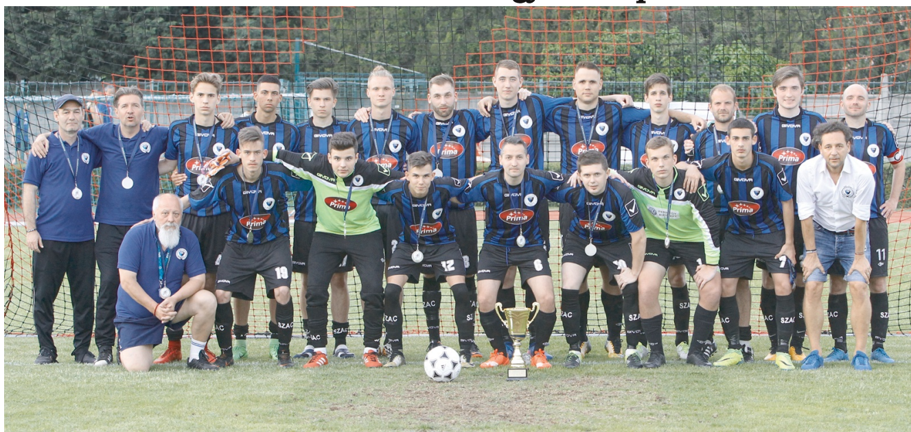
A SZAC az utolsó félórán nyerte meg a bajnokságot

Rég nem látott versenyfutás volt a BLSZ II. bajnoki címéért és az onnan való feljutásért. Három nagyon különböző együttes versenyzett az első két feljutó helyért, végül a bajnok a SZAC lett, a nevető második a Csep-Gól, a szomorú harmadik pedig a BVSC.