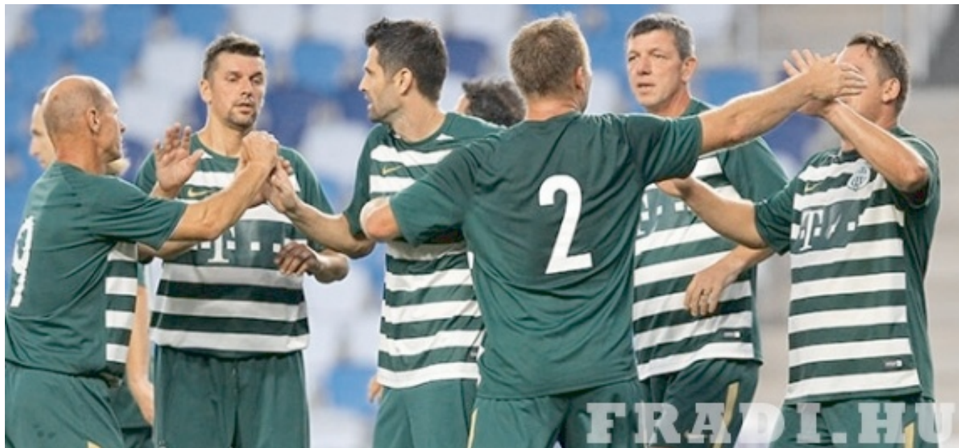
A Ferencváros megállíthatatlan volt

Az idősebb korosztályhoz tartozó egykori aktív labdarúgók három korcsoportban futballozhatnak tovább. A BLSZ szervezésében évek óta zajlik a bajnokság az Öregfiúk bajnoksága ahol 34 éves kortól léphetnek pályára a csapatok játékosai, az Old Boys korosztályban 44 év az alsó korhatár, míg a Veteránok mezőnyében azok játszhatnak, akik már betöltötték az 54 évet. Visszafelé lehet szerepelni, vagyis egy Veterán korcsoportos nemcsak az Old Boys bajnokságban, hanem az Öregfiúknál is játszhat. Egy fiatalabb korcsoportos viszont nem léphet pályára az idősebbeknél.