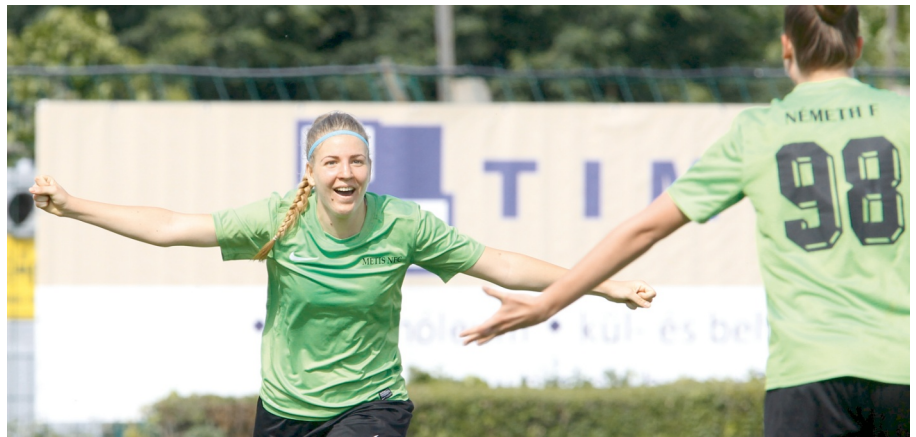
A női bajnokság 2018-ban is izgalmas volt