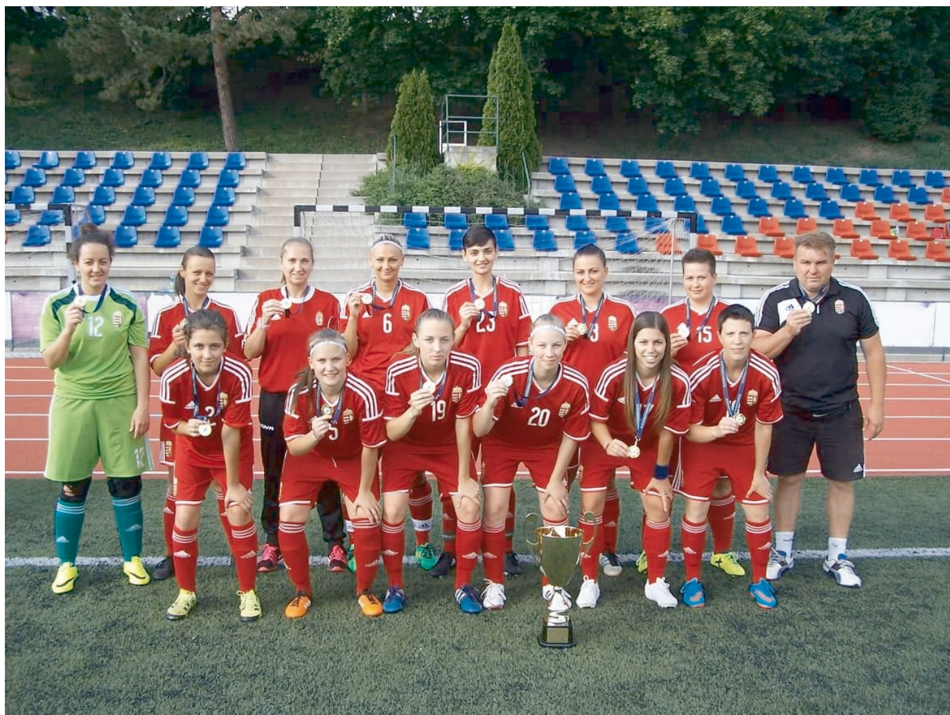
A Szolnok nagyon meggyőző volt

A BLSZ női bajnokságba 9 csapat nevezett a 2017/2018-as szezonra, de végül csak 8 indult el. Elfogadták a Szolnok Fanatic nevezését, amely egy adminisztrációs félreértés miatt nem indulhatott az NB II-ben. A szolnokiak a BLSZ-be kérték a besorolásukat, és ez meghallgatásra talált. A vendégek „visszaéltek” ezzel, mert nagy fölényrel nyerték a bajnokságot. A korábbi évek sikercsapata a Metis NFC most is kiemelkedett a fővárosi egyesületek közül, de ez most a 2. helyre volt elegendő. Az előző bajnoki évben 2. helyezést Újpest gyengébben teljesített, be kellett érnie az 5. helyre. A Kormányőr fellépett a dobogóra, és javított pozícióján a Kelen is. A Kerepes is gyengébben teljesített, míg a Vasas és a BVSC-Zugló az alsóházban végzett. A nagypályás bajnokság mellett 6 csapattal indult háromnegyed pályás baj-