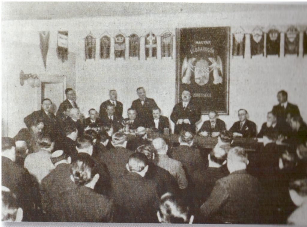
Az 1935.február 16-i tisztújító közgyűlés