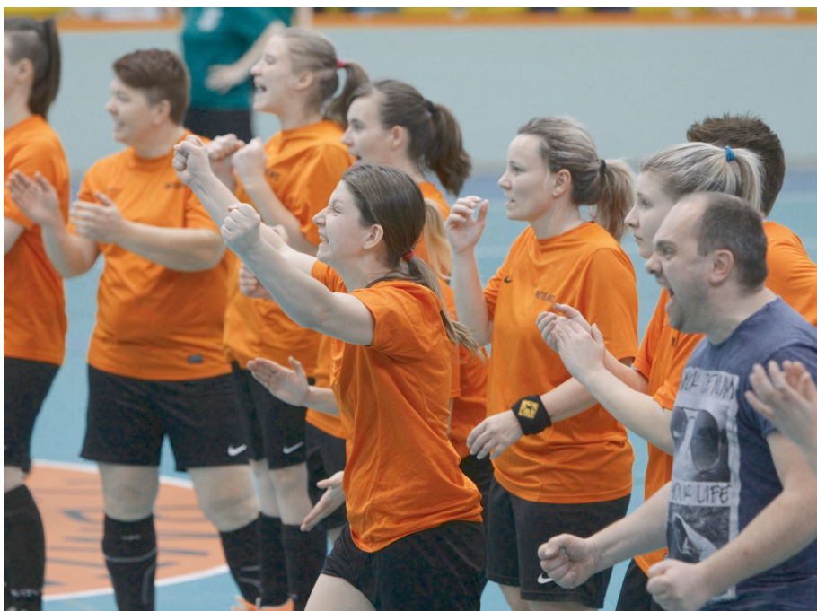
A Metis ismét vitte az aranyat és a bronzérmet is