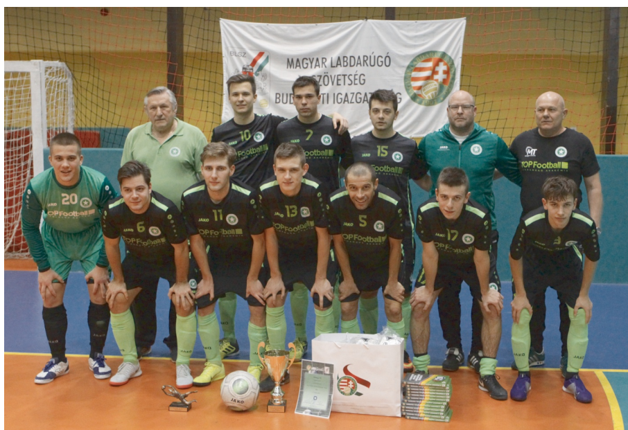
Az Airnergy FC tornagyőztes csapata

A torna érdekessége volt idén, hogy Pestifoci.hu január 5-i közép döntőt és a január 6-i döntőt online tudósította.