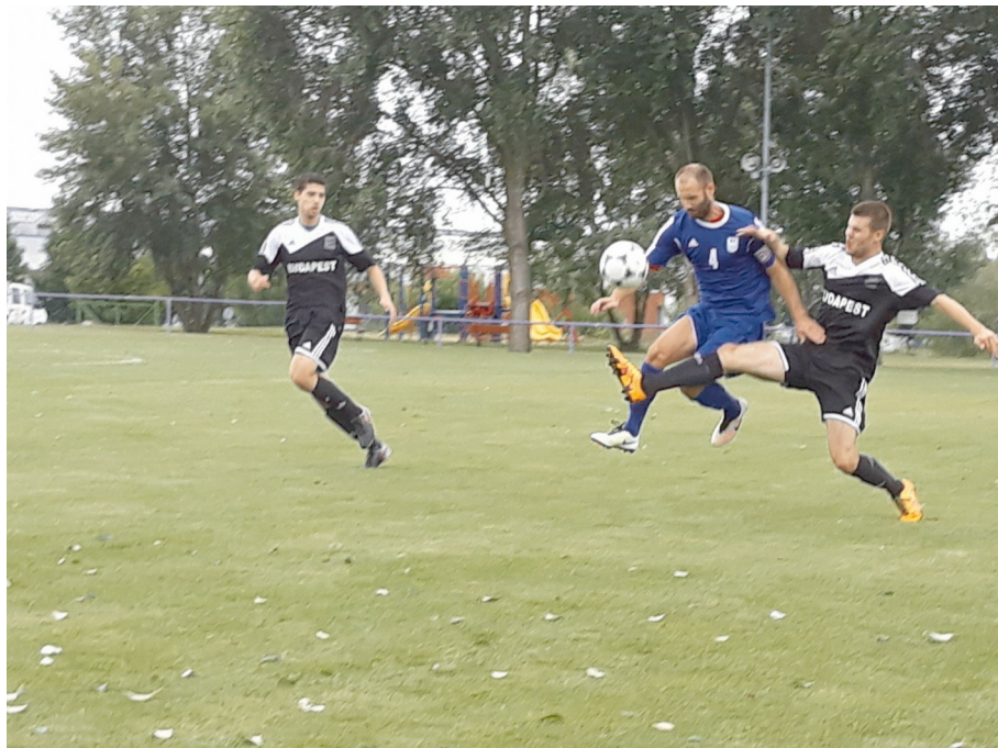
Mindig a végsőkig küzdenek