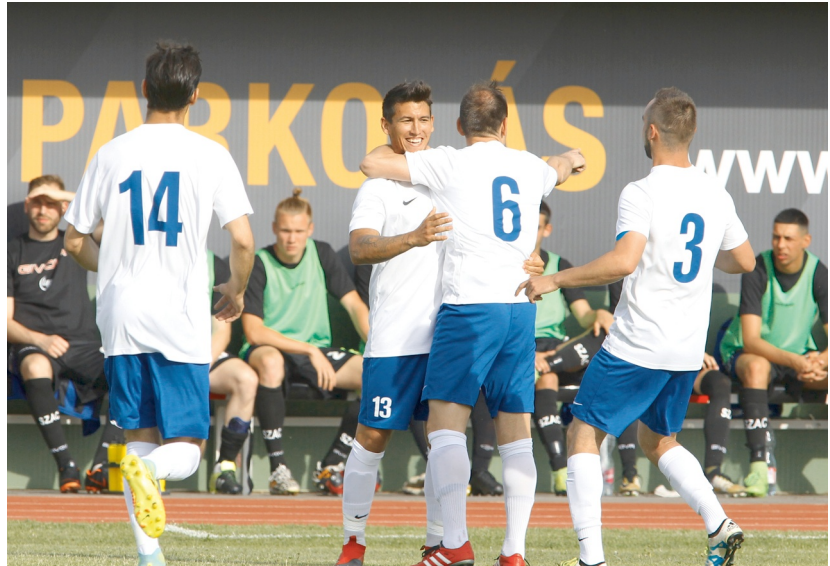
Nagy volt a verseny minden bajnokságban

-Ebben az osztályban rendkívül érdekesen alakult a hajrá, az utolsó forduló döntött a feljutásról. Húsz perccel múlt, hogy nem a BVSC-Zugló a feljutó, mert ekkor még vezettek. Kiegyenlített az 1908 SZAC, és így ők jutottak a BLSZ I. osztályba a Csep-Gól mellett. Három kieső volt, a CsHC 94, a Ferencvárosi FC valamint a KISE. Helyükre az MFC Favorit SE, az MLTC és a THSE-Szabadkikötő II. kerülhetett volna, de az MFC Favorit SE nem élt a jogával.