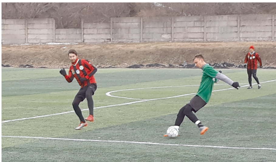
Nagy volt a harc BLSZ I-IV-ig