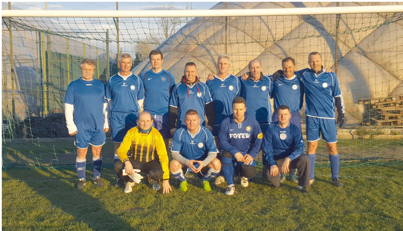
Az MTK évek óta meghatározó