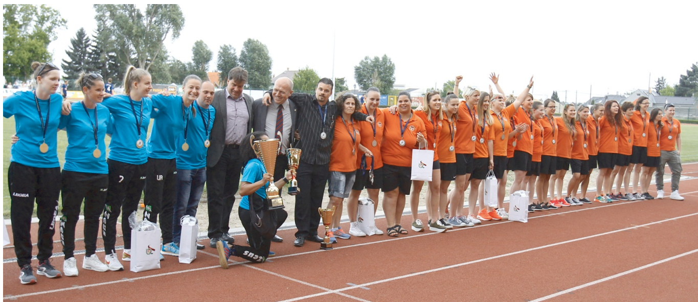
Felemelő volt a hangulat a 3. Női Budapest Kupa döntőjén

Az MLSZ Budapesti Igazgatóság a 42. Budapest Kupa döntő előtt rendezte meg a III. Női Budapest Kupa döntőt, melyet ezúttal a Kormányőr SE és a Metis csapata játszott.