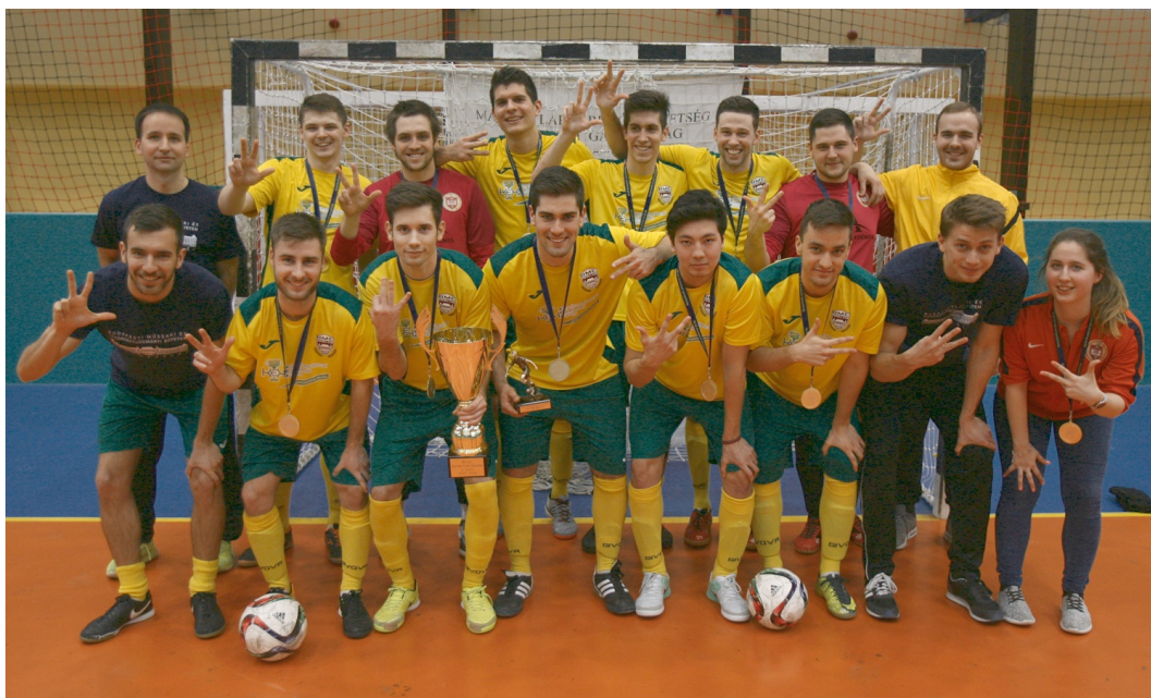
A BME csapata harmadszor lett a legjobb

Immáron ötödik alkalommal került megrendezésre a Budapesti Egyetemi Futsal Bajnokság, amelynek négyes döntőjére 2018. március 14-én került sor a budafoki Fonyódi Antal Sportsarokban.