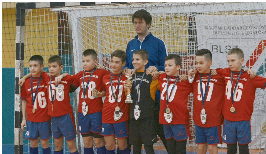
A Mészöly Focisuli országos bajnok lett

Az U13-as korosztályban 53 csapat nevezett és a március 3-i középdöntőbe közülük 6-an jutottak be, az FTC Futsal, a CSHC '94FC, a Mészöly Focisuli, a Soroksár, a Kastélydombi SE és az UTE. A középdöntők két hármas csoportban zajlottak és rendkívül izgalmasak voltak, végül a négyes döntőbe a az UTE, a So-