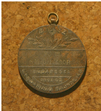
Ifjúsági érem 1963-ból

1950-ben a BLSZ elnöke lett, és ilyen funkciójában 1959 és 1963 között az MLSZ alelnöki posztját is betöltötte. A BLSZ-ben az elnöki tisztséget 1972-ben adta át dr. Tímár Györgynek, aki 1985-ig látta el ezt a feladatot.