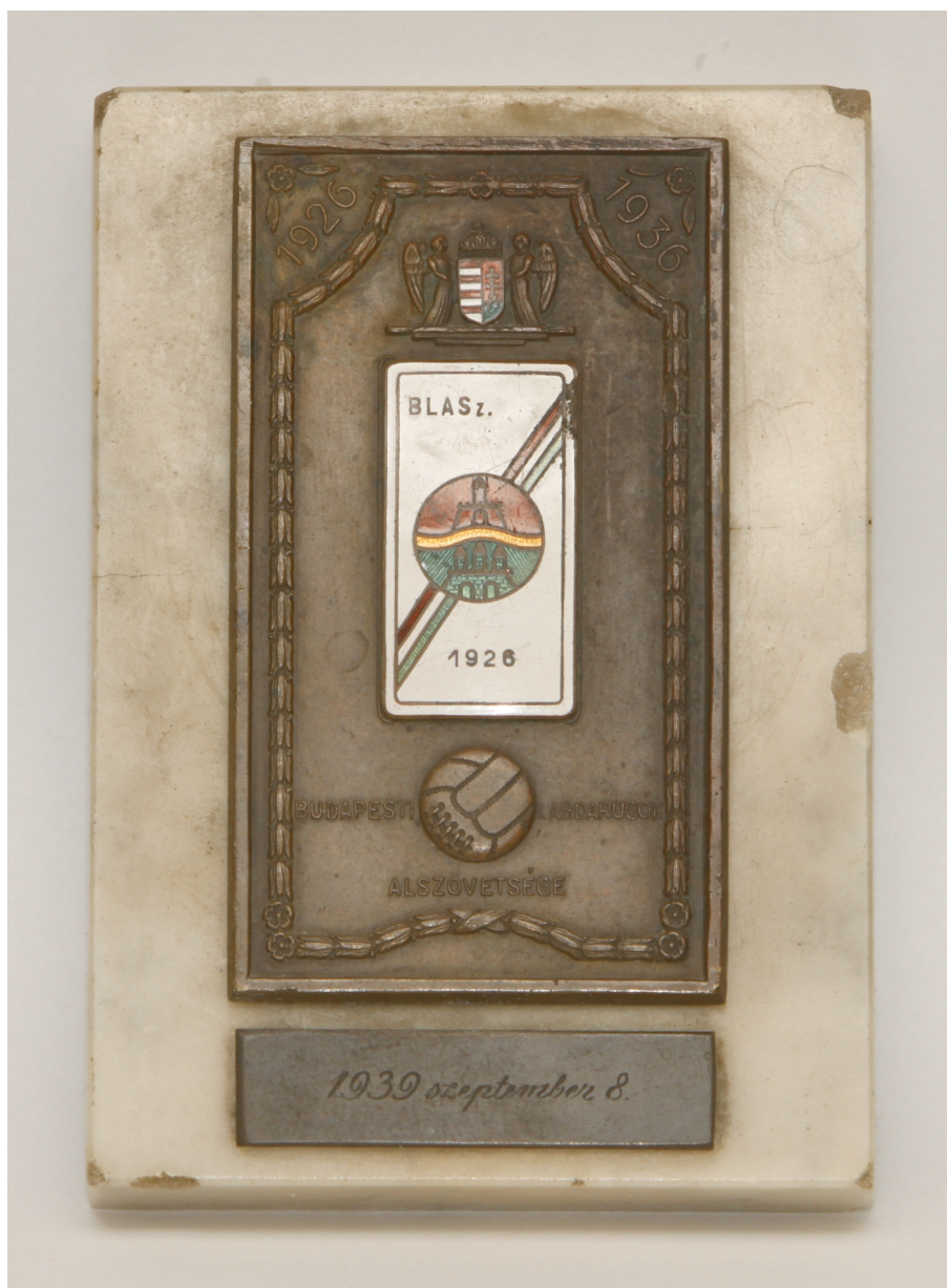
A BLASZ fennállásának 10 éves évfordulójára készített emléklakett

Visszatekintve a magyar labdarúgás elmúlt 118 évére elmondható, hogy az 1926-os esztendő az egyik legfontosabb, legmeghatározóbb, legnagyobb változást hozó év volt.