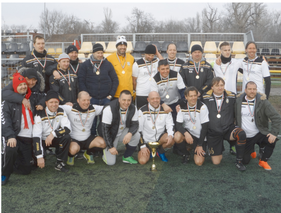
A Goldball Öregfűk nem adta a hazai pályát