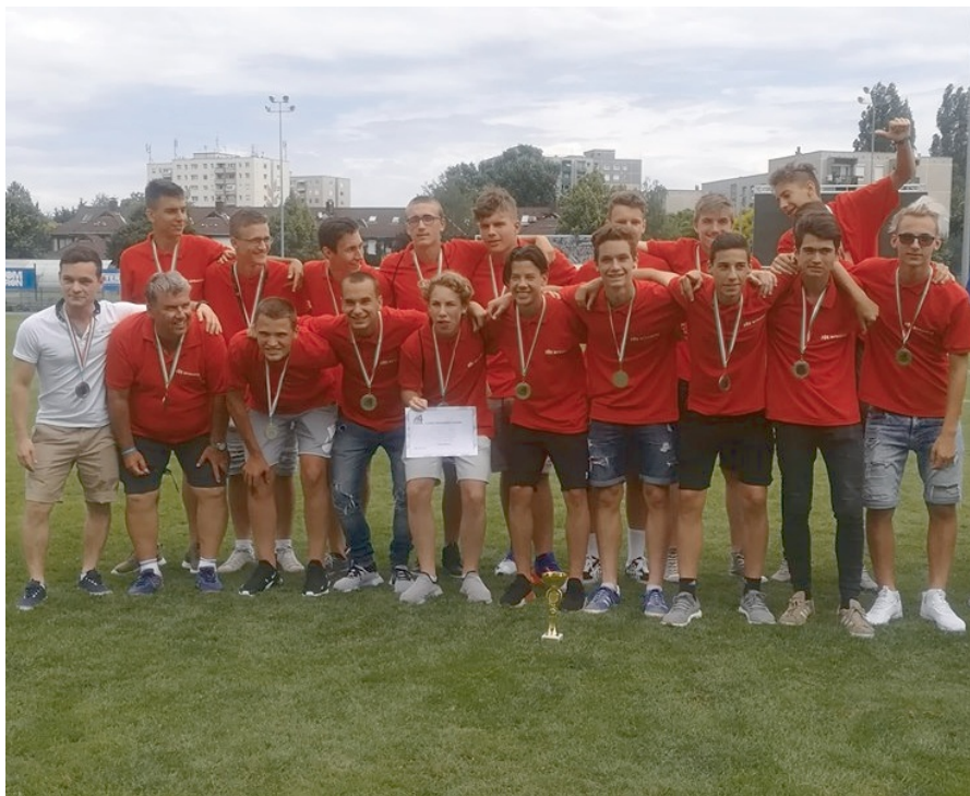
Büszkék lehettünk az U16-os csapatra