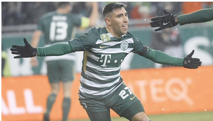
2018 őszi Gorrarannal az élre repült a Fradi

Az FTC az edzőcserét követően magára talált, és 5 pont előnnyel vezet a rivális Vidi előtt. A Honvéd az utolsó öt fordulóban nem tudott nyerni, de végül azzal őrizte meg a 4. helyet, hogy az Újpesttel döntetlen játszott. A 89. percben még a lilák vezettek, és ha marad az eredmény, akkor az Újpest zárja az őszt a 4. helyen. Nem így történt, egyenlített a Honvéd, és megőrizte 4. helyét. Az MTK szerzett meglepetéseket, legyőzte a Vidit, a Kisvárdától viszont kikapott.