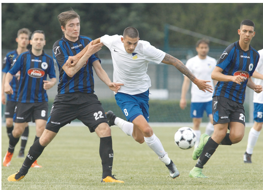
A rákospalotai csapatot a kupában sem lehetett megállítani