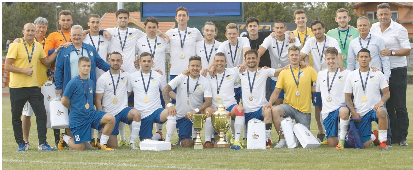
Ekkor még teljes volt a REAC játékosainak öröme

2017-ben az NBIII-ból kettő fővárosi csapat is kiesett, az Újpest II és a REAC. Előzetesen arra lehetett számítani, hogy az ő külön versenyüket hozza a 2017/2018-as Budapest I. osztály. A rákospalotaiak a bajnokság elején azonnal erőt is demonstráltak, az első fordulóban a II. Kerület UFC-t 10-0-ra verte meg, és öt körön keresztül gólt sem kapott. A félidei bajnok a rákospalotai csapat lett annak ellenére, hogy az Újpesttől 2-1-es vereséget szenvedett. Tizenöt meccs után tizenkét győzelme, két döntetlenje és ez az említett egy veresége volt. A veretlen, de öt döntetlent is begyűjtő Újpest II három ponttal volt lemaradva tőle. A tartós menetelésük ellenére az ősszel két csapat is tudta velük tartani a lépést, az Ikarus és a Gázgyár a nyomukban haladt, és fordulásnál csak négy ponttal voltak lemaradva az első helytől.