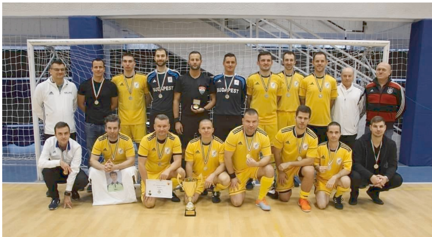
A budapesti játékvezetők válogatottja

Az MLSZ Borsod-Abaúj-Zemplén megyei Igazgatóságának szervezésében került megrendezésre a XIV. Országos Sípmeister Fesztivál. Miskolcon, két helyszínen, az Egyetemi Körcsarnokban és a Herman Gimnázium tornacsarnokában rendezték meg az eseményt, amelyen a 19 megye és Budapest játékvezetői mérték össze erejüket kispályás labdarúgásban.