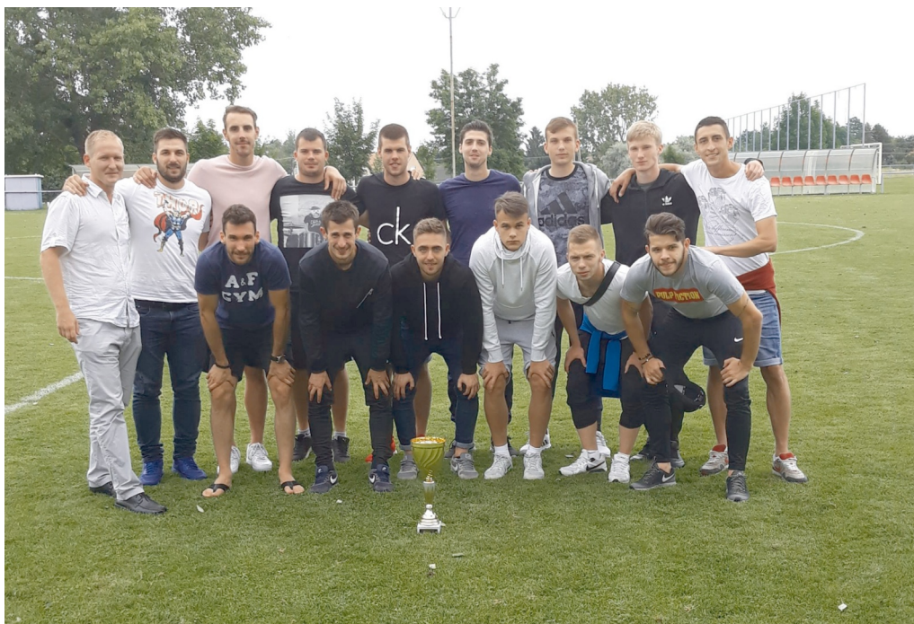
A Budapest válogatott egységcsapatként játszott

Az MLSZ Komárom-Esztergom megyei Igazgatóságának szervezésében Budapest, Fejér megye és Komárom-Esztergom megye amatőr válogatottjainak részvételével 2018. június 9-én régiós torna került megrendezésre. Budapest válogatottja a korábbi edzőmeccseket követően a torna hetében két edzéssel készült fel. Amúgy is összeszedett csapatunk ennek is köszönhetően nagyon egyégesen várta a mérkőzéseket, amely egység eredményre is vezetett.