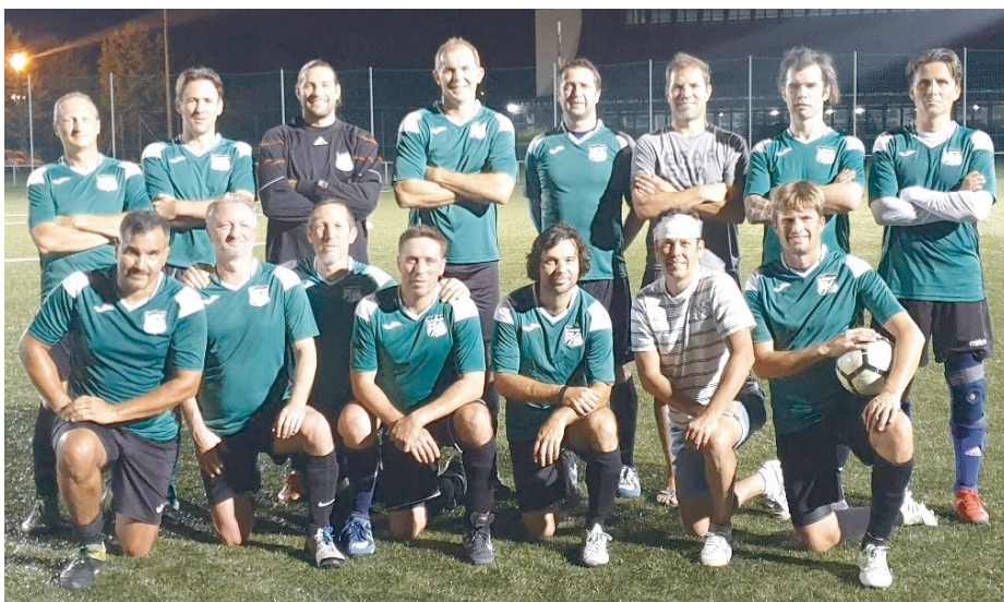
A II. Kerület UFC újoncként veretlen maradt az Old Boys bajnokság harmadik vonalában

A 2019/2020-as bajnoki évben az Old Boys III. osztály mezőnyét két csoportra osztották. Mindkét csoportban 15-15 csapat szerepelt, és az 1. csoportban az élen a II. Ker. UFC állt 34 ponttal veretlenül és egy döntetlennel. A riválisok a 30 pontos Duna SK, és a 27 pontos Hidegkút voltak. Ez utóbbi egyel kevesebb meccset játszott. A 2. csoportban