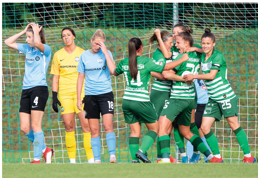
Az MTK peches góllal vesztette el a BL indulásért zajló csatát.

Az Astra magabiztos közép csapatként szerepel, míg az osztállyal még mindig ismerkedő Kelen SC minden pontnak és gólnak örül és már hatot szereztek is! A Haladást és a Győr ellen is győzni tudtak.