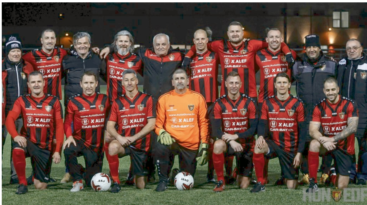
A Honvédnak a bajnoki cím megnyerésére is lett volna esélye

A BLSZ szervezésében évek óta zajlik a bajnokság az idősebb korosztályhoz tartozó egykori aktív labdarúgók részvételével. Három korcsoportban léphetnek pályára a csapatok. Az Öregfiúk 34 éves kortól, az Old Boys korosztályban 44 év az alsó korhatár, míg a Veteránok mezőnyében azok játszhatnak, akik már betöltötték az 54. életévüket. Visszafelé lehet szerepelni, vagyis egy Veterán korcsoportos nemcsak az Old Boys bajnokságban, hanem az Öregfiúknál is játszhat. Egy fiatalabb korcsoportos viszont nem léphet pályára az idősebbeknél.