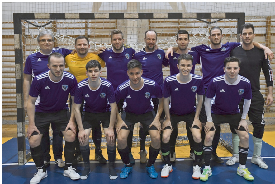
A BAK 2020-ban már az NB II-ben kezdett

Az Országos Futball bajnokságok harmadosztályának megfelelő Regionális Futball bajnokságban évek óta Budapest adja a legtöbb csapatot, az Igazgatóság ezért is szervez két csoportot is az MLSZ által kiírt sorozatban. A 2019-20-as évben a két budapesti csoportban 22 csapat kezdte meg a sorozatot, a bajnokságok felfüggesztésekor 20 együttes volt még versenyben. Az első csoportban az Airnergy FC nyújtotta a legkiemelkedőbb teljesítményt. 11 meccsükből 10-et is meg tudtak nyerni, egy esetben döntetlent játszottak, egyedül a záró táblázat második helyén lévő Szigetszentmiklós tudott tőlük pontot elcsípni. A másik csoportban a TF SE II., a BAK és az Újpest FC is remek csapattal rendelkezett. Amikor lezárták a sorozatot, akkor a TF volt az első helyen, de nehéz lett volna akkor megjósolni a végső győztest. Érdekes, hogy a labdarúgásban nagymúltú, újralakult BAK az FTC-vel futball területen partneri kapcsolatot tudott létrehozni. Az Újpest FC pedig a BLSZ I-es csapataira építve játszotta végig a sorozatot, és a 2020-ban induló bajnokságban is hasonlóan az NB1-es klub tartalékgárdájának labdarúgóira építi futball keretét.