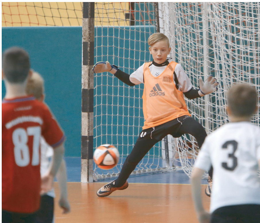
A 8 évesektől a felnőttéig futballoznak Budapesten

kihirdetésére viszont a rájátszás elmaradása miatt itt sem kerülhetett sor.