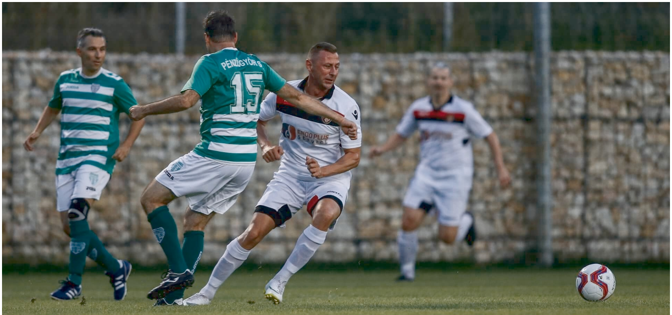
Pénzügyőr-Honvéd BKE rangadó az Öregfiúk I. osztályban