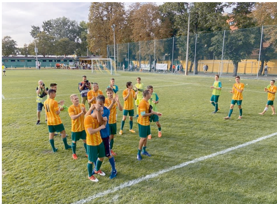
Örömmünep: 64 közé jutott a Gázgyár

A harmadik "főtáblára jutást" eldöntő mérkőzésen a Gázgyár a Budapest II. osztály egyik legerősebb csapatát a MUN SE-t győzte le 2-1-re.