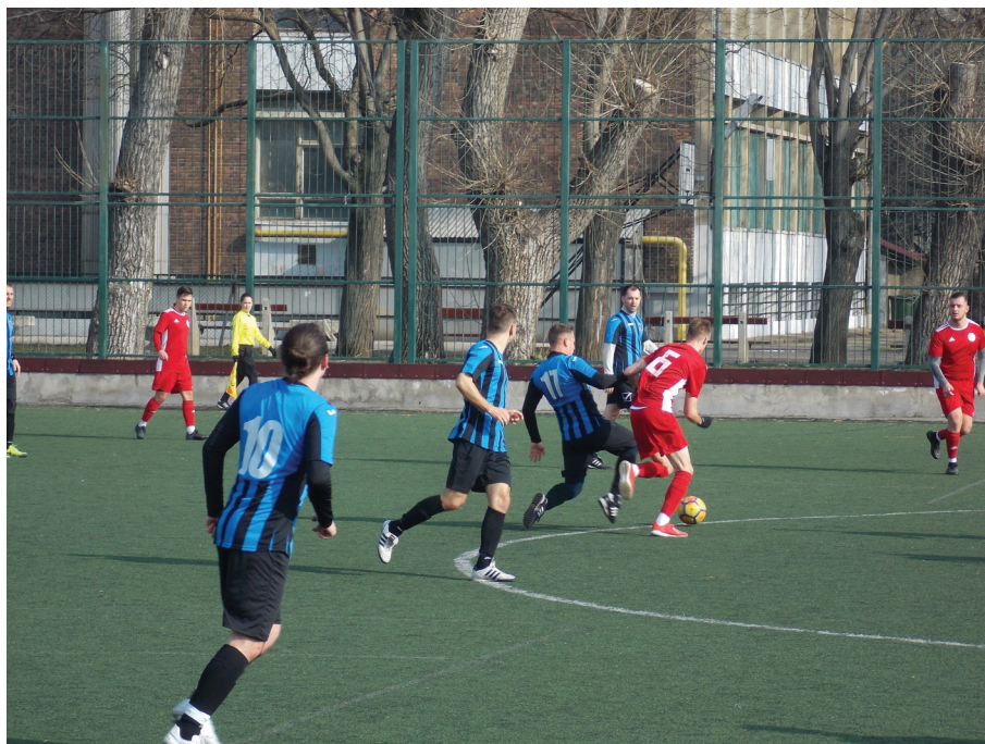
A Kelen hatalmas hangulat közepette nyerte meg a Budapest Kupát