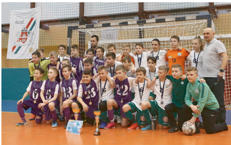
Az Újpest Futsal Club és az FTC közös fotója

A találkozót alatt fantasztikus szurkolás hallatszott, viszont a lelátón és a pályán is a kölcsönös tisztelet volt tapasztalható. Az Újpest által 4-2-re megnyert mérkőzés után a két csapat még egy közös fényképre is összeállt.