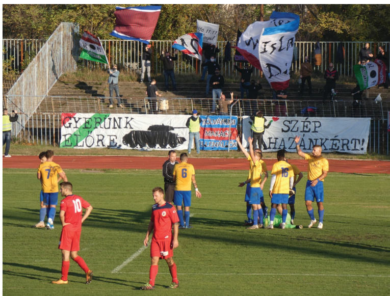
Csepelen, amíg nem volt zárkapu, mindig jó volt a hangulat