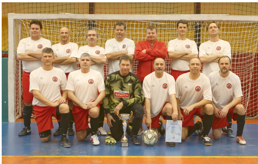
A Budafok OldBoys tornagyőztes csapata