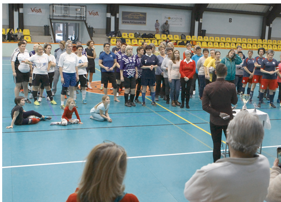
Sikeres volt a 2020-as Retro Női Teremtorna