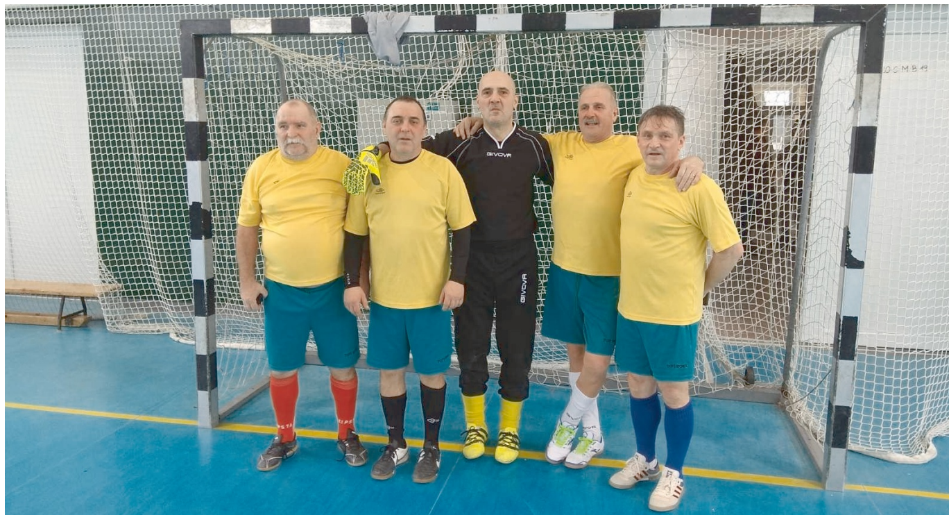
A Skorpió mindig készen áll a játékra

A legidősebb korosztály, az 54. évüket betöltött játékosok szerepelnek a Veterán bajnokságban. A mérkőzéseket félpályán játsszák egy kapussal és nyolc mezőnyjátékoskal ötször kétméteres kapukra. A mérkőzéseken folyamatosan hét játékos cserélhető, és a játékidő 2x35 perc.