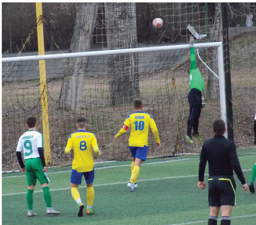
A RAFC az Airnergy ellen vívta a legnehezebb mérkőzéseit