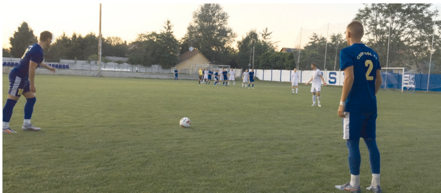
Szabadrúgásra készen a Csep-Gól

* az Újpest FC II-től 4 (négy) pont levonva