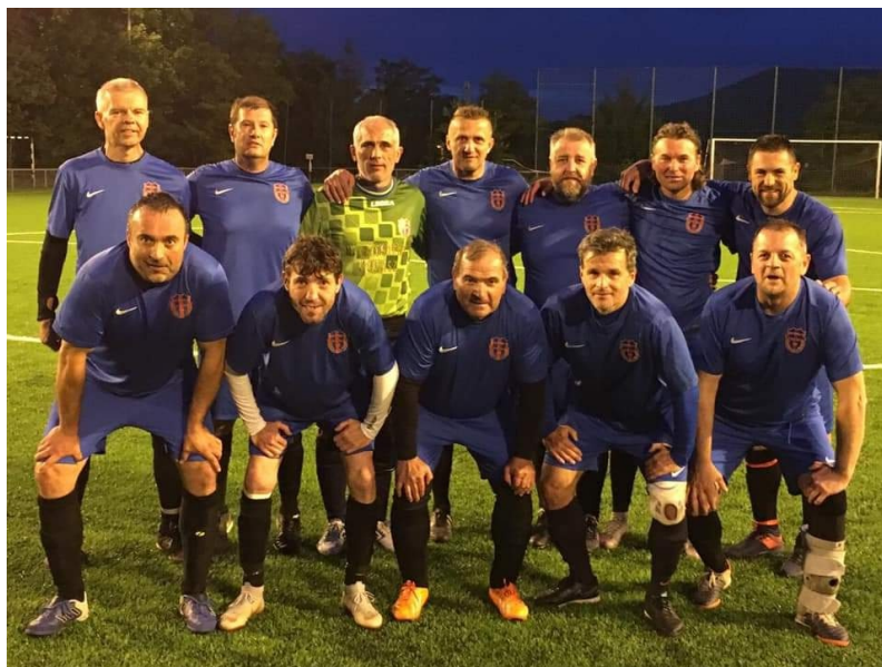
A Nagytétény élt a lehetőséggel

A III. osztályban két csoportban zajlott a bajnokság. Az 1. csoportban (14 csapat) már az őszi szezon után is a Pátyi SE vezetett, és a bajnoki év végére is megőrizte a pozícióját. A dobogó második és harmadik fokáért a Duna SK és az Issimo vívott nagy csatát. A Duna SK-nak sikerült az ezüst, az Issimo viszont lecsúszott, mert beelőzte a