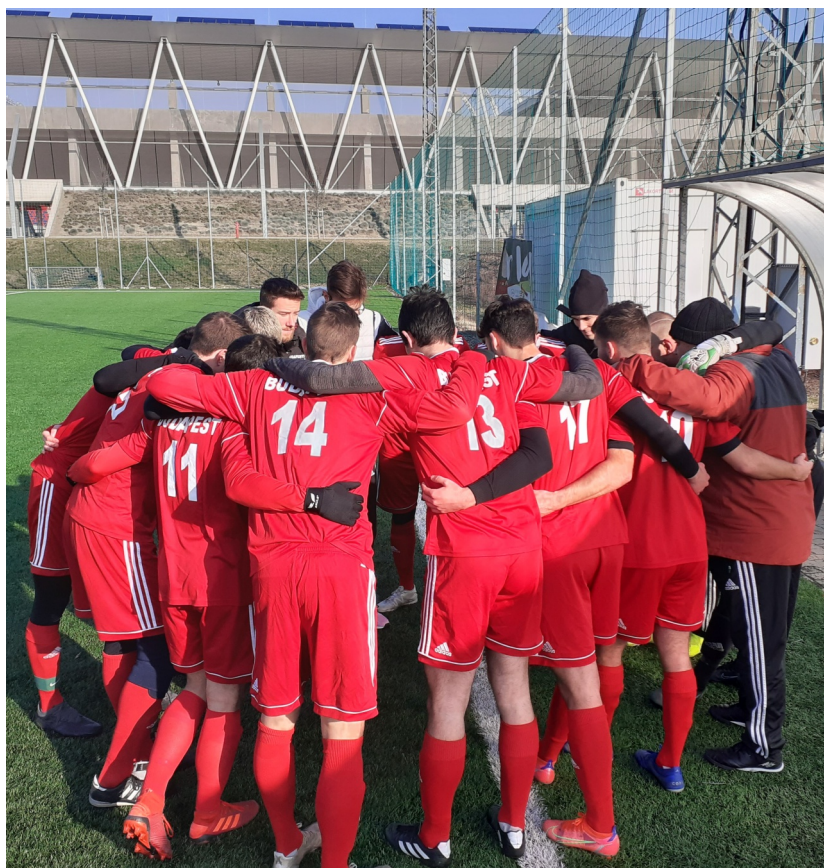
A csapategységen semmi nem múlt

"Mindig megtiszteltetés, ha behívnak a Budapest válogatottba, és természetesen mindig nagy örömmel veszek részt az edzéseken és meccseken. A mostani