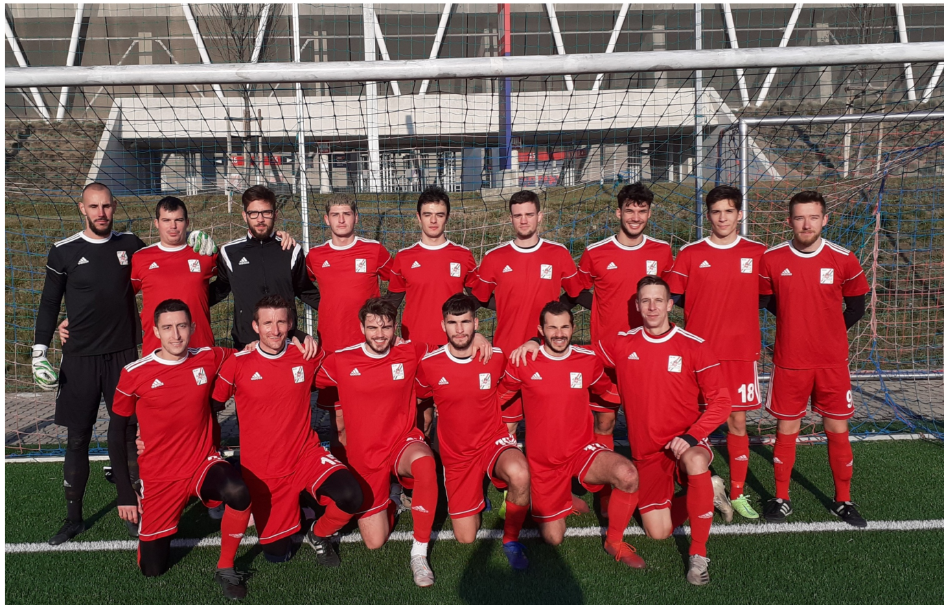
Budapest amatőr válogatottja remek teljesítménnyel lett második

Két győzelemmel, egy döntetlennel és egy vereséggel Budapest a 2. helyen zárt az MLSZ Fejér Megyei Igazgatósága által 2022. január 15-én és 16-án megrendezett Megyei Labdarúgó Válogatottak Dél-Közép Dunántúli Regionális Tornáján, ahol Budapest ellenfele Baranya megye, Somogy megye, Tolna megye és Fejér megye volt.