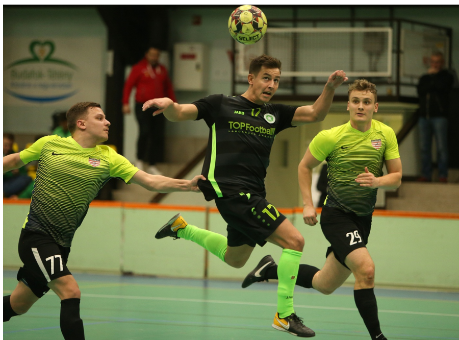
A Nimród sem tudta megfogni a szárnyaló Airnergy-t

"Mindig szívesen jövünk erre a színvonalas tornára, amely egy nagyszerű kezdeményezés. Ismét jó színvonalú mérkőzéseket játszhattunk teremben, remek körülmények között, remek szervezésben. Annak ellenére, hogy harmadszor nyertük meg a tornát, nem fogjuk megunni, ígérjük, hogy jövőre is itt leszünk és szeretnénk akkor is az első helyért küzdeni."