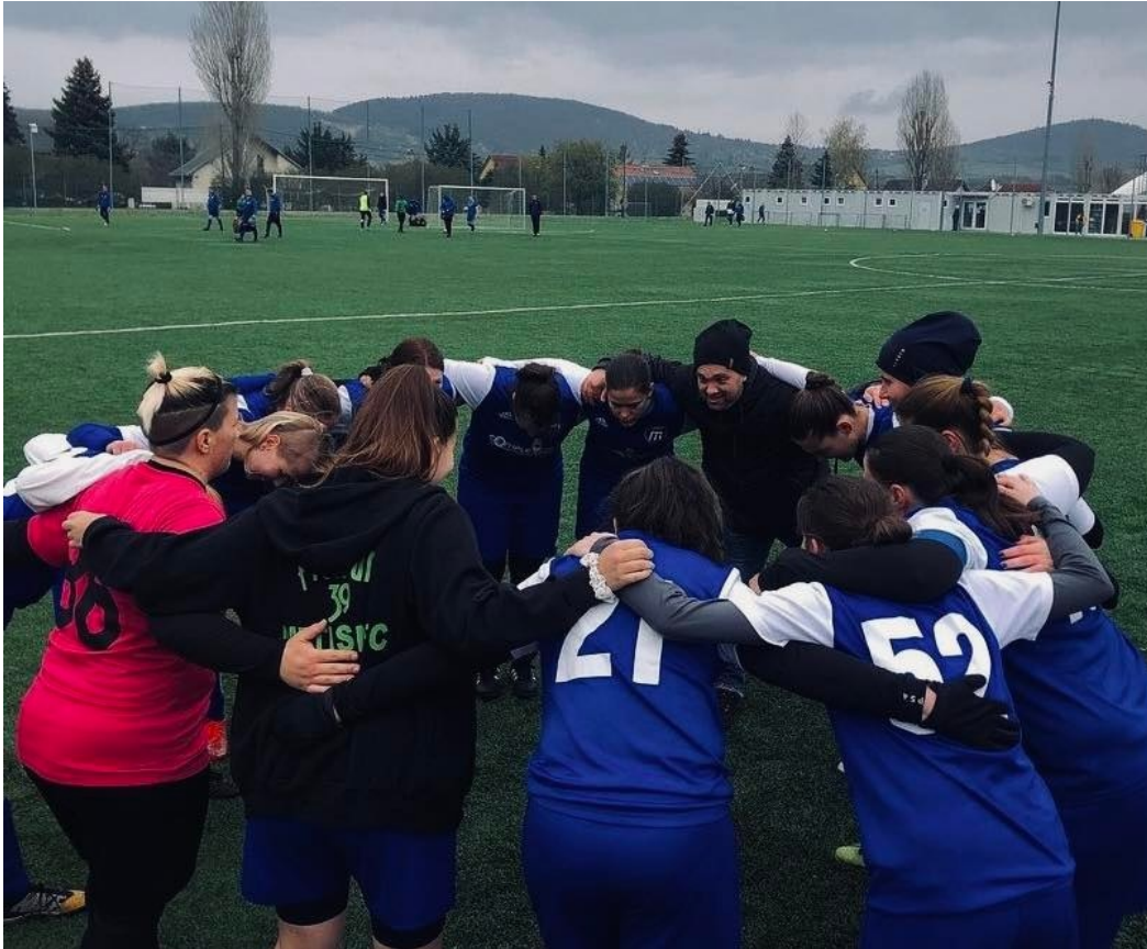
Újra együtt a BLSZ női mezőnye

A 2018/2019-es bajnoki évben volt utoljára női csapatok részére bajnokság a BLSZ szervezésében. Akkor, 2019 nyarán a csapatok egy jelentős része élt azzal a lehetőséggel, hogy az NB II-ben indulhat, és volt megszűnő csapat is. Ilyen körülmények között nem lehetett beindítani a bajnokságot.