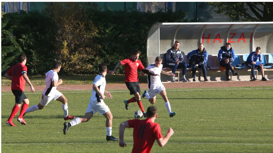
A Vízművek és a Gázgyár rangadója