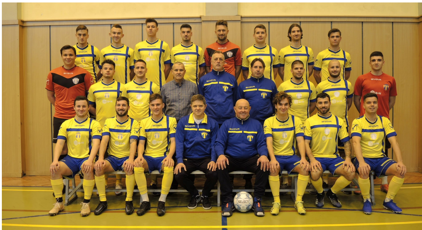
Pokolból a mennybe: a BKV Előre majdnem kiesett, majd az NB III 2. helyén telet