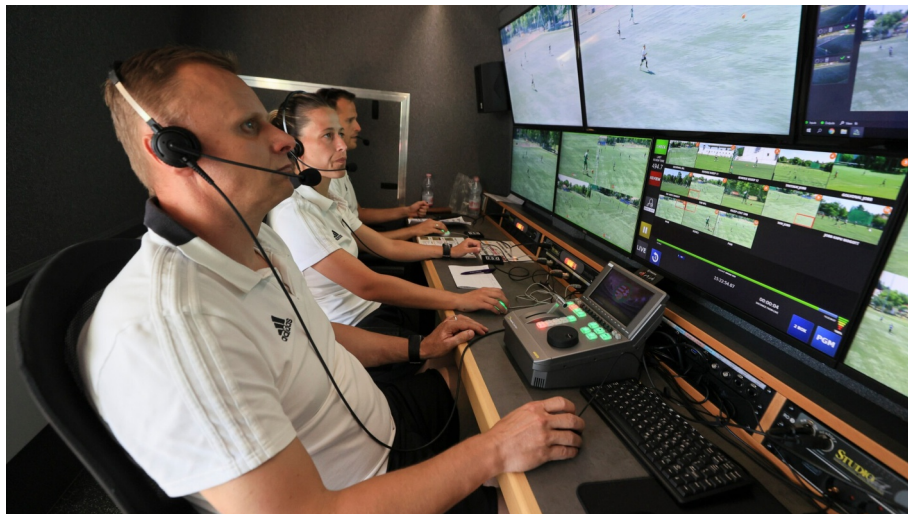
Az Ikarus-pályán készültek az NB I-es játékvezetők