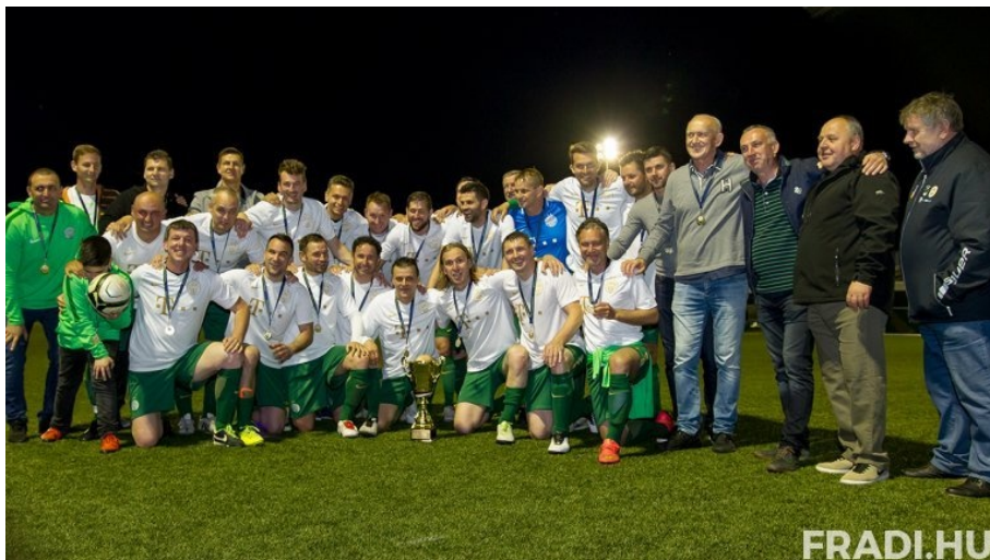
A Ferencváros Öregfiúk nagyon együtt volt

Féligőben az RTK és a Kelen azonos pontszámmal állt az élen, mindkét csapatnak 29 pontja volt. Szorosan ott volt egy pont hátránnyal mögöttük a Pestszentimre. A tavaszi folytatásban az RTK jobban szerepelt, hat pont előnnyel lett bajnok a Kelen előtt. A Pestszentimre megtartotta a 3. helyet a dobogón. A korábban jól szereplő 1908 SZAC és a REAC csak a középmezőnyben végzett. A Csillaghegy volt az egyik kieső, a másik a Trend Csepel, amely meg is szűnt. A gólkirály a Dunaharaszti játékos lett 49 találatával, 15 góllal megelőzve az öt üldözőket. A III. osztály csapatai két csoportban játszottak, és az egyfordulós alapszakasz után a rájátszás következett. Az 1. csoportban 15 csapat játszott, és a BAK Respect nyert a Pécel előtt, de a bajnok nem vállalta a magasabb osztályt. A 2. csoportban 16 csapat szerepelt, és a Mélykút meg a II. Kerület UFC rivalizált az első helyért. Ez a Mélykút együttesének sikerült, és ők vállalták a II. osztályt.