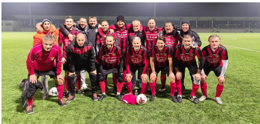
A Honvéd bejelentkezett az Öregfiúk bajnoki címéért