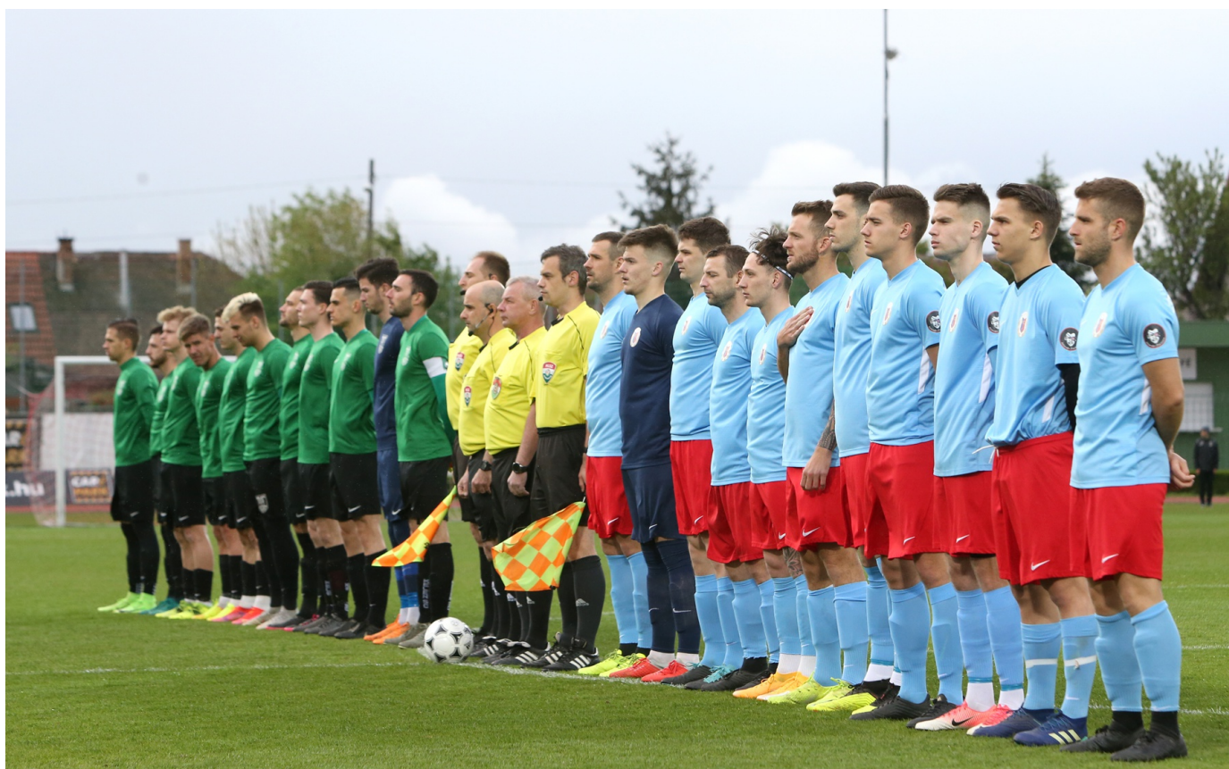
A Himnusz ezúttal a Kelennek és a Csepelnek szólt a Budapest Kupa döntője előtt