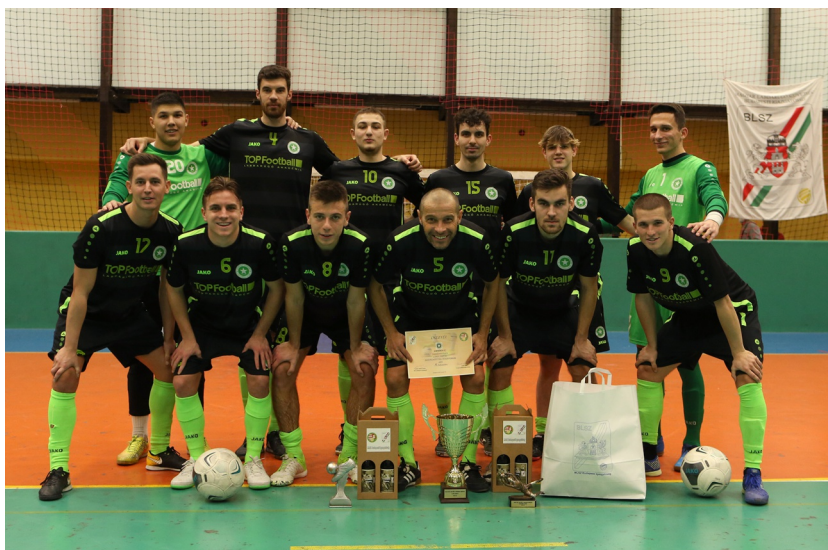
Az Airnergy sorozatban harmadszor nyerte meg a felnőtt teremturnát