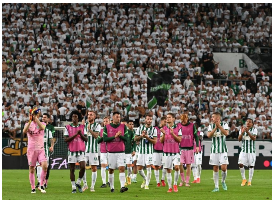
A Fradi sorozatban harmadszor jutott csoportkörbe

Megnézzük milyen eredményeket értek el a 2020/2021-es bajnoki évben, és hogy szerepeltek a 2021/2022-es idény őszi fordulójában. A 2020/2021-es bajnoki évben az NB I-ben 5, az NB II-ben 2, és az NB III három csoportjában 9 budapesti csapat indult. A 2021/2022-es évadban változott a csapatok létszáma az NB I-ben, négyre csökkent, mivel a Budafoki MTE kiesett. Az NB II-ben viszont négyre emelkedett, mert a Vasas FC és a Soroksár SC mellé csatlakozott az NB I-ből kieső Budafok, valamint az NB III Nyugati-csoportjában bajnok III. Kerületi TVE. Az NB III-as mezőny létszáma maradt 9 csapat a változással, hogy a THSE-Szabadkikötő kiesett, míg a BLSZ I. osztály bajnoka a Kelen SC visszakerült.