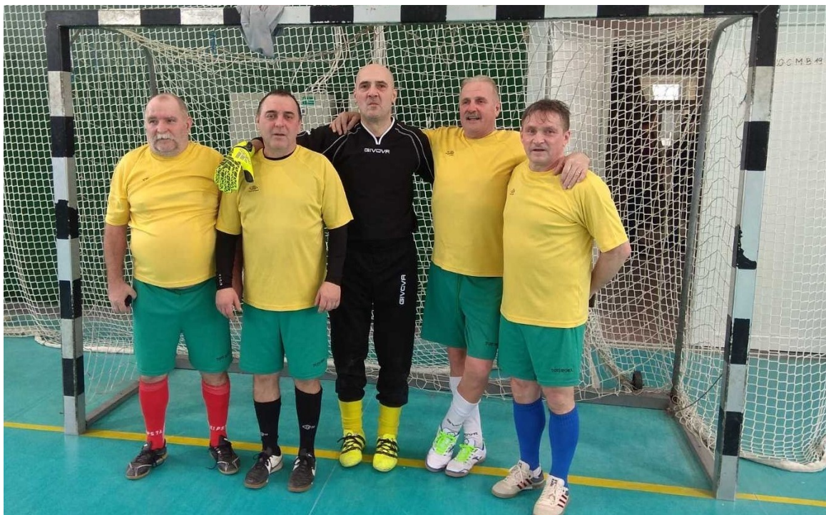
A Skorpió uralja a Veterán mezőnyt

Az 54. életévük betöltött játékosok szerepelhetnek a legidősebb korosztályban, a Veterán bajnokságban. A mérkőzéseket felpályán játsszák egy kapussal és nyolc mezőnyjátékoskal ötször kétméteres kapukra. A játékidő 2x35 perc, és mérkőzésenként hét játékos cserélhető.