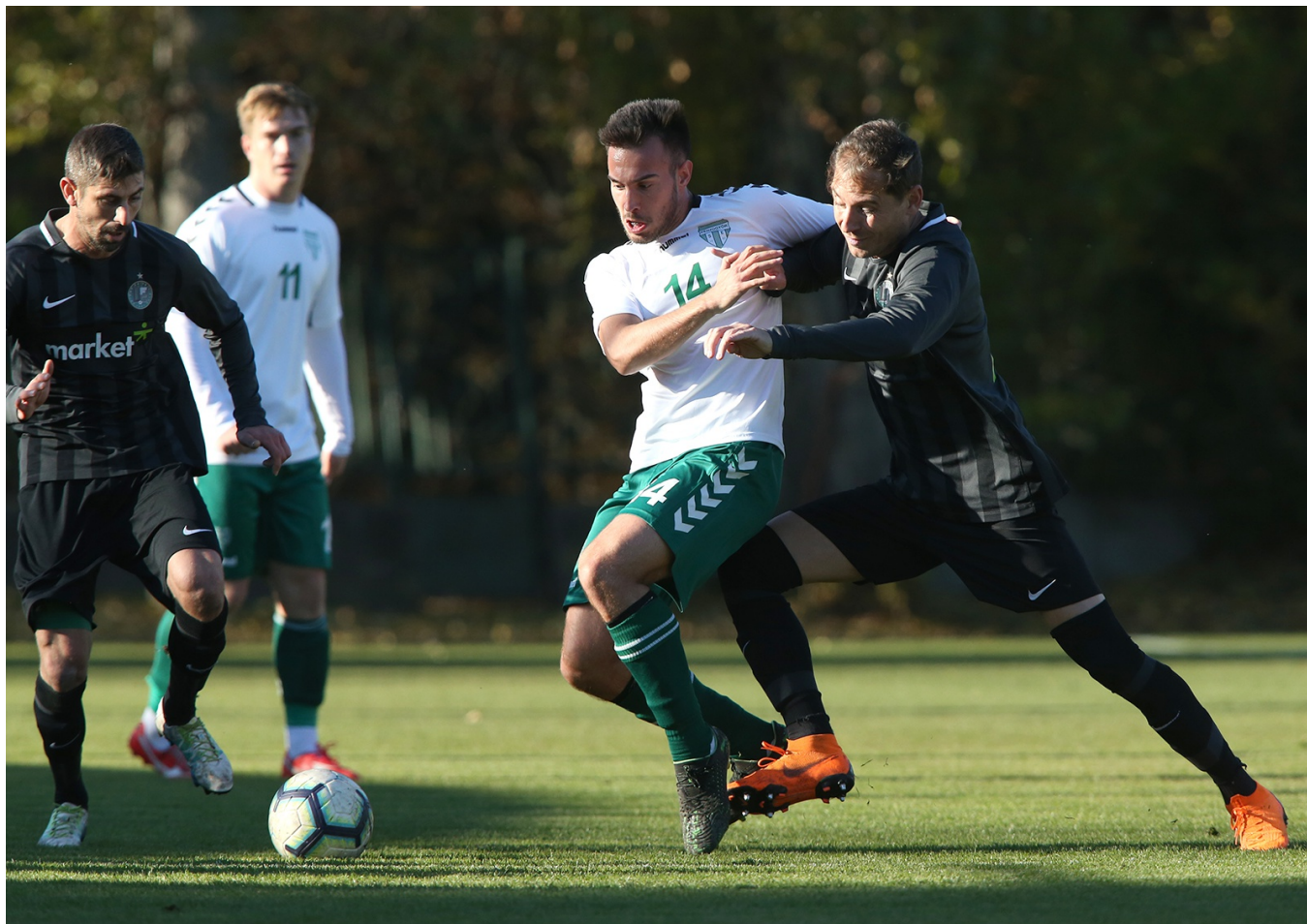
A Pénzügyőr-Unione rangadót ősszel a Pénzügyőr nyerte

Óriási harc várható tavasszal a bajnoki címért a BLSZ I. osztályban. Az őszt a Pénzügyőr SE és az Unione FC is 38 ponttal zárta, közöttük a sorrendet a gólkülönbség határozta meg a Pénzügyőr javára. A 3. helyen a még veretlen Csepel FC áll 37 ponttal. Vélhetően hármójuk közül dől el az aranyérem sorsa.