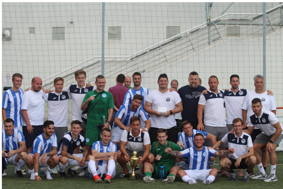
Az Építők nyerte a VAR Kupát