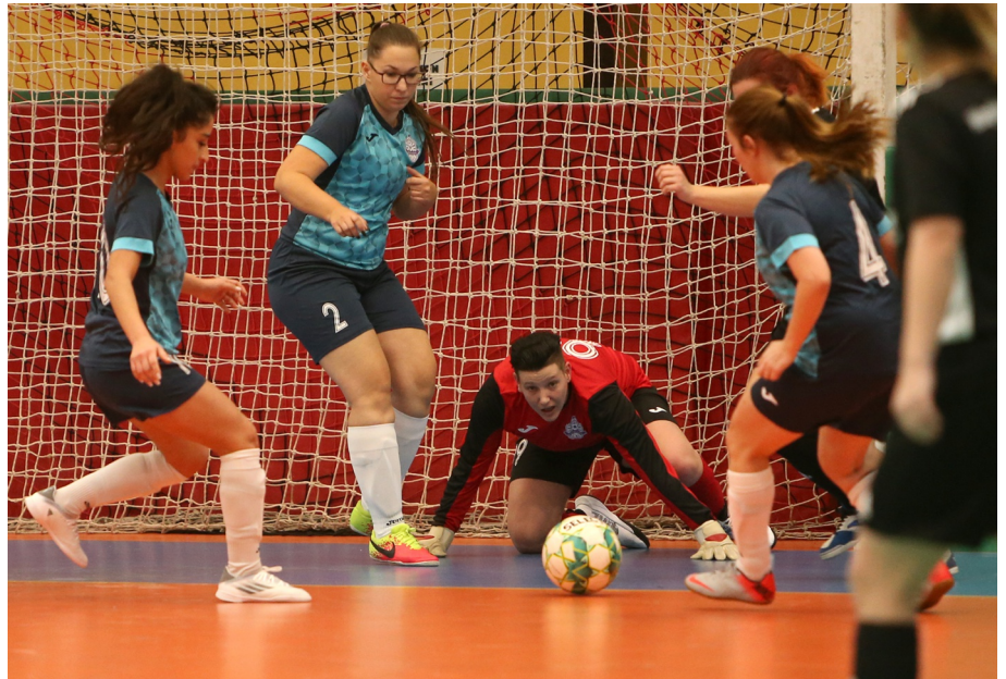
A női teremtorán is középpontban volt a labda