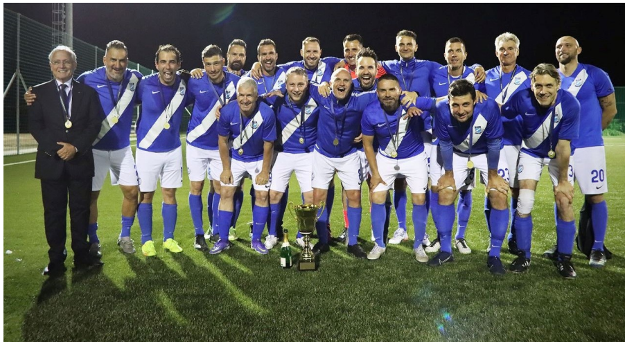
Az MTK nagyon összeállt

A Ferencváros sikeres sorozata 2017-ben kezdődött, és csak azért nem mondhatták el magukról, hogy zsinórban ötször végeztek az első helyen, mert 2020 tavaszán a járvány miatt félbeszakadt a bajnokság. A négyszeres győztesnek viszont a 2021/2022-es idényben megszakadt a szép sorozata, az MTK Budapest nyerte az aranyérmet. Ez a bajnoki változatlanul 11 csapattal indult, és az őszi idény után a Honvéd BKE állt az élen 25 ponttal. A címvédő Ferencvárossal döntetlent játszottak, és egy vereséget szenvedtek, az esélytelenebb AC Zrínyi együttesétől. A 2. helyről az MTK várhatta a tavaszt két vereséggel, a Honvédtól és az AC Zrínyitől kaptak ki, míg a címvédő Ferencváros csak a harmadik helyen zárt. A zöld-fehérek gyengébb szereplésében meghatározó volt, hogy a járvány miatt többször is le kellett mondaniuk mérkőzéseket. Tavasszal viszont hengerelt az MTK, minden mérkőzését megnyerte, és így 54 ponttal lett első az 52 pontos Honvéd előtt. A kispesztiek is jól teljesítettek, mindent nyertek, csak az MTK-tól kaptak ki, és ezzel visszacsúsztak a 2. helyre. A Ferencváros