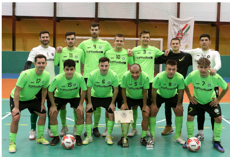
Az Airnergy sorozatban negyedszer nyerte meg a felnőtt teremtornát

20 sportszervezet részvételével került megrendezésre a 2022/2023-as BLSZ Felnőtt Téli Teremtorna, melynek csoportmérkőzéseit az előző év decemberében bonyolította le az MLSZ Budapesti Igazgatósága. A torna januárban a középdöntő és a döntő mérkőzéseivel folytatódott.