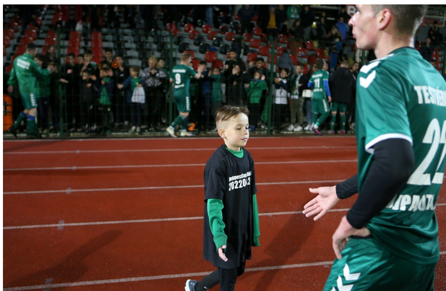
Előttem az utódom