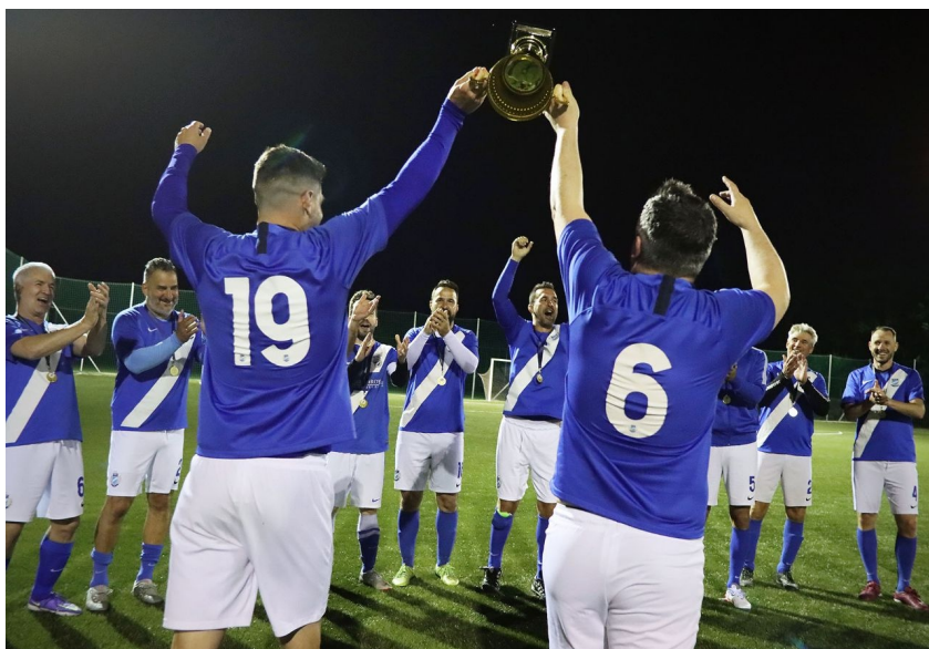
Csúcsra értek az MTK-s öregfiúk