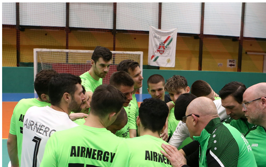
Az Airnergy nagy harcban az NB III-as futsal első helyéért