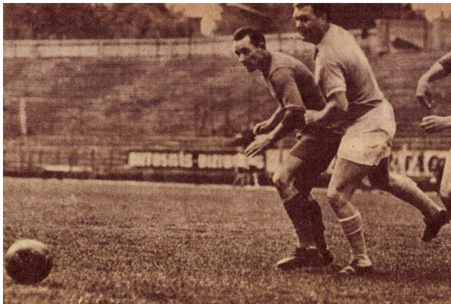
Szusza Ferenc a "gólkirály" látható 42 éves korában az Újpesti Dózsa - V.Dinamó BLSZ Öregfiúk mérkőzésen.

Az 1962. évi bajnokságot tavaszi-őszi rendszerben bonyolították le, hétfői játéknapon. Ebben az idényben az 1927-ben és az azt megelőzően születettek szerepelhettek. A játékosoknak fényképes igazolásokat kellett csináltatniuk. Hat hónapnál nem régebbi sportorvosi engedély kötelező volt.