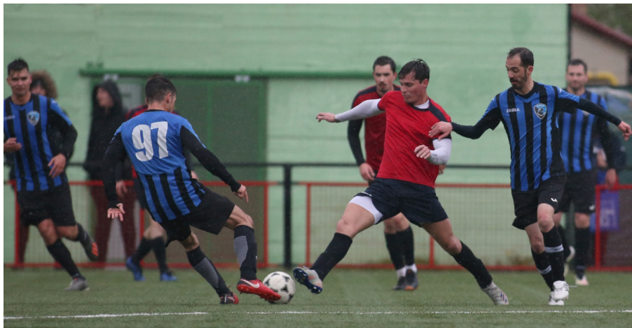
Nagy volt a harc az Egri Erbstein kupa döntőjében