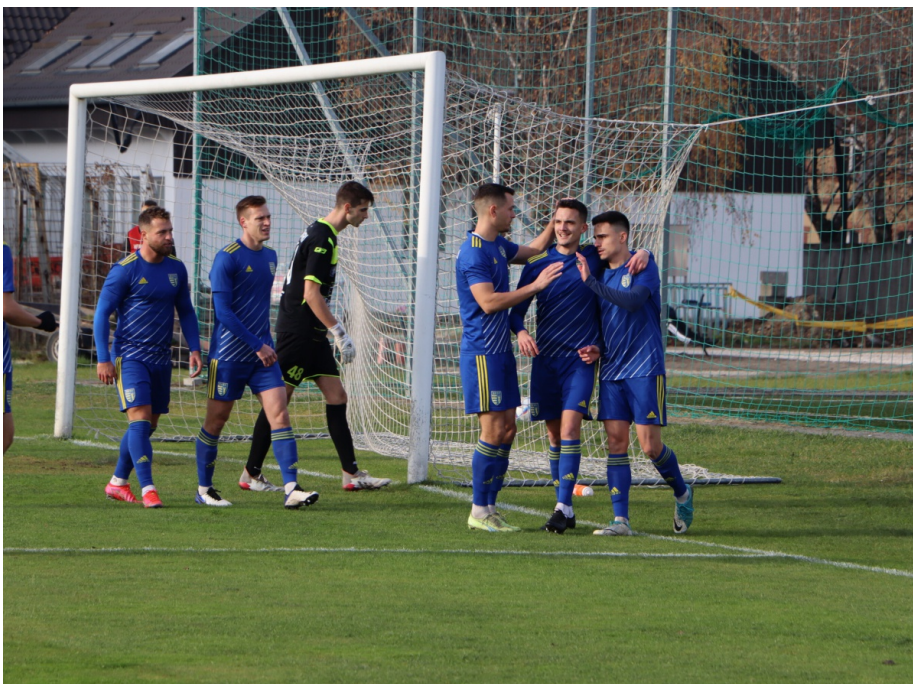
Szenzációs őszt produkált a BVSC

Az NB III-ban maradási a feltöltésnek köszönhető a BKV Előre, és a Nyugati-csoportból átkerült a Keletibe. Parádésan kezdte a bajnoki évet, hiszen 12 fordulón keresztül veretlen maradt. Ekkor a későbbi bajnok győzte le őket. A tavaszi folytatást 4 pont hátránnyal a 2. helyről várhatták, ám a hajrában több többször botlottak, így végül meg kellett elégedniük a 3. hellyel. Az Újpest II ősszel váltakozóan teljesített, ám volt egy bravúros győzelmük, éppen fővárosi rivális, az Előre ellen 7-0-ra nyertek. Ellentétben a BKV-val, a lila-fehéreknek sikeres volt a hajrá, és a középmezőnyben zártak.