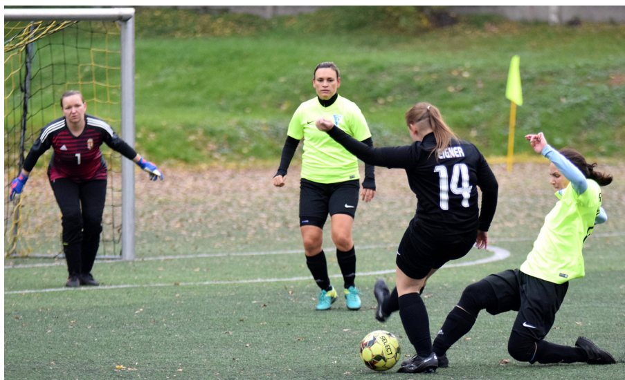
Nimród - RKSK a női bajnokságban

Az őszi szezon végén a budapesti csoportban a Nimród vezet 22 ponttal, szorosán ott mögötte a 21 pontos Rákosmenti KSK. A harmadik helyet az Azul Verde SC foglalja el 18 pontjával. Az erőviszonyok alapján ez a három csapat az esélyes arra, hogy a felsőházba kerüljön. Érdekesség, hogy a Nimród csak egy alkalommal kényszerült vesztésként elhagyni a pályát, a csoportban újonc Zöld-Fehérek SE győzött ellenük, és a Zöld-Fehéreknek ez volt eddig az egyetlen győzelme.”