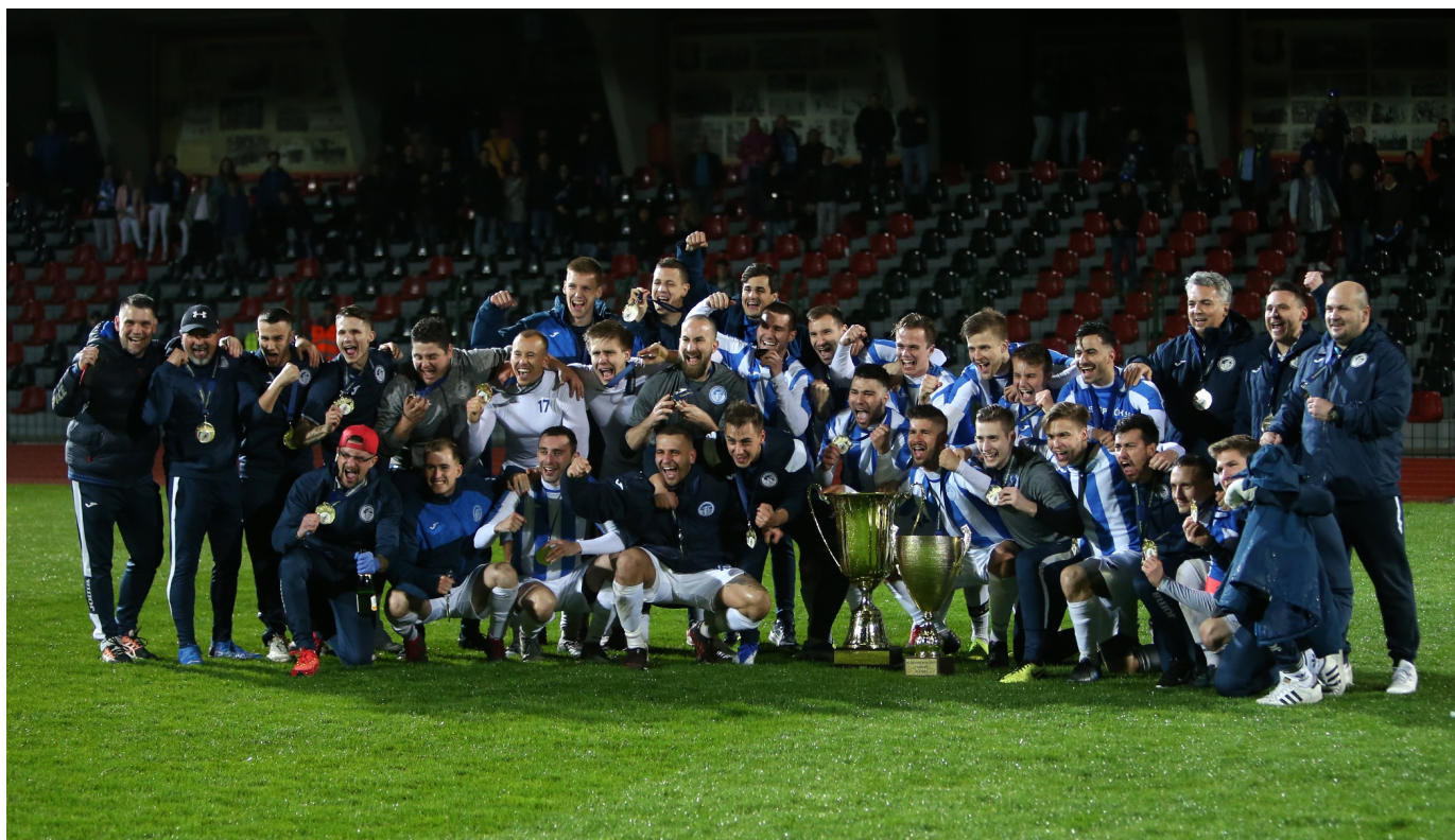
A 43.sz. Építők tovább szépítette történelmét