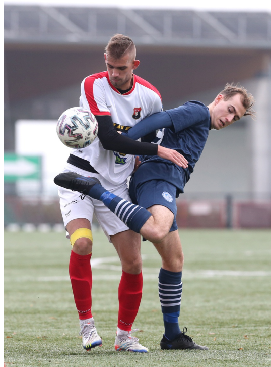
A Budafok az Építők ellen szépen zárta az őszt

Az, hogy mi várható a tavaszi folytatásban szinte lehetetlen megmondani, de akár végig sokszereplős maradhat a játék.