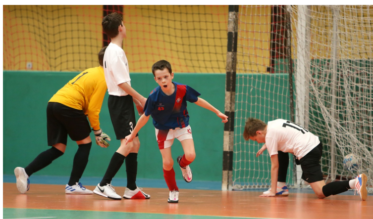
Futsal minden évszakban, minden korosztályban