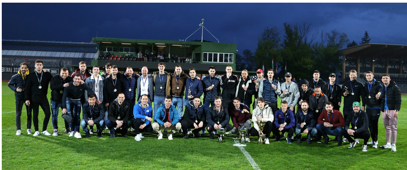
A Merkapt legyőzte a kupa életrehívóját, a BAK csapatát

A 46. Budapest Kupa fináléja előtt került sor a 2. Egri Erbstein Kupa döntőjére, ahol a Merkapt SE és a Budapesti Atlétikai Klub mérkőzött meg egymással a híres magyar edzőről elnevezett a BAK által útjára indított serlegért. A mérkőzés helyszínéül a Budafok műfüves pályája szolgált.