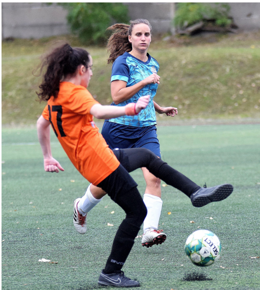
Újra együtt a BLSZ női mezőnye

A BLSZ már 2020 nyarán tervezte a női bajnokság újraindítását, de nem volt kellő jelentkező. A 2021/2022-es bajnoki évre összejött hét csapat, de a csapatokban kevés volt a játékos, így csak háromnegyed pályán indulhatott a bajnokság. Ebben a formátumban a kapus mellett 8 mezőnyjátékos szerepelhet, és folyamatosan lehet cserélni. Már a bajnoki rajton találkozott egymással a két esélyes, a Metis NFL és a Kelen. A rangadót a Kelen nyerte, ám utána a Metis alakulata kifogástalanul teljesített, és megnyerte a tavaszról előrehozott Kelen elleni összecsapást, így az őszt az élen zárta. Kettőjük versenyfutása tavasszal is folytatódott, amelyből a Metis NFL került ki győztesen. A záráskor 43 pontjuk volt, míg a Kelen 42 pontot gyűjtött. A végig egyenletes teljesítményt nyújtó RKSK lett a bronzérmes. A Flotta SE, a Hidegkúti Angyalok, és a BVSC-Zugló megfelelően szerepelt, a csoportból csak a Törökbálinti LA lógott ki, nyeretlenek maradtak, és mindössze egy pontot szereztek.