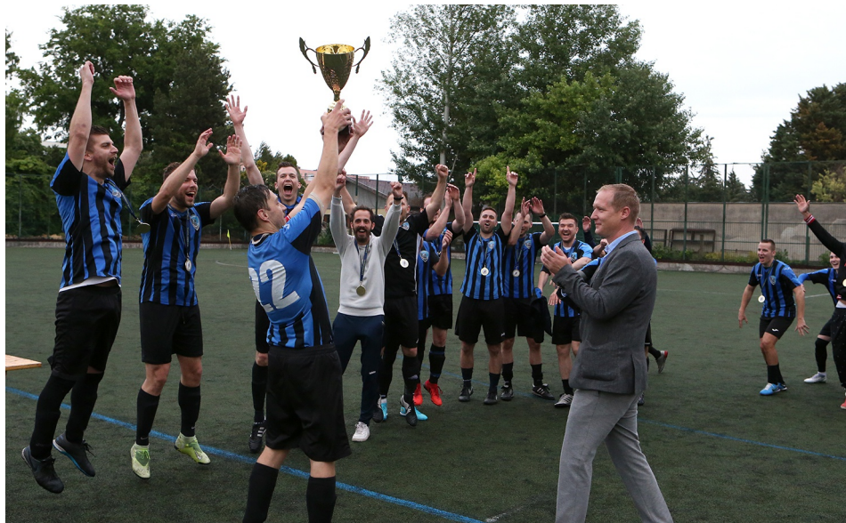
Nagy volt az öröm a BAK utolsó meccse után

A tavaszi idényben folytatódott a sikeres szereplés, ugyan becsúszott két vereség, de a 16. fordulótlól zsinórban hat győzelem következett. Ezzel már biztosították azt, hogy megszerezték a magasabb osztályba kerülést jelentő első két hely valamelyikét. A kérdés csak az