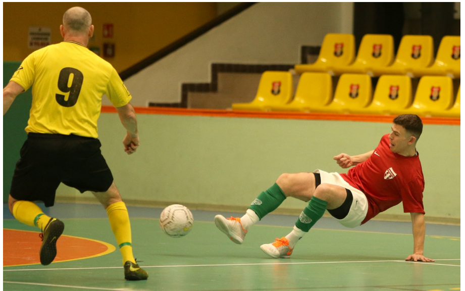
A Pénzügyőr öregfiúk lehenlő volt

A Veterán korosztályban a benevezett nyolc csapat közül a finálét a REAC és az 1. FC Skorpió játszotta. A Skorpió