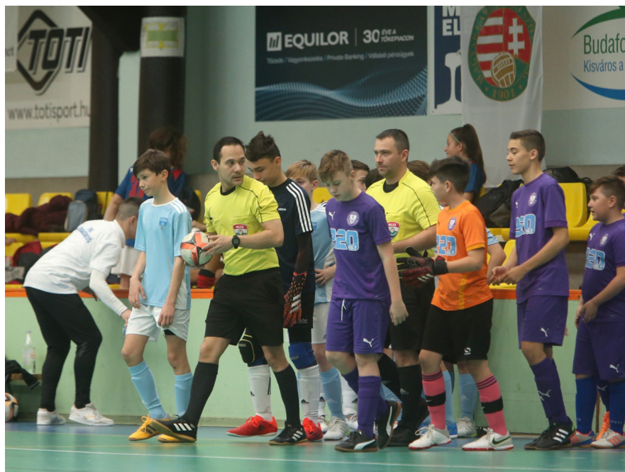
Az újpesti futsal minden szinten ígéretes

Csak budapesti amatőr labdarúgás! www.pestifoci.hu