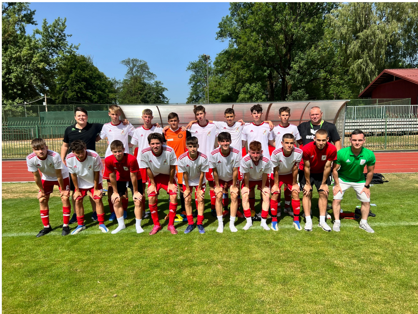
Gyorsan kellett összeállnia, de helytállt a budapesti csapat

Két év kihagyás után a Négy Város Tornáján Budapest, Pozsony, Ljubljana és Zágráb U-16-os korosztályú versenyzői ismét bizonyíthatták tehetségüket labdarúgás, atlétika, kosárlabda, röplabda, asztalitenisz és kézilabda sportágakban.