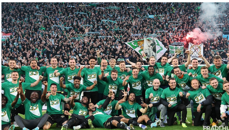
Sorozatban negyedszer lett bajnok a Ferencváros

A Ferencváros bajnoki címét ezúttal sem veszélyeztette senki, magabiztosan nyerték meg az aranyérmet. Ugyan 7 ponttal kevesebbet szereztek, mint az előző bajnoki évben, de ez mit sem von le sikerük értékéből. Az Újpest rajtja katasztrofális volt, a 9. forduló után még nyeretlenek voltak. Az őszi idény hajrájára feljavultak a lila-fehérek, elkerültek a kieső helyről, és tavasszal sikerült felzárkózniuk a középmezőnybe. A Budapest Honvéd is gyengén kezdett, de az őszi végén már a középmezőnyben foglaltak helyet. Tavasszal viszont csúsztak lefelé, és ha az utolsó fordulóban nem nyernek a Puskás Akadémia vendégeként, akkor lehet, hogy kiesnek. Az MTK Budapest biztatóan kezdett, de később elmaradtak az eredmények. Az őszi szezonban kétszer is edzőt váltottak, de így is a kieső helyről várták a tavaszi folytatást. A hajrára ugyan összeszedték magukat a kék-fehérek, az utolsó négy meccsükön 10 pontot szereztek, de így sem kerültek el a kiesést.