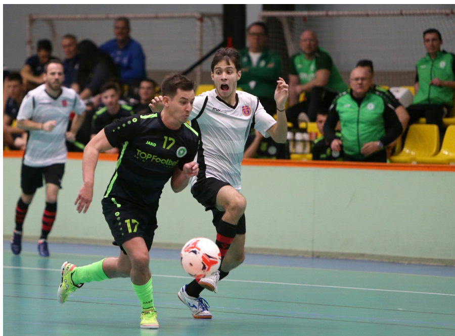
A Nagytétény nem tudta beérni az Airnergy-t

A bronzmérkőzést a Nagytétény és a Rákosmente játszotta. A második félidőre a tétényiek 4-1-es vezetéssel fordultak, ráadásul növelni is tudták előnyüket és már 6-1-re is vezettek, azonban a rákosmenti fiatalok példaértékű kitartásának köszönhetően, talán a téli torna legnagyobb feltámadását mutatták be, és hat perc alatt öt gólt rámoltak be az ellenfelük hálójába. Ezek után már nem született több gól, így jöhettek a büntetőrúgások, ahol a rutinos Nagytétény játékosai hibátlanul lőttek az egyet hibázó Rákosmente FC-vel szemben. A harmadik helyet ezzel a győzelemmel a Nagytétény szerezte meg.