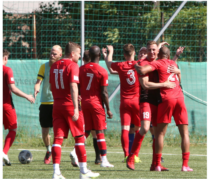
69 alkalommal ünnepelt gólt az Issimo