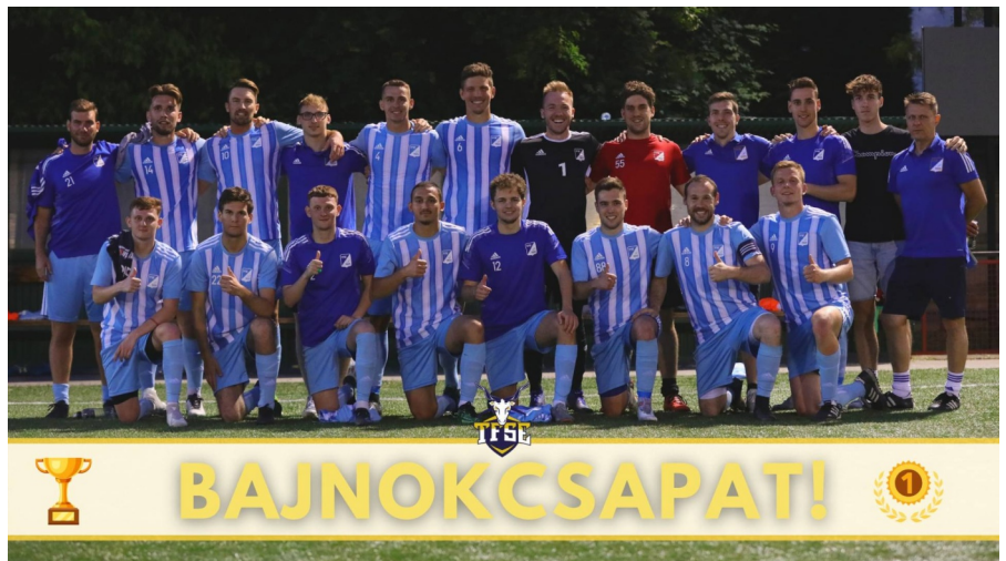
A TF büszke lehet a bajnokaira

Tavasszal folytatódott a TFSE nagy menetelése, és az utolsó előtti fordulóban már eldőlt a bajnoki cím sorsa. Az egyetemi csapat ekkor egy ponttal vezetett a rivális Budai FC előtt. A TFSE visszavágott a Budatéténynek, 3-0-ra győzött,