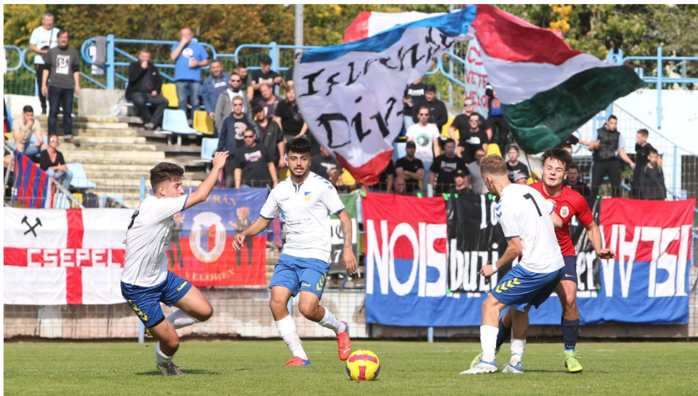
NB I-es hangulat volt a REAC - Csepel mérkőzésen

A Budapest I. osztályban az elmúlt évektől eltérően a 2022/23-as őszi szezon után ezúttal nem két szereplős versenyfutás rajzolódott ki a bajnoki címért folyó küzdelemben, hanem öt csapatnak is reális célja lehet az arany. Az Unione lett az őszi bajnok, de 6 ponton belül sorakozik fel mögötte a REAC, a BMTE II., a Csepel-Csep-Gól és a 43.sz.Építők is.