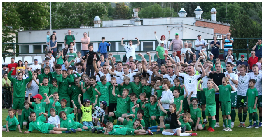
Bajnok lett a Pénzügyőr