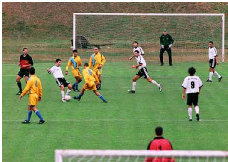
33. Jelenet a MAC – Közterület mérkőzésről 2002-ben.