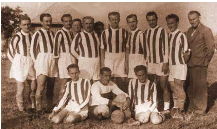
22. A Kelen SC csapata 1948-ban.