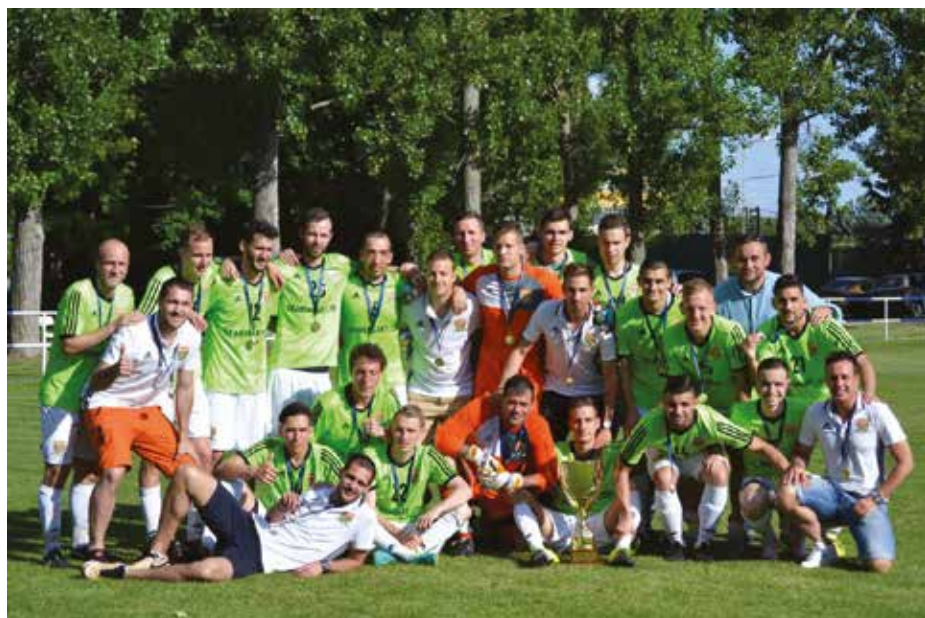
56. A 2016/17 év BLSZ I. osztály bajnoka a THSE – Szabadkikötő.