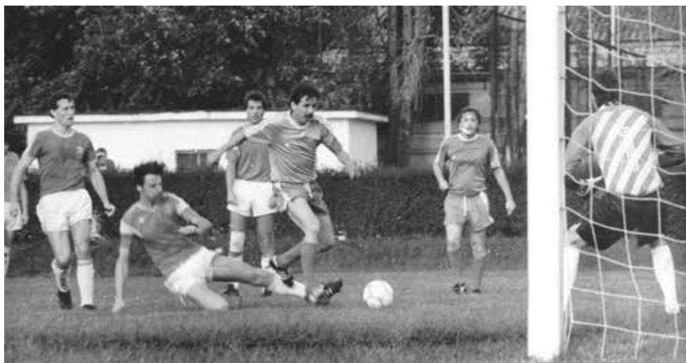
34. Magyar Kábel – ESMTK.