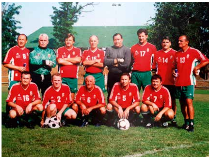
37. A magyar öregfiúk válogatott a 2001. évi jubileumi tornán.