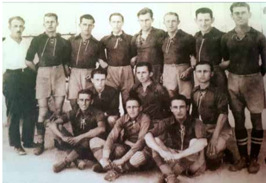
13. Az Erzsébeti TC csapata 1930-ban.