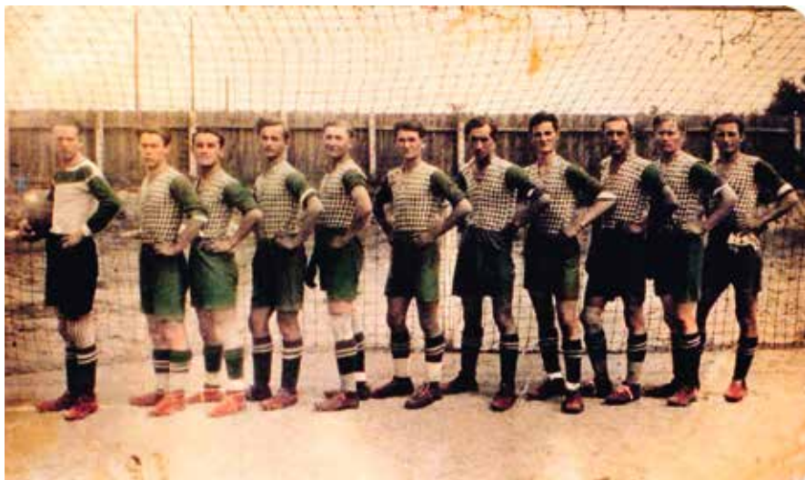
15. A Kelen csapata 1930-ban.