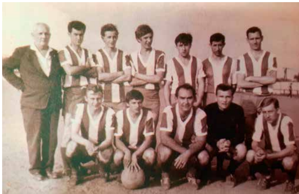
25. Az Erzsébeti Spartacus, 1969.