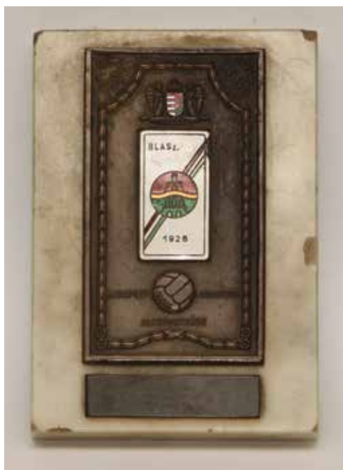
18. A BLASZ fennállásának 10 éves évfordulójára készített emléklakett.