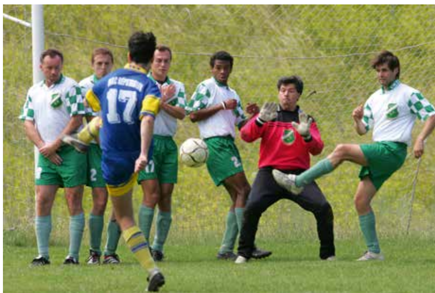
36. Szabadrúgás a MAC – Erdért mérkőzésen 2005-ben.