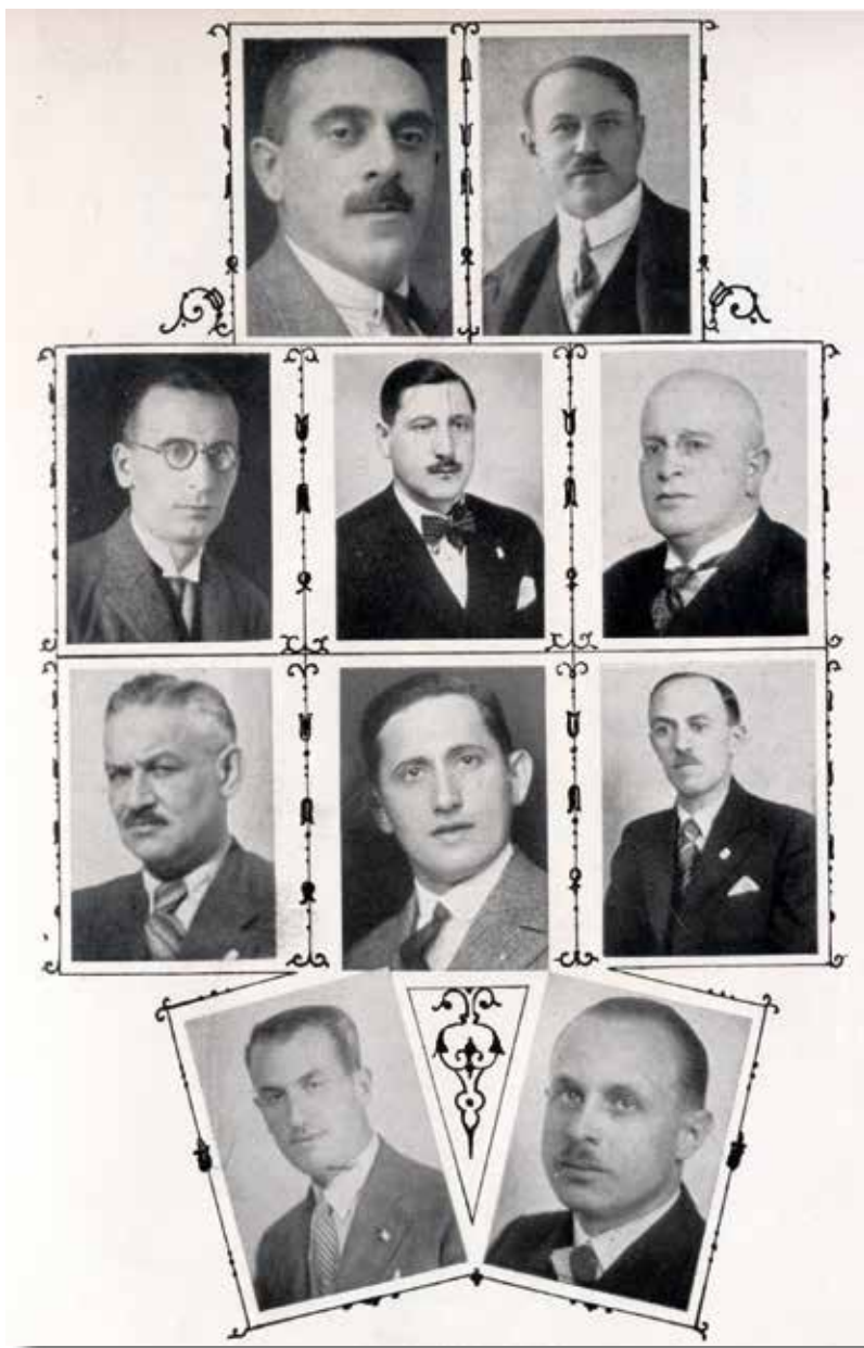
14. A BLASZ elnöksége 1936-ban.