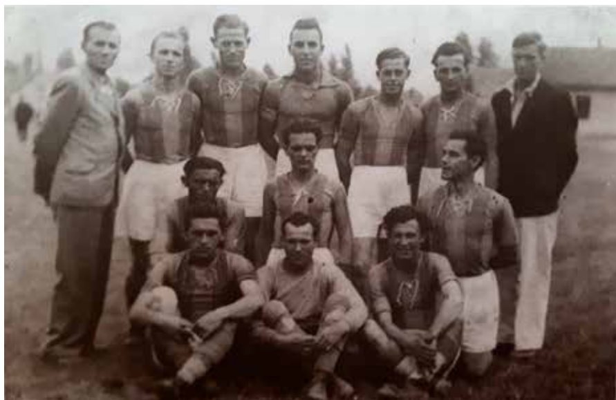
23. A Nagytétény csapata 1945/46-ban.