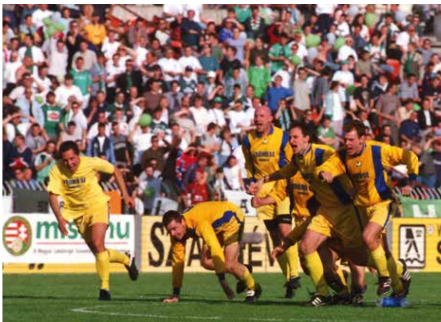
41. A győzelem pillanata. A Bp. Erőmű játékosai ünnepelnek a mindent eldöntő 11-es után a 2002 évi Szabad Föld Kupa döntőjében.