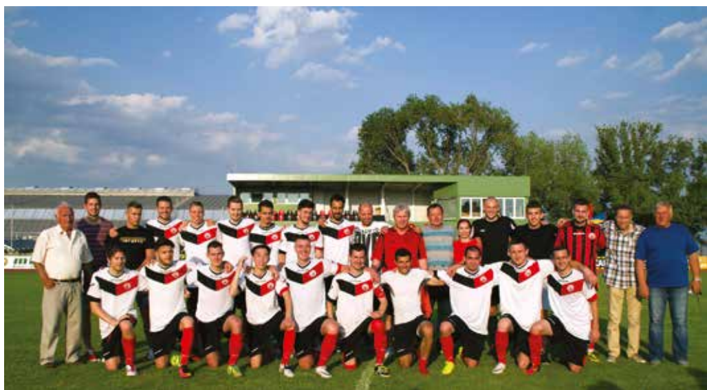
54. A Budafok II. csapata, a BLSZ II. osztály 2016/17 évi bajnoka.