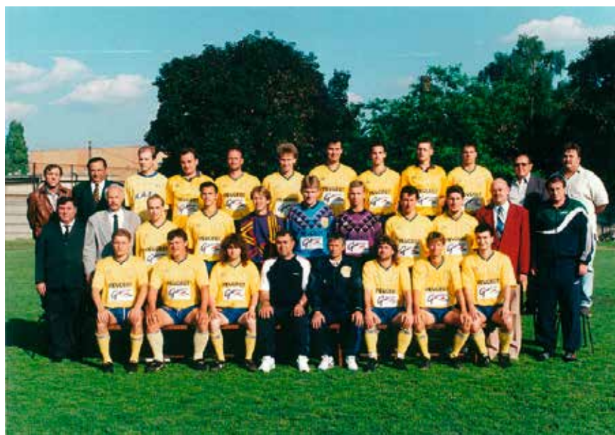
30. A Budapest Kupát végleg elnyerő RAFC csapata, 1997.