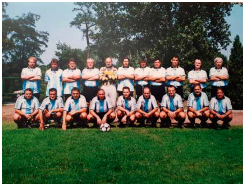
38. A BLSZ edzőválogatottja a 2001. évi jubileumi tornán.