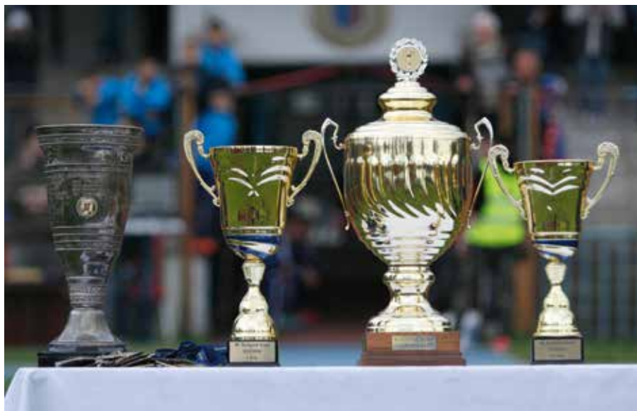
44. A Budapest Kupák. Az első, és a jelenlegi.