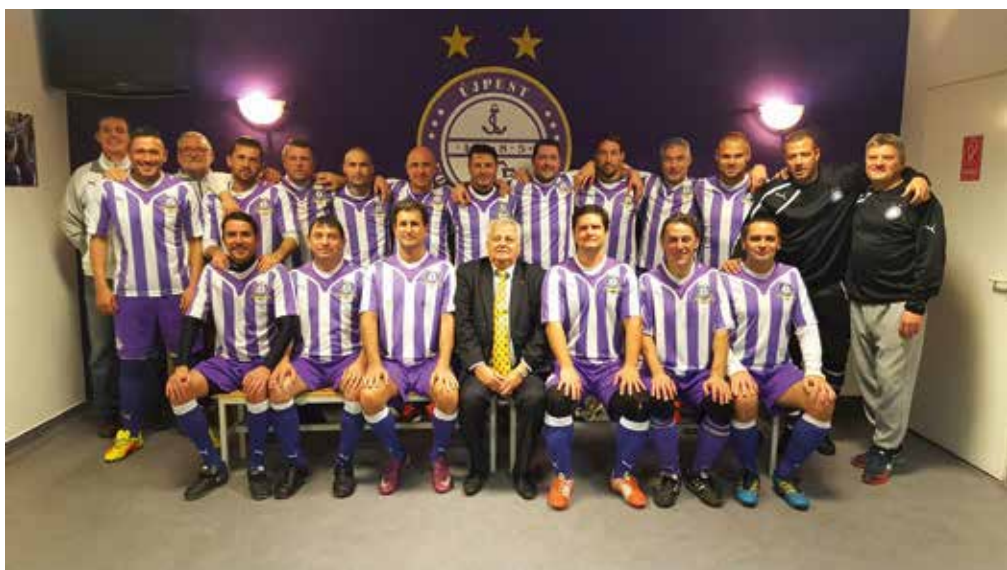
47. Az Újpest öregfiúk csapata.