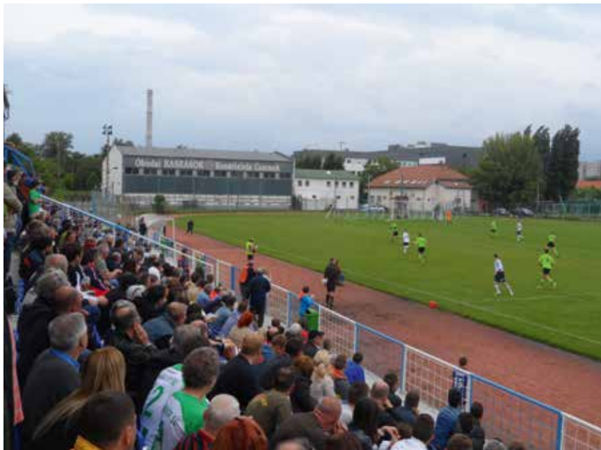
51. III. Kerület – Pénzügyőr rangadó a BLSZ I. osztályban, 2013/14.