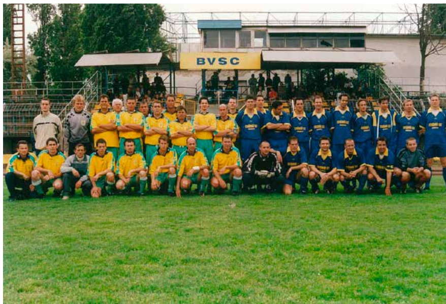
31. BVSC pálya, Budapest Kupa döntő 2003, Erőmű-RSC 2-1.