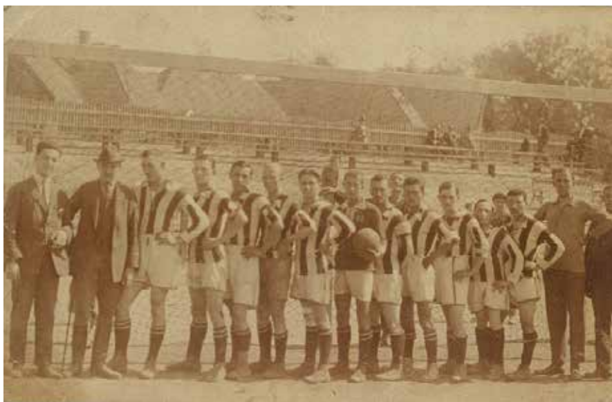
16. Az Elektromos csapata az 1930-as években.