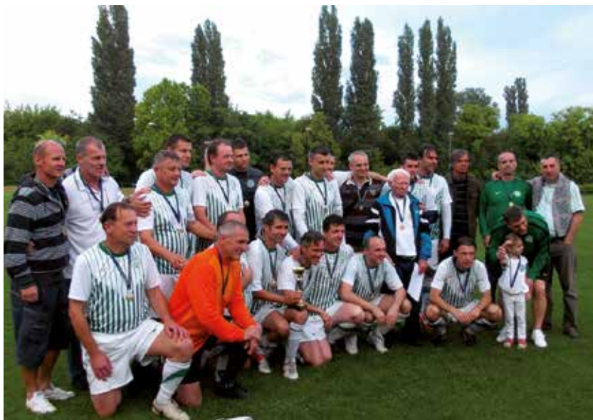
46. Az FTC öregfiúk csapata.