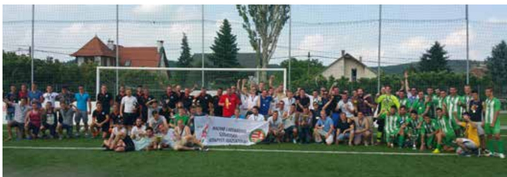
52. A BLSZ III. és IV. osztály Bajnokainak tornája utáni csoportkép, 2015. Hidegkút, TFSE, Pénzügyőr II, Hidegkút II, Pestszentimre SK II, Kelen SC II.