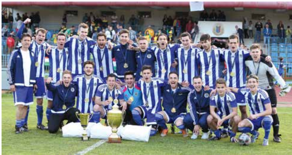
55. A TFSE Budapest Kupa győztes csapata, 2017. A döntőben TFSE – Gázgyár 0-0, 11-esekkel 4:2.