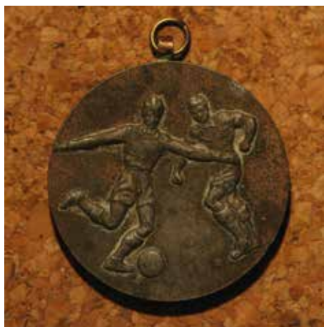
24. A BLSZ ifjúsági bajnokság érme 1962/63.