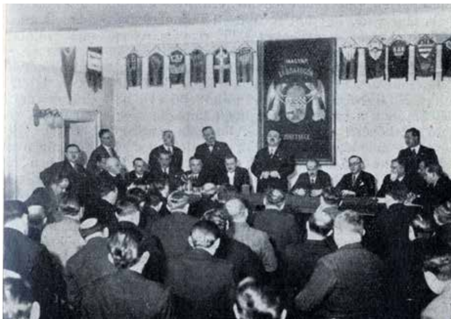
17. Az 1935. február 16-i tisztújító közgyűlés.