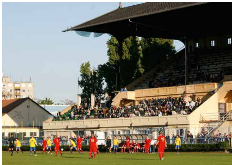
45. BKV Előre stadion, Budapest Kupa döntő, 2012. Grund – Chinoín 0-0, 11-esekkel 4:2.