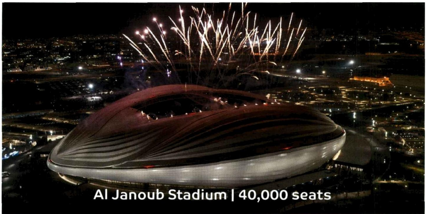
Al Janoub Stadium | 40,000 seats