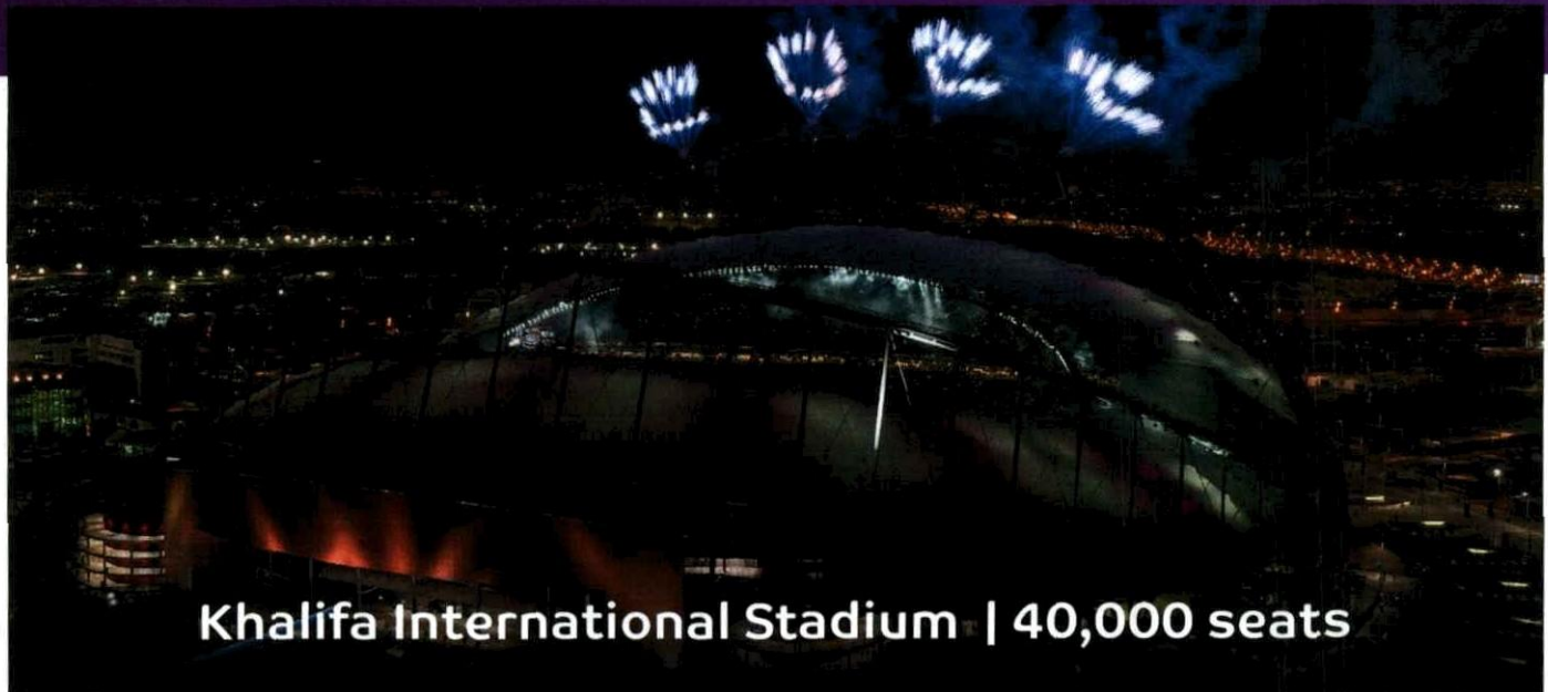
Khalifa International Stadium | 40,000 seats