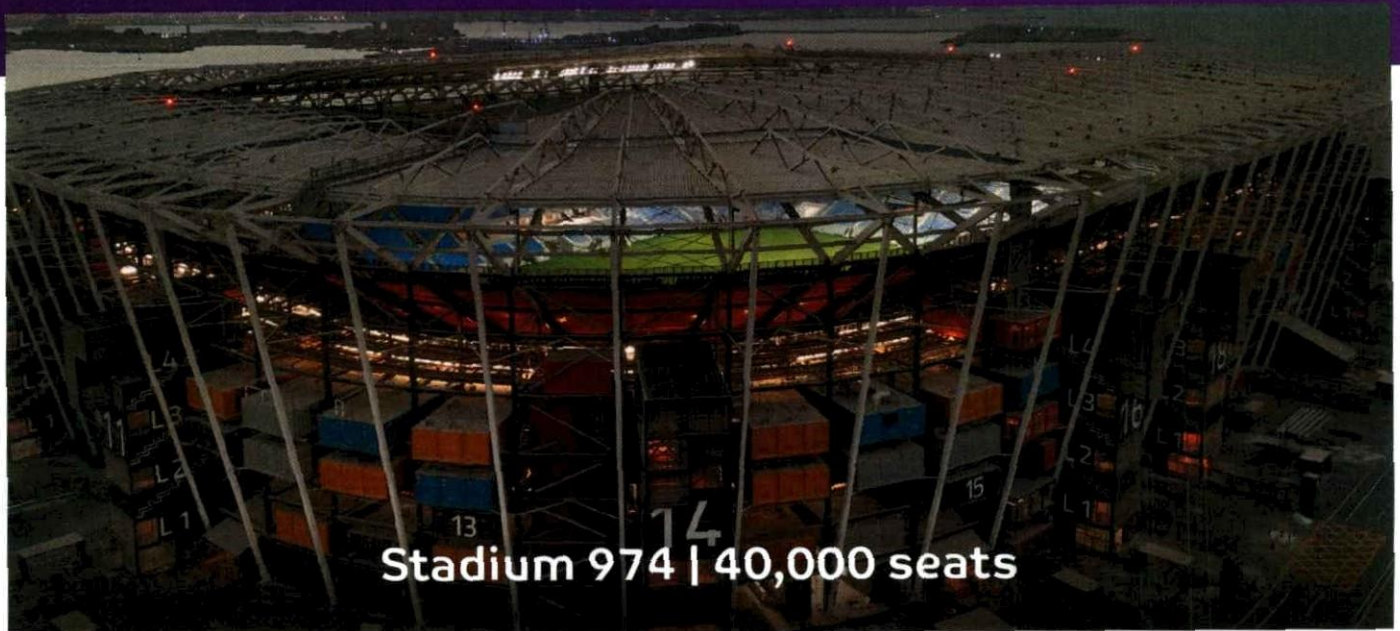
Stadium 974 | 40,000 seats