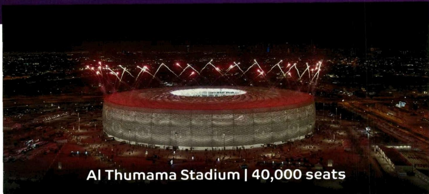
Al Thumama Stadium | 40,000 seats