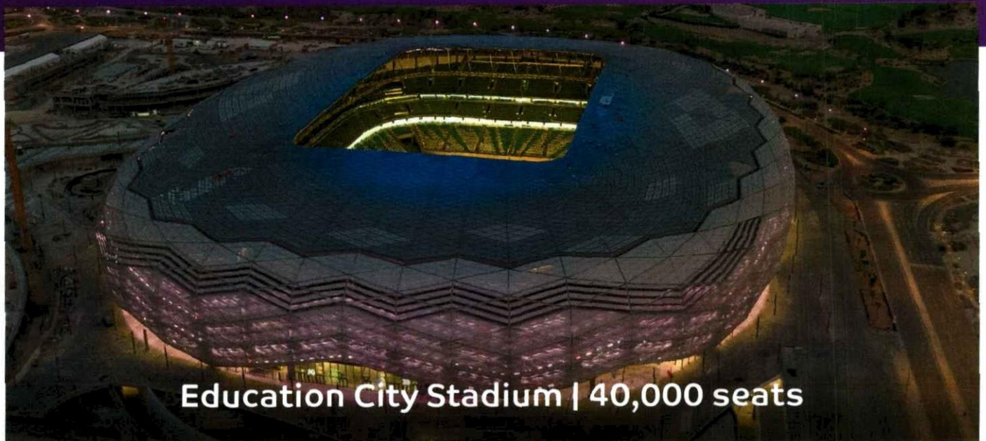
Education City Stadium | 40,000 seats