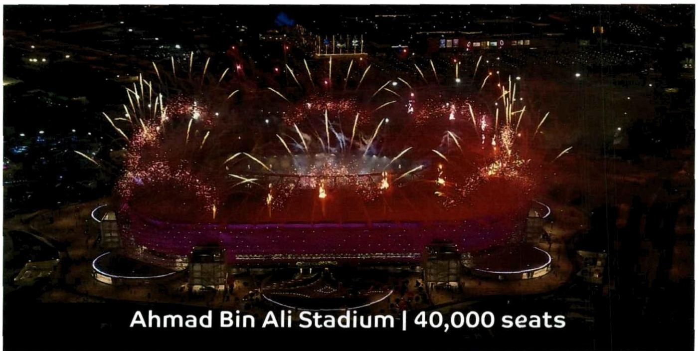
Ahmad Bin Ali Stadium | 40,000 seats