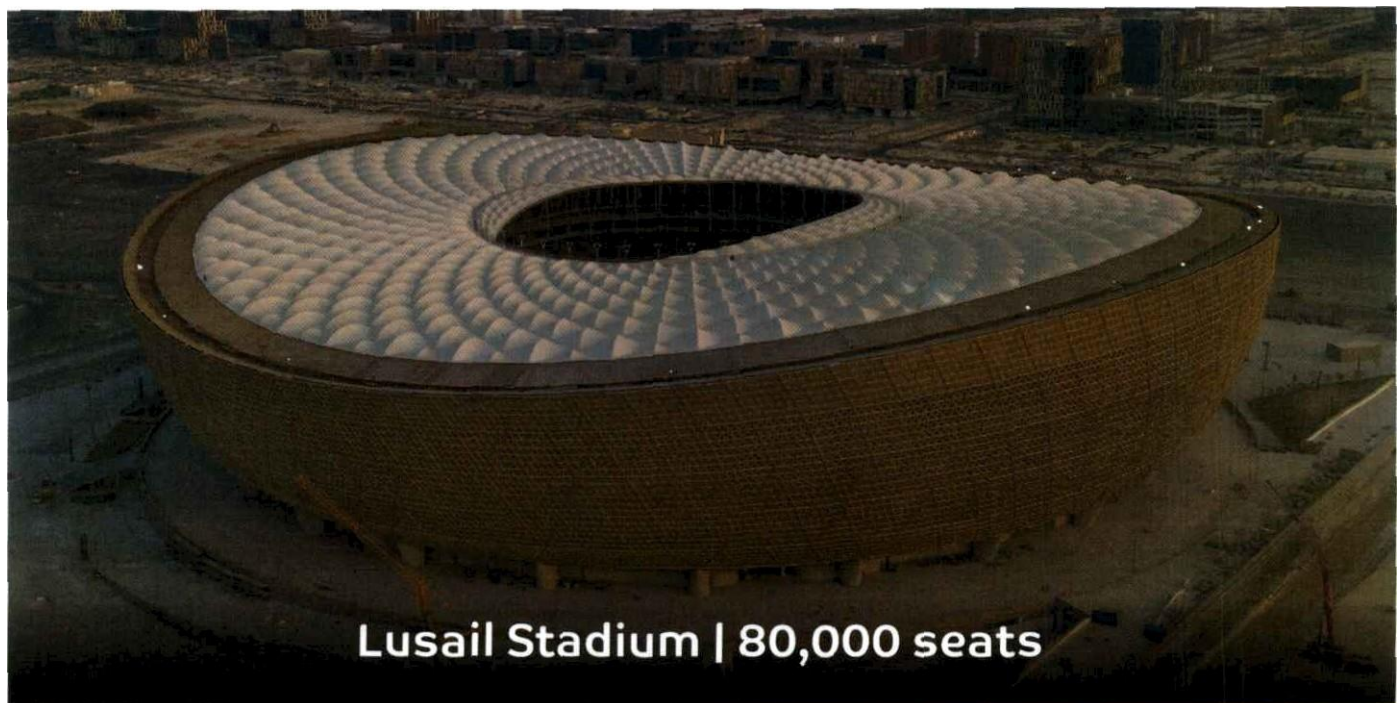
Lusail Stadium | 80,000 seats